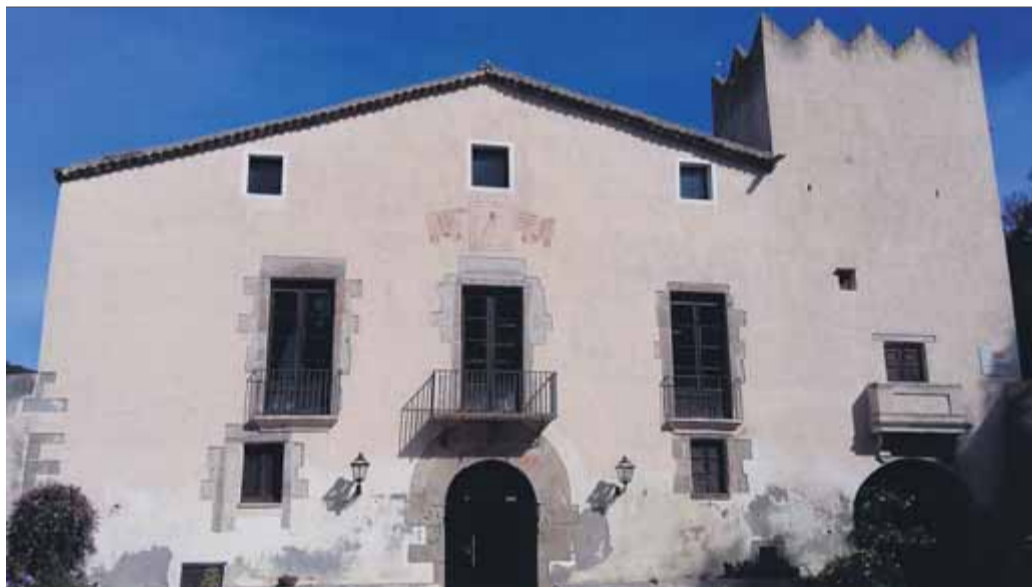
El Soler de n'Hug, de Prats de Lluçanès, a dalt, i Can Magarola, d'Alella, les masies de l'acord

Els silencis. Puigdemont, l'única persona a qui Sánchez havia informat de la reunió vis-à-vis, també va ser la primera a conèixer en boca seva, diumenge, la notícia de l'acord. El president a l'exili, en tot cas, va mantenir la paraula i no s'hivava posar. Ahir ni en va fer esment a xarxes, com tampoc el líder republicà, Oriol Junqueras. Silenci absolut.