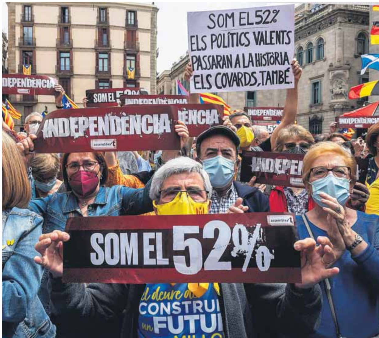
Un moment de la manifestació de l'ANC, diumenge, que reclamava l'acord als partits polítics independentistes

L'entesa, així, certifica la creació d'un nou “Espai de coordinació, consens i direcció estratègica”, com el bateja el text, que no és res més que la taula de direcció col·legiada que esbossava el pacte entre ERC i la CUP, integrat per les tres grans forces parlamentàries independentistes, Òmnium i l'ANC. El nou espai, que tot just es proposen anunciar quan es creï per tot seguit “situar els seus treballs fora del focus mediàtic”, tindrà com a principal feina fixar els objectius estratègics de l'independentisme i concretar propostes de planificació, acció política i mobilització ciutadana encaminades al seu assoliment. Per fer-ho, es bifurcarà en una direcció estratègica política formada per dos o tres representants de cada organització, i un comitè tècnic a banda, amb un o dos integrants més per