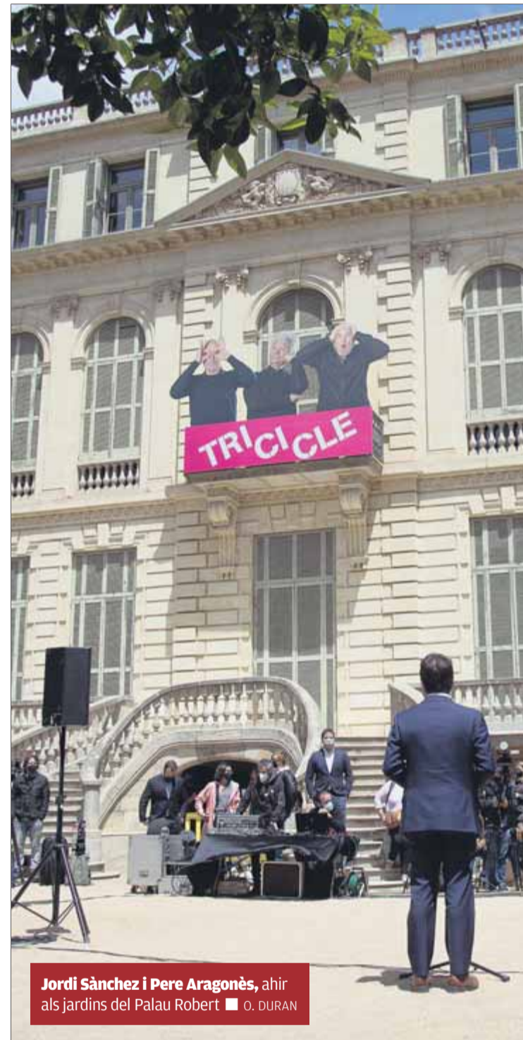
Jordi Sánchez i Pere Aragonès, ahir als jardins del Palau Robert

A banda de la presidència per a Aragonès, ERC tindrà sota les seves regnes un gran departament amb el mateix nom –Presidència–, que a banda de les competències que ja té ara, i que van des de la coordinació interdepartamental fins a les relacions amb les administracions locals, hi afegirà les de relacions institucionals, així com el control de tota l'administració de la Generalitat. Una altra novetat és que des d'aquesta conse-