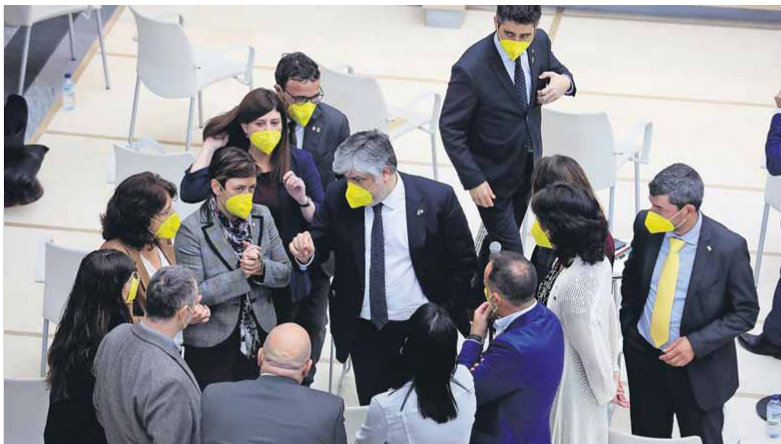
El grup parlamentari de Junts, el dia de la investidura fallida d'Aragonès