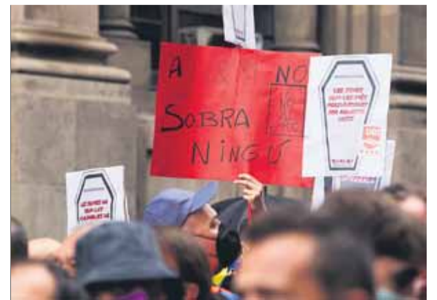
Els sindicats demanen polítiques socials i mesures per evitar els acomiadaments. A la foto, protesta d'H&M

que viuen molt bé gràcies al separatisme", va dir. La líder del partit taronja també va advertir que "aquest acord és el preludi dels indults" dels condemnats per l'1-O, "uns senyors -va dir- que no es penedeixen de res, que no han deixat enrere la seva radicalitat". "En comptes d'indultar els autònoms, les famílies que no poden més, es dedicaran a indultar els qui van fer un cop d'estat i estan amargant la societat catalana." ■