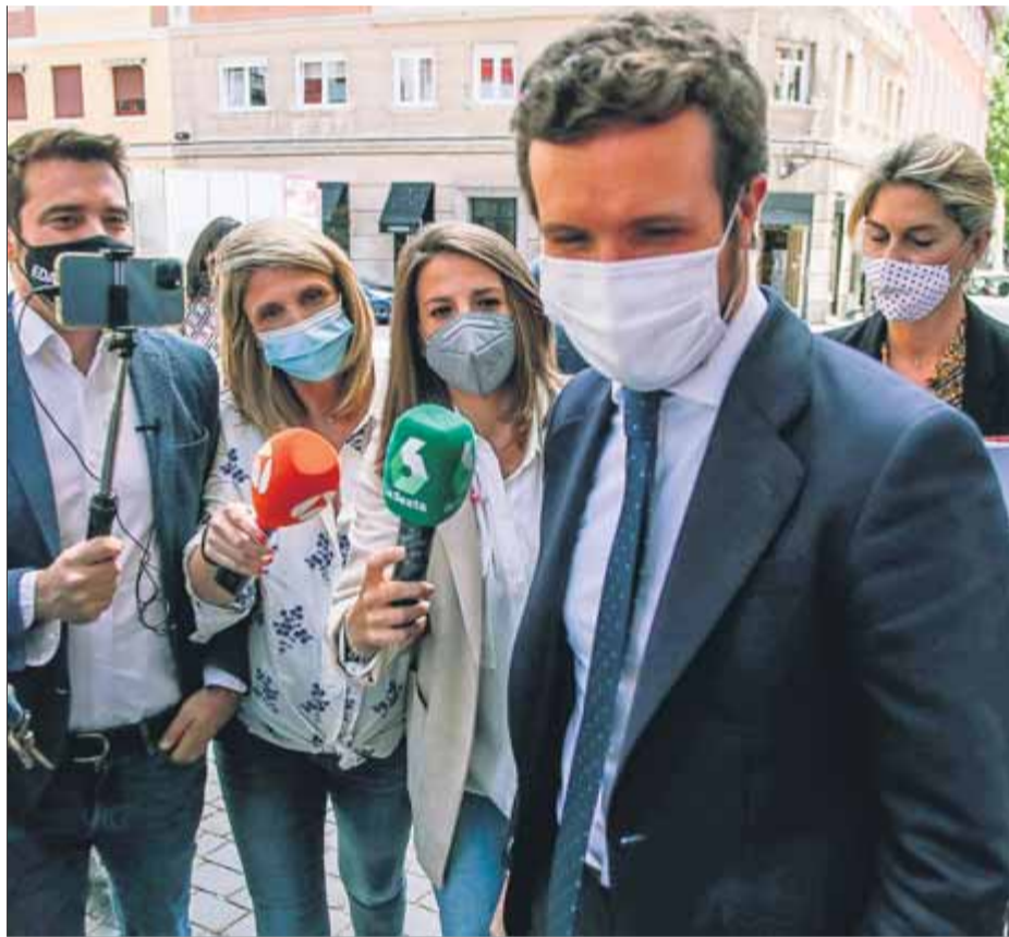
Casado, ahir a Madrid, sortint d'unes jornades de la Fundació Concordia y Libertad

Tornant als inconvenients de tornar a posar sobre la taula la república catalana, el ministre de Transports i secretari d'Organització del PSOE, José Luis Ábalos, va dir: "Prioritzar l'independentisme no ens sembla el més ajustat, quan les enquestes diuen clarament que el sentiment independentista està baixant a Catalunya."