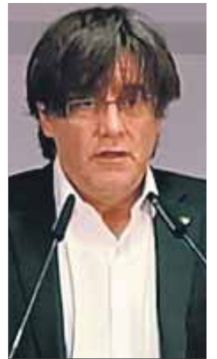
Carles Puigdemont ■ CxR