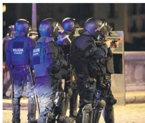
Antiavalots dels Mossos en una protesta a Girona ■ Q. PUIG

Una de les grans novetats, impulsada per la CUP, és aprovar una modificació legislativa per garantir que la Generalitat "no participi en acusa-