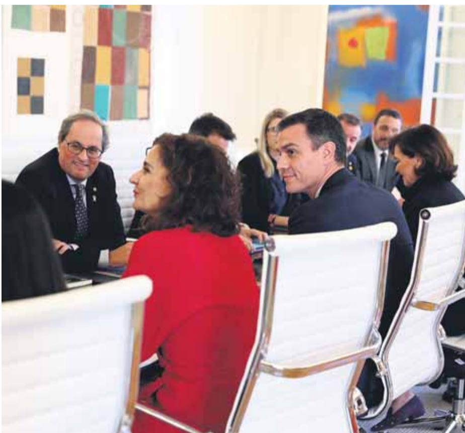
Torra i Aragonès davant de Sánchez i Montero el 26 de febrer del 2020 a La Moncloa

Si a Vox Jorge Buxadé ja avisa que convocarà marxes contra l'indult, al PP Pablo Casado hi veu la mort de la legislatura i es prepara per impugnar-los. "Si el govern concedeix un indult en contra de la fiscalia o del tribunal sentenciadors, el PP els recorrerà en contra al Suprem. El primer que cal és penediment, i els que el demanen han fet tot el contrari: en la investigació d'Aragonès els senyors d'ERC i Junts van dir que ho tornarien a fer", avisa el secretari general, Teodoro García Egea. El recurs al Suprem, però, està previst per defectes de forma. ■