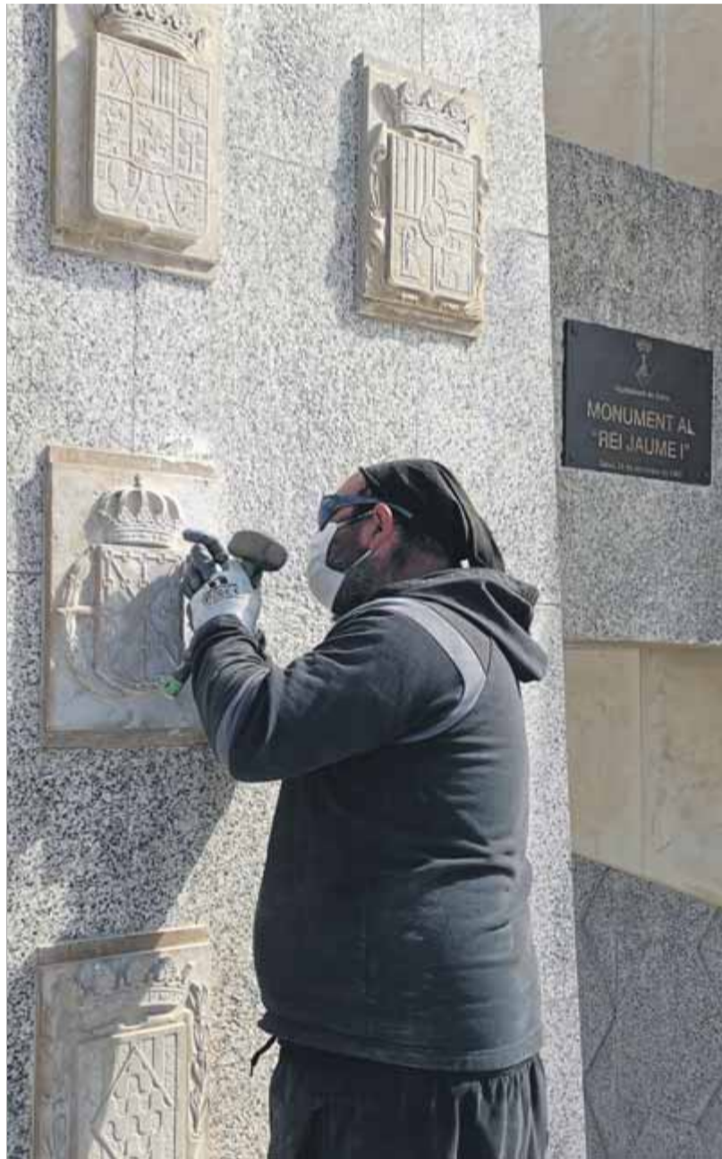
Un operari, treu la 'laureada' de l'escut de Navarra al monument a Jaume I, a Salou

monuments de commemoració del règim franquista encara s'exhibeixen a Catalunya. El de Tortosa, un dels més significatius, es retirarà aquest estiu, segons el departament de Justícia.