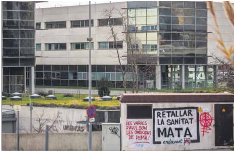
Reivindicacions davant l'hospital de Mataró, un dels més tensionats del país

De moment, sobre el paper, l'acord de govern no preveu noves inversions més enllà de les ja conegudes o somiades. D'una banda, es continuaran reivindicant a l'Estat 5.000 milions d'euros addicionals durant els pròxims cinc anys per pal·liar l'infr finançament sanitari històric. De l'altra, s'activarà un pla d'enfortiment de l'atenció primària amb una inversió de gaire-