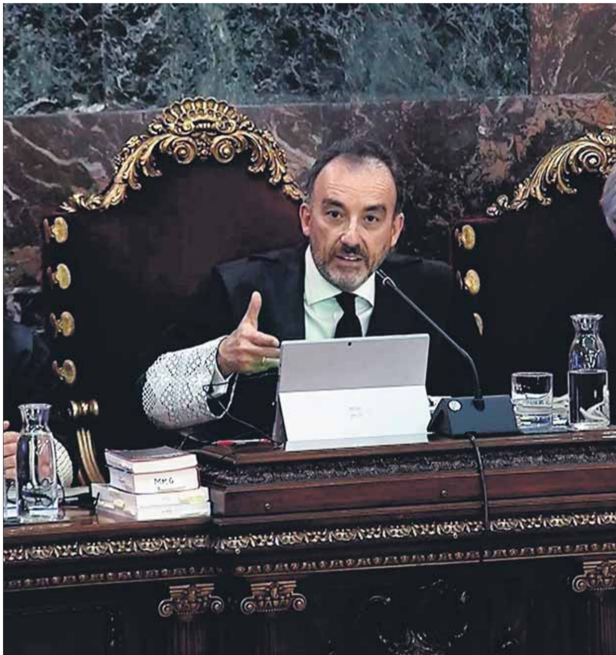
El magistrat Manuel Marchena, en el judici contra els independentistes catalans, el 2019