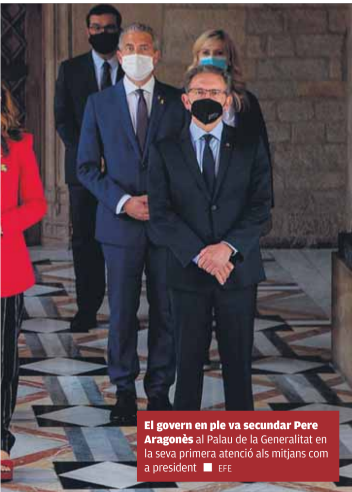
El govern en ple va secundar Pere Aragonès al Palau de la Generalitat en la seva primera atenció als mitjans com a president