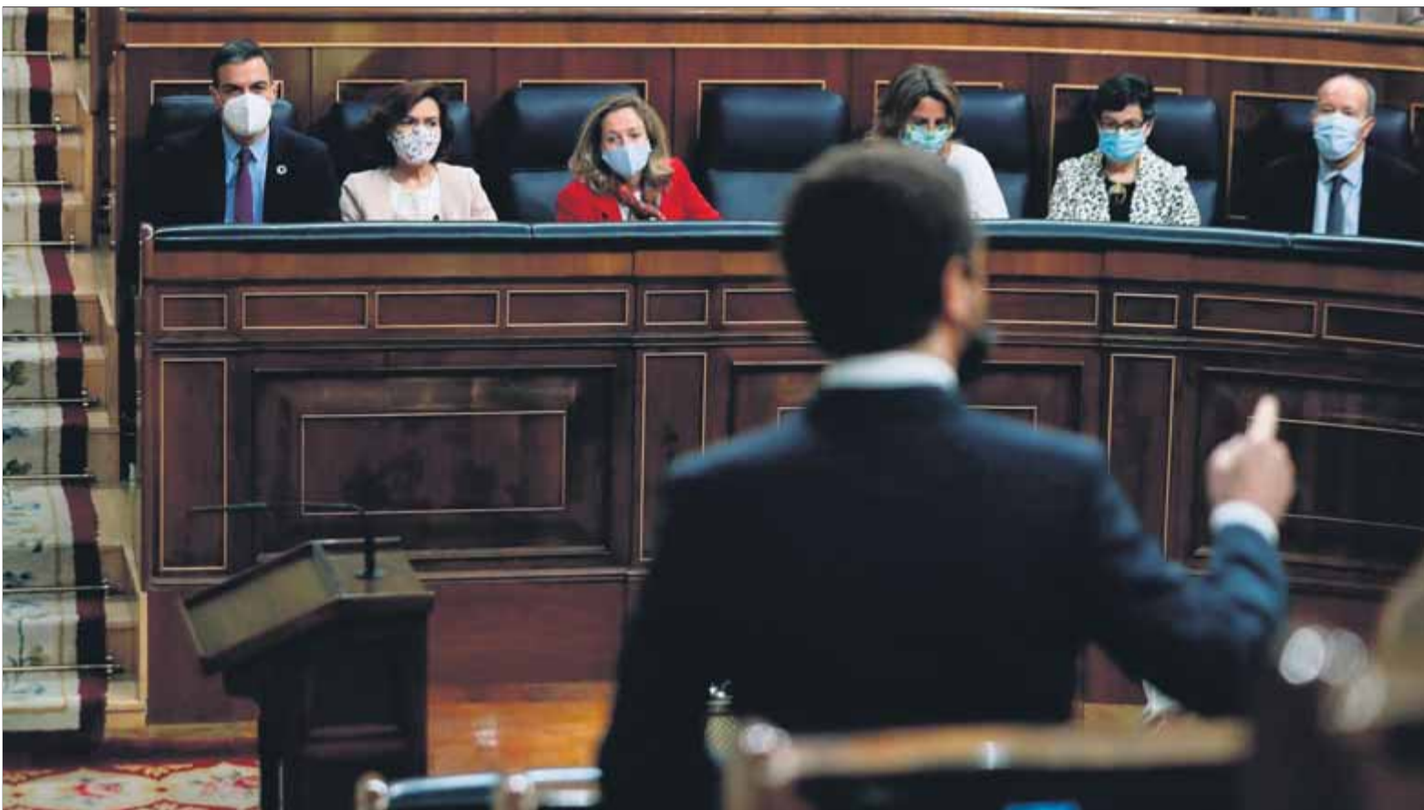
Pedro Sánchez i bona part del seu govern, amb el ministre Campo de Justicia, escoltant Pablo Casado, ahir al Congrés, sobre l'indult