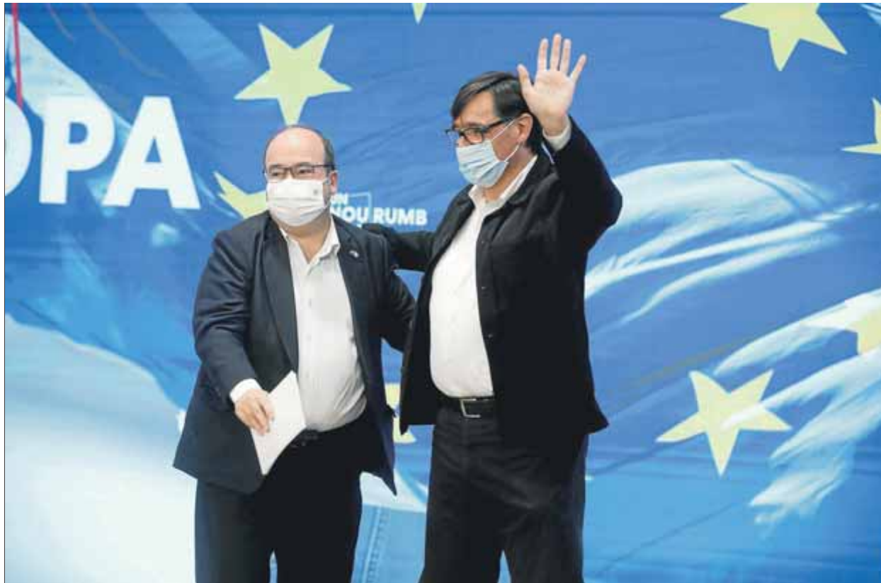
Iceta i Illa en la commemoració del Dia d'Europa al Casal Joan Raventós del Poblenou barceloní

Illa, per la seva banda, va aplaudir “el lideratge fort” que, segons ell, el president espanyol ofereix a Catalunya per fer possible el retrobament. El líder