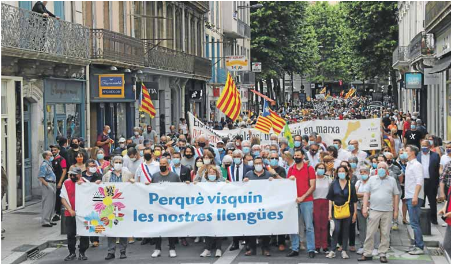
La manifestació, amb milers de persones, va recórrer els carrers del centre de Perpinyà

■ Milers de persones es manifesten, també en altres indrets, contra la sentència del Constitucional francès ■ S'oposen a la censura dels articles més ambiciosos de la llei sobre llengües regionals