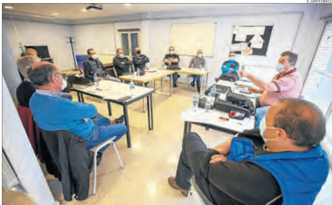
Imatge de la reunió d'ahir de l'associació de bombers voluntaris a Torà.

Asseguren que l'executiu català els imposa els mateixos requisits que als professionals