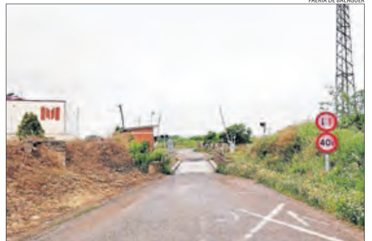
El pas a nivell del polígon de Balaguer que se suprimirà.