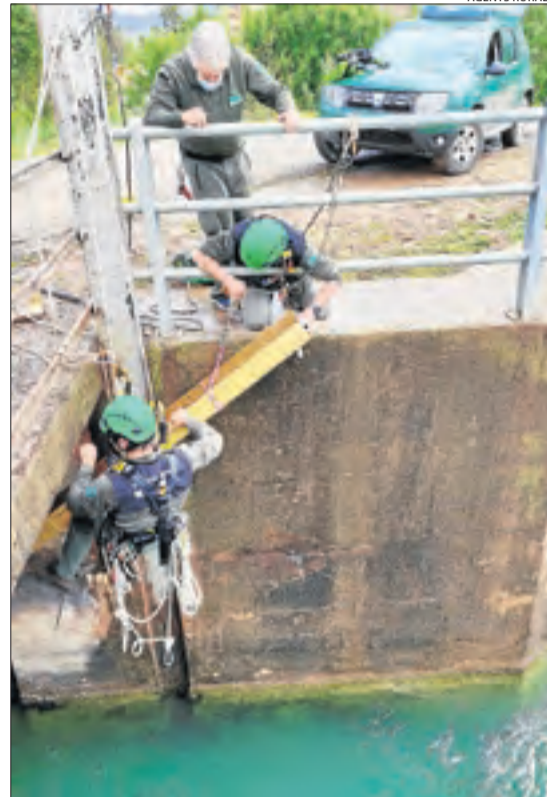
Rurals col·locant una rampa al Jussà.

tació d'aigua del Segarra-Garrigues. D'altra banda, els Agents Rurals han instal·lat al costat de l'elèctrica Enel dos rampes al canal de Gavet de la Conca, on havien arribat a rescatar uns 230 animals protegits a l'any entre serps, granotes, gripaus i llangardaixos.