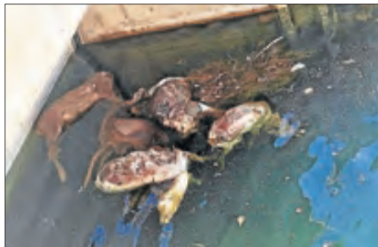
Cabirols ofegats al Segarra-Garrigues.

Ipcena es va referir concretament a rampes i a baranes i reixes als dos costats del canal.