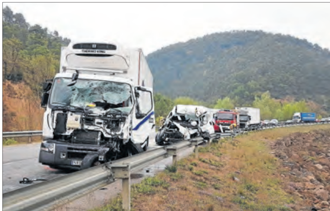
Imatge de l'accident mortal que va tenir lloc el 20 d'abril passat a la C-14 a Oliana.

En els dos últims anys, les xifres de sinistralitat mortal a la carretera han baixat de la desena a les comarques lleidatanes entre els mesos de gener i abril, sent 2020 i 2021 els anys amb una xifra menor de víctimes mortals en accidents dels últims sis anys. En el balanç