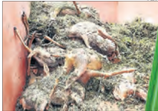
Els animals trobats en un dipòsit.

L'entitat va exigir al Canal d'Urgell que prengui mesures més eficaces per evitar la mortaldat d'animals i va dir que demanarà a la conselleria de Territori que imposi als regants l'aplicació d'aquestes mesures.