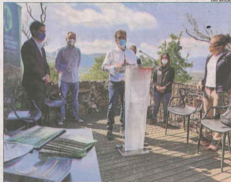
El Festivals de Senderisme dels Pirineus es va presentar ahir a Olot.

Rutes guiades a peu, amb activitats culturals i gastronòmiques a les onze comarques del Pirineu