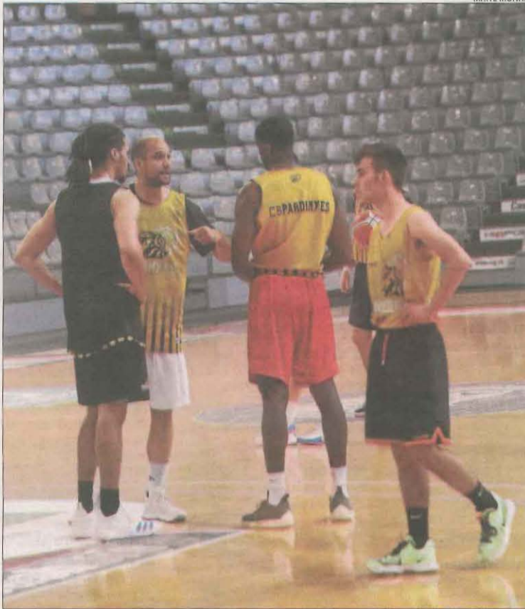
El Pardinyes va tornar a les sessions d'entrenament dilluns.

Sobre com pot afectar aquesta aturada de deu dies, Encuentra va assenyalar que "físicament arribarem minvats. La sensació és que ens faltaria una mica per arribar al nivell en què ens trobàvem i més tenint en compte el ritme amb què ens agrada jugar. L'equip ho notarà, arribem una mica justos". Quant al rival, l'entrenador del Pardinyes va dir que "és un equip molt sòlid i dur en defensa. Si han quedat tercers al grup Oest de LEB Plata és gràcies al seu