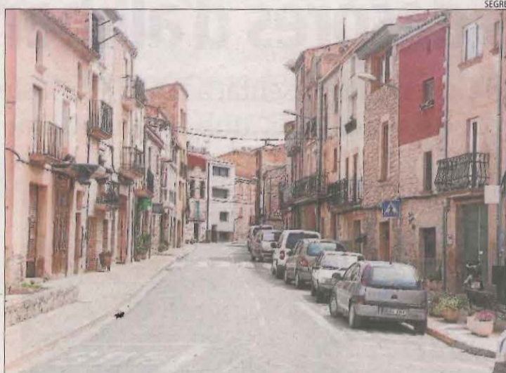
Imatge d'arxiu de Maldà, un dels municipis seleccionats.

Per la seua part, els ajuntaments d'Almatret i Llardecans van explicar que el projecte consisteix a rehabilitar dos habitatges i llogar-los. Van assenyalar que donaran prioritat a "famílies amb nens en edat escolar i amb ocupació estable, així com persones amb projectes emprenedors".