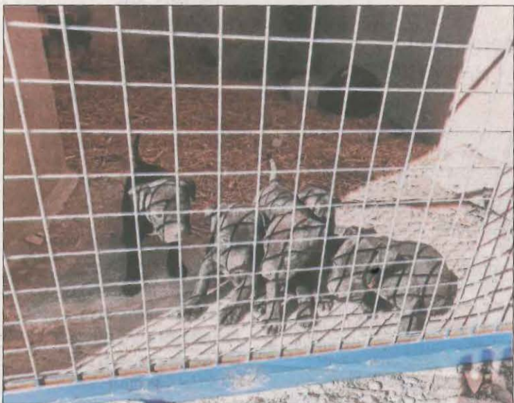
Imatge dels cinc cadells que han estat robats.

A un dels afectats li van sostreure tota mena de material i cinc cadells d'american stanford || D'un magatzem es van emportar bateries i radiadors de tractor