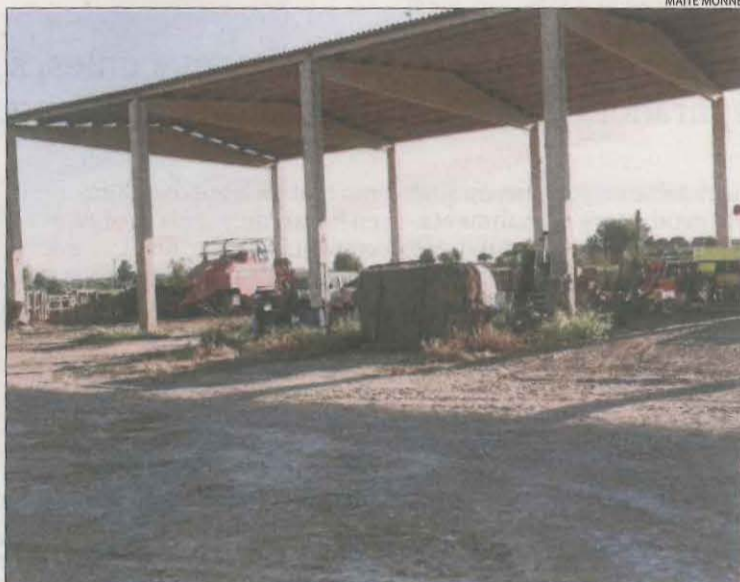
D'aquesta finca es van emportar bateries i radiadors de tractors.