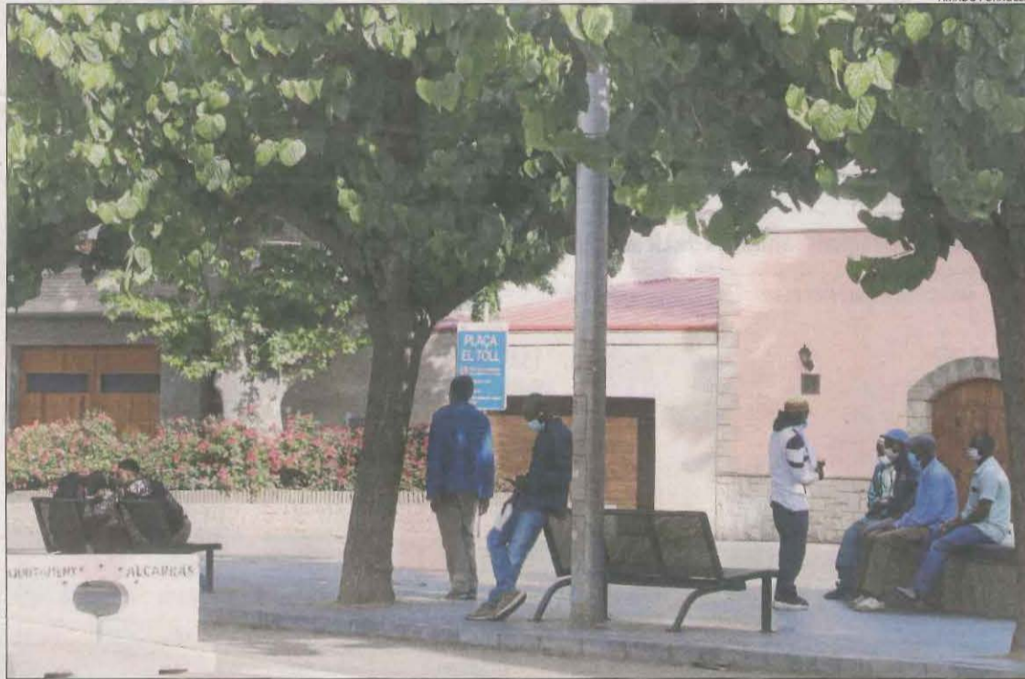
Imatge d'una plaça d'Alcarràs, on ja han arribat temporers per a la campanya de la fruita.

Per la seua part, Asaja va recordar que la vacunació de temporers és una reivindicació que fan des de l'octubre. El seu presi-