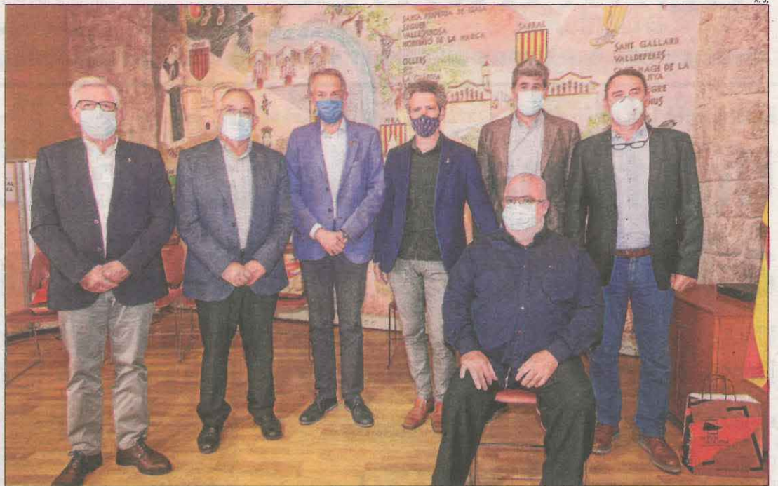
Els presidents dels set consells que firmen el manifest que exigeix frenar l'allau de renovables.