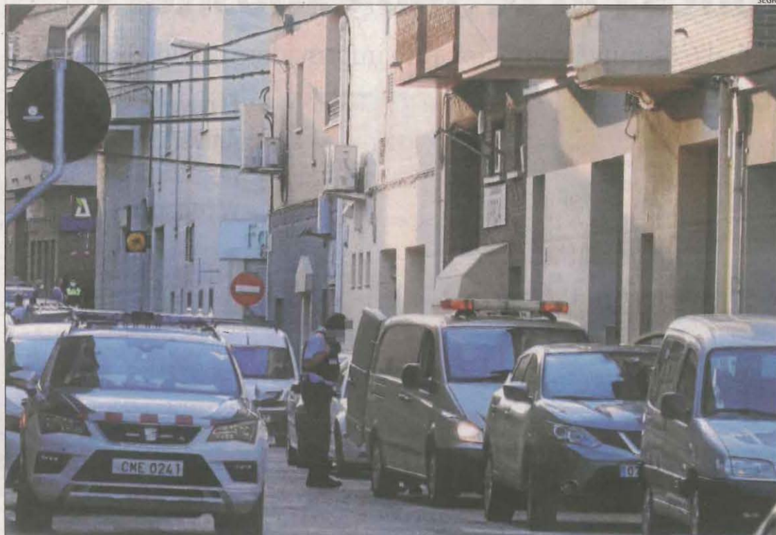
L'accident es va produir ahir a la tarda a l'habitatge de la víctima, al carrer Joan Maragall d'Aitona.

L'home necessitava cadira de rodes i en el moment de l'accident estava pujat al muntacàrregues de casa