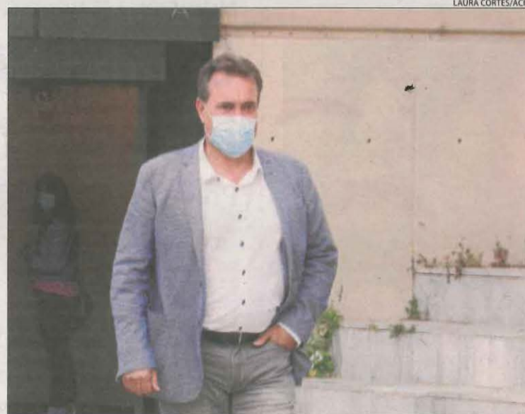
L'alcalde d'Almacelles, dilluns a l'entrar als jutjats.

Un policia local va admetre que va accedir a la plaça sense el graduat, càrrec que va ocupar durant set anys