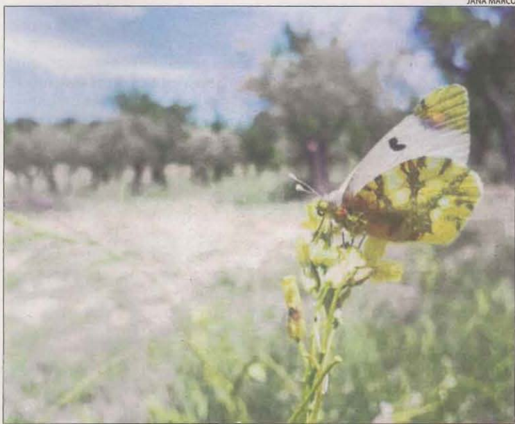
Un exemplar de la papallona 'Zegris eupheme'.

|| LLEIDA | Una prospecció duta a terme el passat mes d'abril en el marc del projecte Microrreserves papallones , finançat pel departament de Territori i desenvolupat per l'entitat Paisatges Vius amb el suport del Museu de Ciències Naturals de Granollers, ha permès detectar a Ponent exemplars de Zegris eupheme , coneguda en català com a aurora dels guarets, una espècie de papallona en perill d'extinció de la qual feia catorze