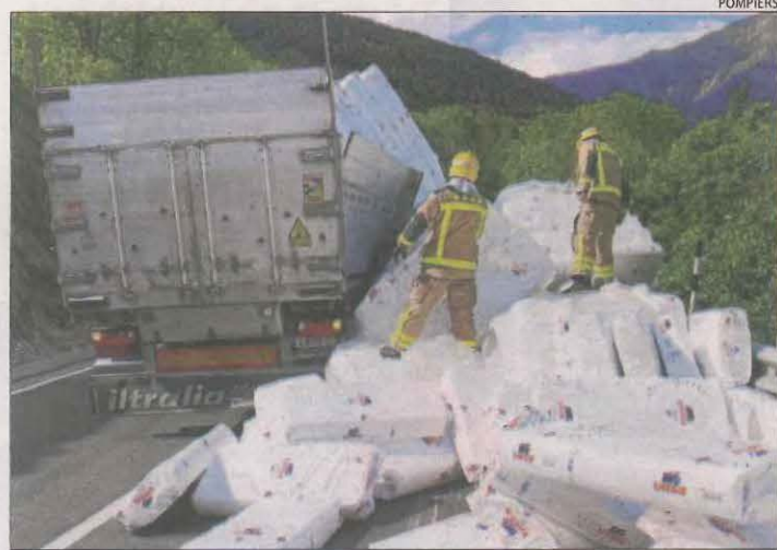
Els Pompiers van treballar ahir en l'accident a Vielha.