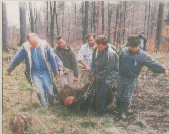
Imatge d'arxiu de la captura de Giva a Eslovènia.

França va deixar anar cinc ossos per reforçar el 2006: Palouma, morta en una caiguda dies després d'alliberar-la; Franska, atropellada el 2007 i amb impactes de perdigons; Balou, mort per una caiguda el 2014; Sarousse, morta a trets el 2020 a Osca, i Hvala, mare de nombrosos exemplars.