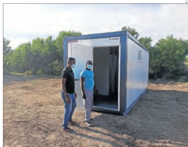
Mòdul per a treballadors de la fruita a Torrelameu.