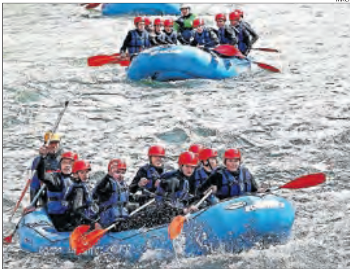
Grups d'escolars en una baixada de ràfting per la Pallaresa.

Quant als esports d'aventura, aquesta setmana han tingut entre 600 i 700 activitats de grups escolars, uns clients que van recuperar la setma-