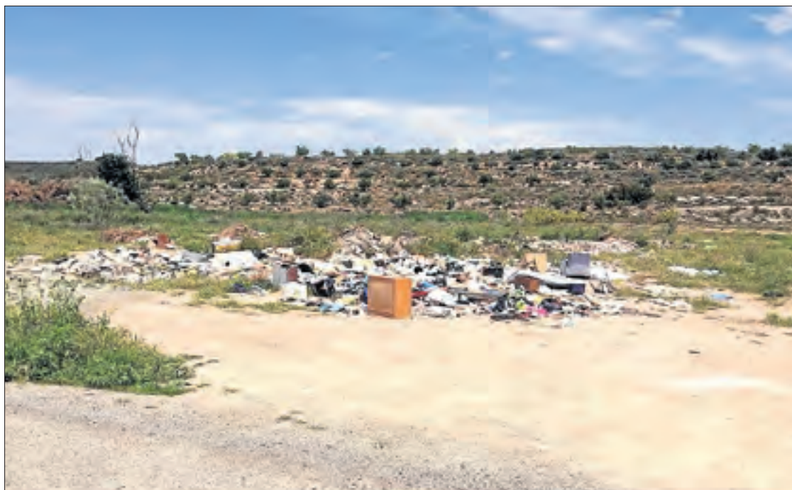
L'abocament d'escombraries a la finca municipal d'entrada a la reserva de Mas de Melons a Castelldans.