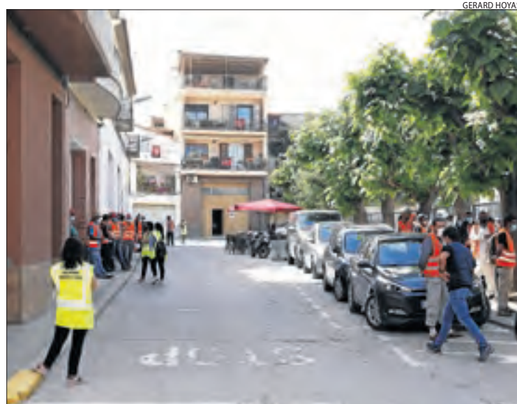
Cua de temporers per vacunar-se a Soses.

SOSES/TORRELAMEU | La campanya de vacunació a personal del sector hortofructícola del Baix Segre va continuar ahir a Soses amb 350 dosis més de Janssen que se sumen a les 360 que es van posar dimecres. Avui estan citades 900 persones més i també es vacunarà a Alcarràs. Per la seua part, l'ajuntament de Torrelameu i el consell de la Noguera han instal·lat un mòdul per a temporers. Així mateix, l'Hotel Nastasi obrirà per acollir contagiats el 14 de juny.