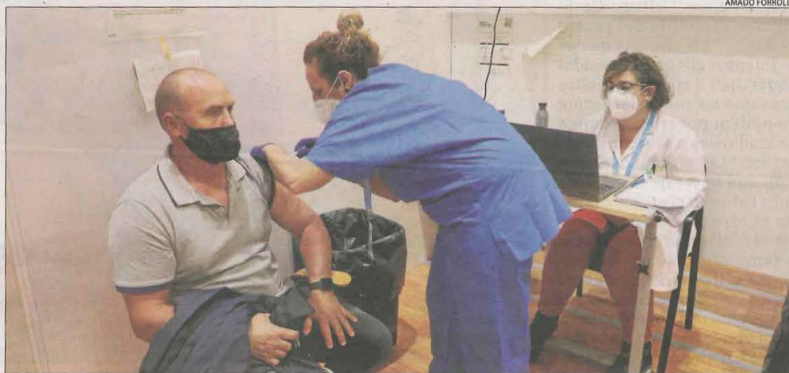
La vacunació contra la Covid-19 avança a bon ritme a Lleida.

Així mateix, les vacunes Pfizer i AstraZeneca són altament efectives contra la nova variant índia del coronavirus, ja que ofereixen un 88% i un 60% de protecció, respectivament, després de la segona dosi, segons un estudi divulgat per l'organisme públic sanitari Public Health England. A més, el president del Govern central, Pedro Sánchez, defensarà avui a Brussel·les millorar el mecanisme de distribució de vacunes per accelerar el procés cap al final de la pandèmia.