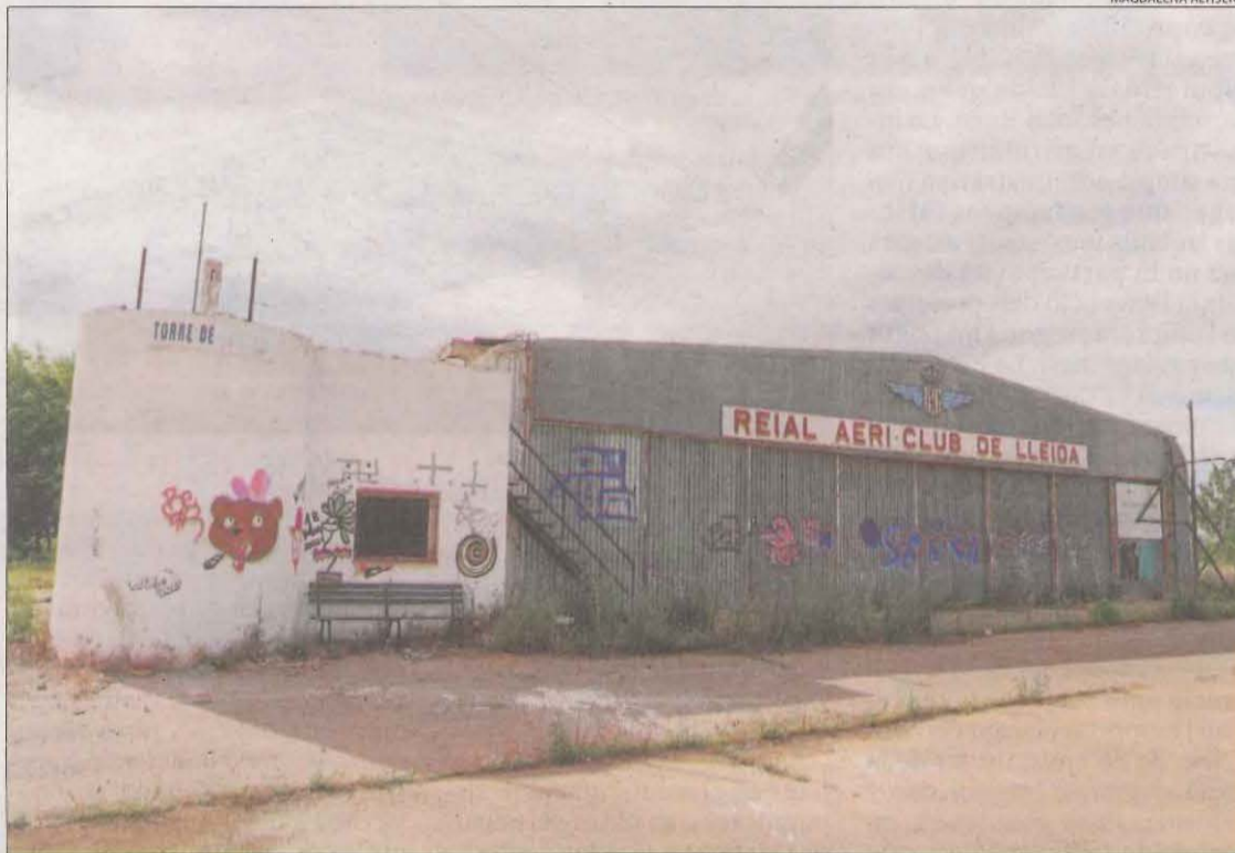
Estat actual de les instal·lacions de l'aeròdrom d'Alfés, abandonat des del 2015.

L'alcalde d'Alfés, Hilari Guiu, va dir ahir desconèixer la ini-