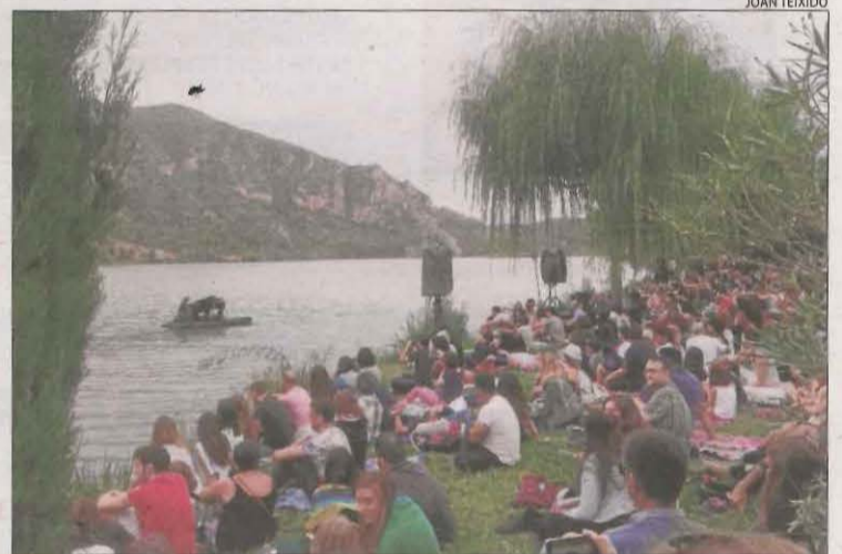
'Le Piano du Lac', el 2018 al Segre a Sant Llorenç de Montgai.