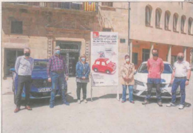
La presentació del Mercat del Vehicle d'Ocasió de Tàrrrega.