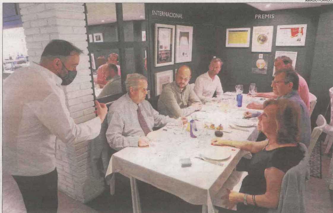
Les taules dels restaurants ja poden tenir sis comensals des d'ahir.

Precisament, de les 47 PCR que es van portar a terme al mercadillo del Camp d'Esports de Lleida dijous passat, només es va detectar un cas positiu de Covid.