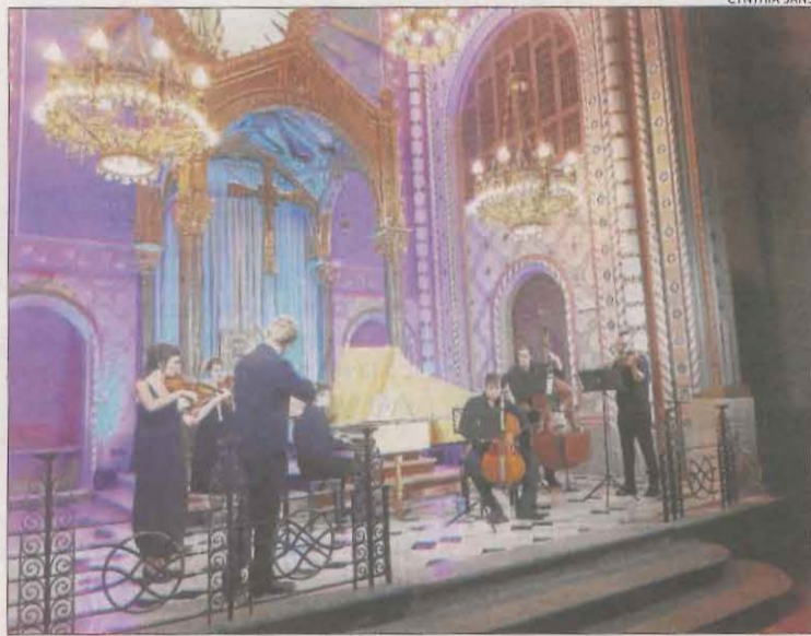
L'orquestra Vespres d'Arnadí va clausurar l'última edició, el 2019.

El conjunt musicovocal recuperarà aquesta composició especial per al festival, que després de la Seu d'Urgell també