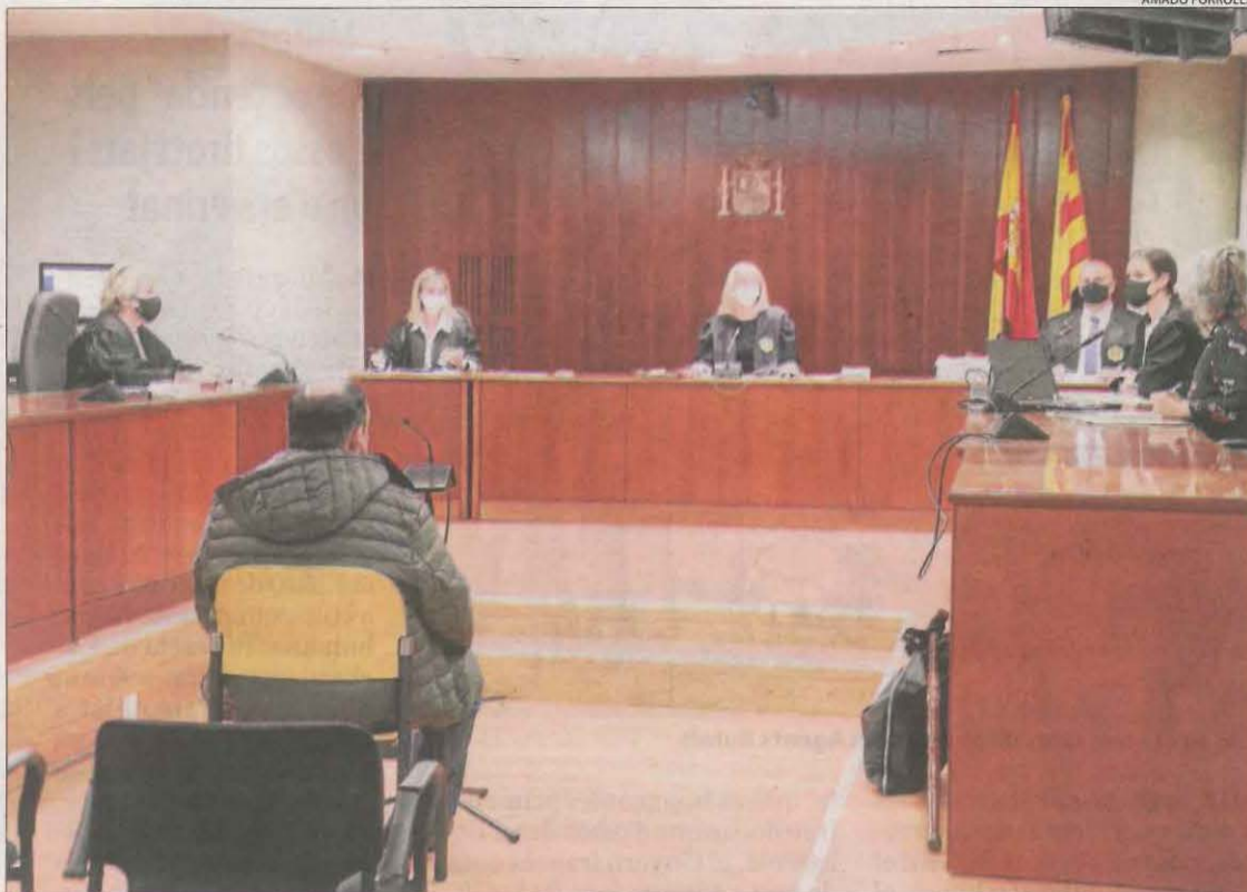
L'acusat, de 68 anys, ahir durant el judici celebrat a l'Audiència de Lleida.

Sobre això, les psicòlogues van declarar que la discapacitat de la víctima és "evident" des del primer moment i que actuava moguda per impulsos. "Si volia alguna cosa, feia el que fos per aconseguir-ho, perquè no és capaç de preveure el risc ni les conseqüències", van assenyalar. Així mateix, van afirmar que era una persona d'especial vulnerabilitat i que l'acusat se'n va aprofitar. També van recordar que, quan van passar els fets,