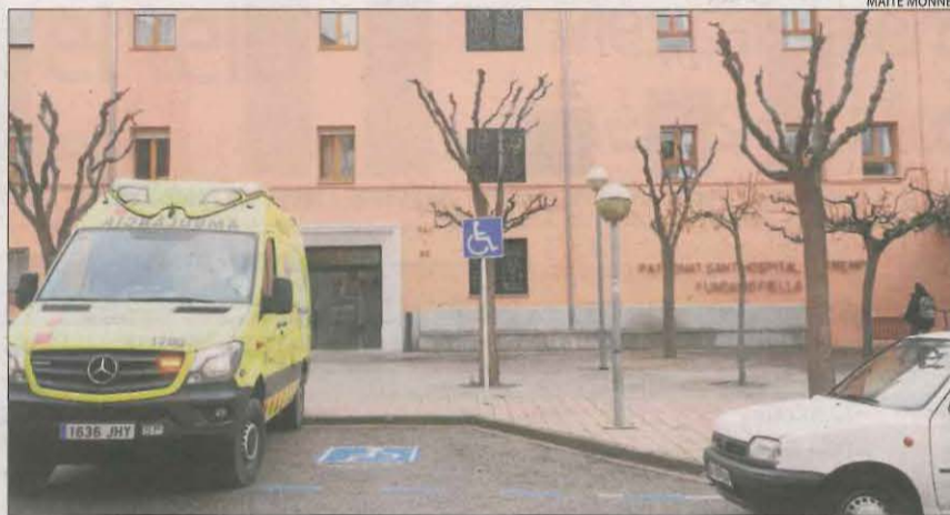
El brot a la residència Fiella de Tremp. Va tenir lloc a finals de l'any passat i es va saldar amb 61 morts. El centre per a la tercera edat està intervingut per la Generalitat mentre la Fiscalia investiga si existeixen responsabilitats penals.