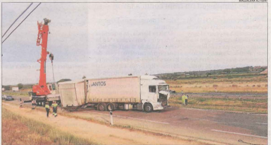
Imatge de la retirada d'un dels tres tràilers implicats en l'accident.

haver ferits. Quatre dotacions dels Bombers, Mossos d'Esquadra i el Sistema d'Emergències Mèdiques van acudir al lloc de l'incident. Tanmateix, els vehicles sinistrats van quedar enmig de la via, fet que va obligar a tallar la carretera i a desviar el trànsit per l'LL-11. Grues de grans dimensions van treballar durant hores en la retirada dels vehicles. En aquest sentit, els treballs es van prolongar fins passades les 21 hores.