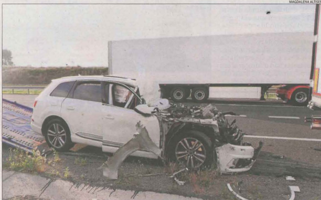
Estat en el qual va quedar el vehicle després de l'accident.

LLEIDA | El conductor d'un vehicle va resultar ferit greu ahir a la tarda a l'encastar-se contra un camió a l'autovia A-2 al seu pas per Lleida i en direcció Barcelona. L'accident es va produir a les 18.27 hores en el quilòmetre 461 a les cues que es formen a causa de les obres de reparació del ferm. Per causes desconegudes i que s'investiguen, un totterreny va xocar per encalç contra un camió. El vehicle va quedar parcialment sota del tràiler. Al lloc de l'accident van acudir tres dotacions dels Bombers de la Generalitat, quatre patrulles dels Mossos d'Esquadra i dos ambulàncies