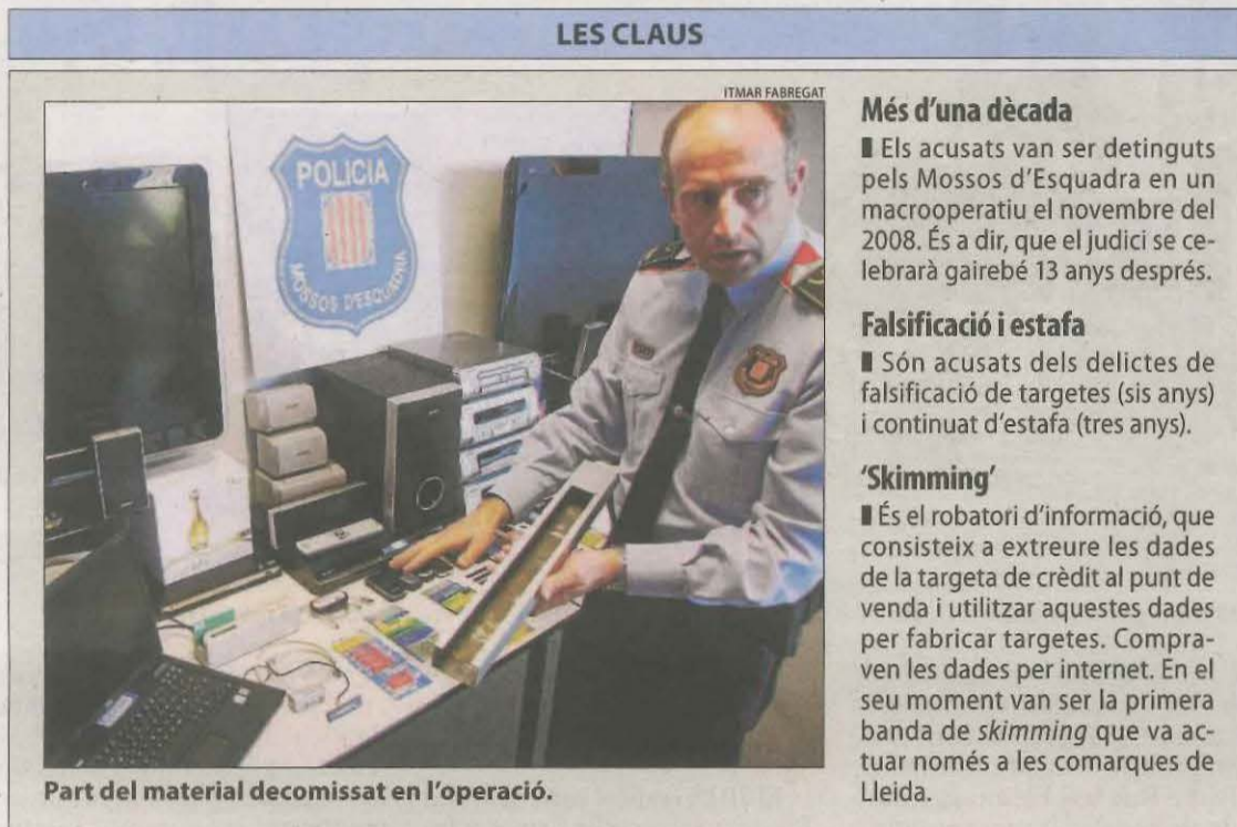
Part del material decomissat en l'operació.

El Ministeri Públic els acusa de "manipular nombroses