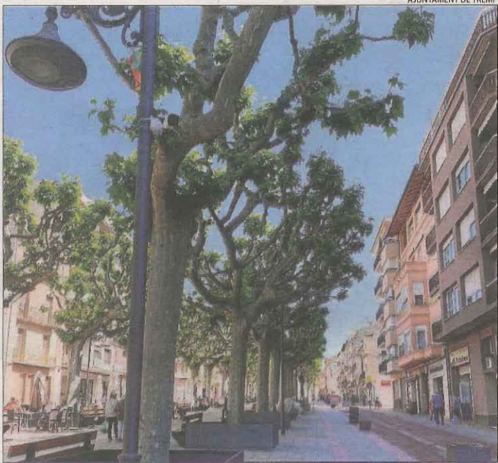
Una de les càmeres instal·lades a la rambla Doctor Pearson.

Aquesta iniciativa s'ha pogut dur a terme gràcies a una ajuda del departament d'Empresa de la Generalitat. No obstant, van apuntar que no