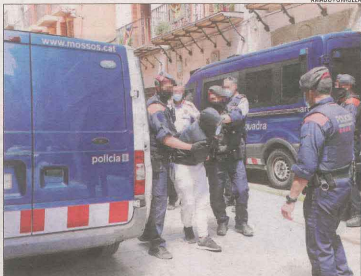
Un dels detinguts, divendres als jutjats de Balaguer.

El jutge va acordar l'ingrés a presó provisional comunicada i sense fiança per a 13 d'ells, mentre que per a uns altres 3 va acordar la posada en llibertat amb mesures cautelars com la retirada del passaport i l'obligació de personar-se de