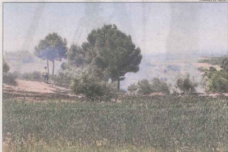
Actuació ahir a la zona de la Pleta, a Arbeca.