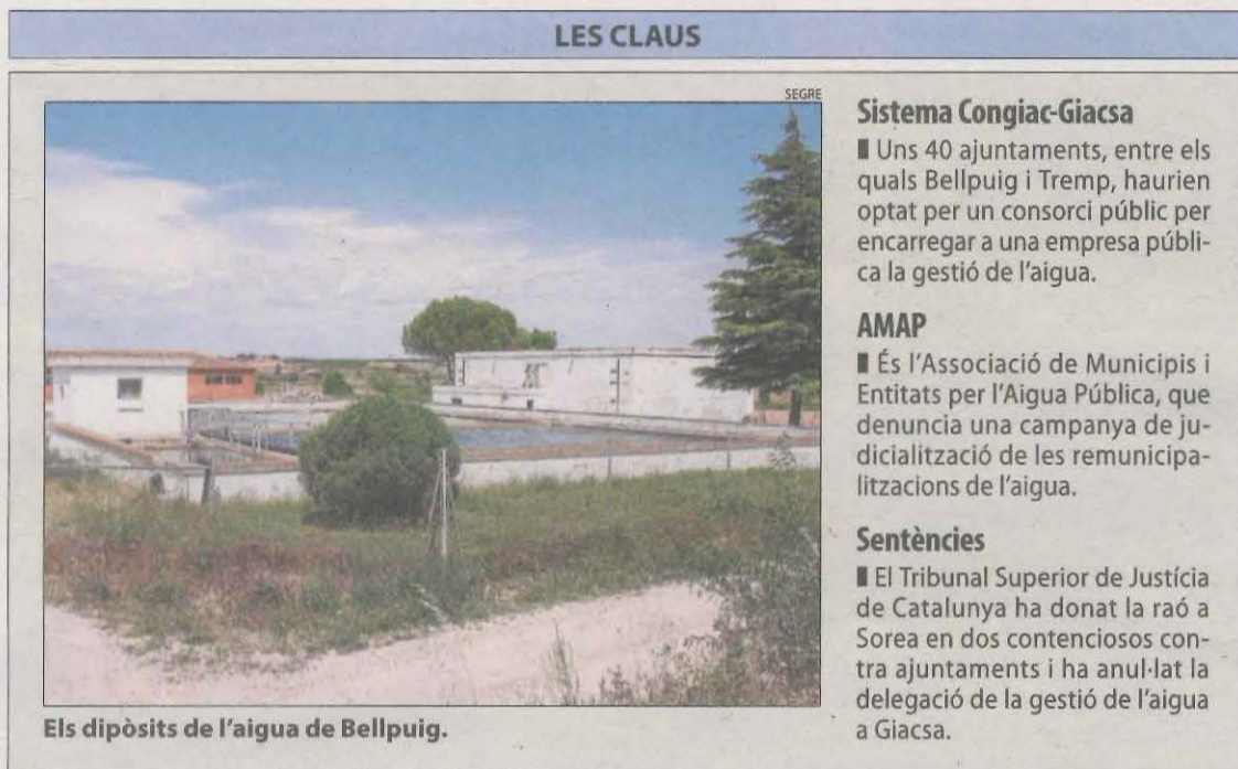
Els dipòsits de l'aigua de Bellpuig.

En el cas de Tremp, el servei d'aigua ja era municipal i l'ajuntament el va delegar al consorci amb intenció de mantenir-lo en mans públiques al considerar-lo un ens propi. En el cas de Bellpuig, el consistori va aprovar el 2017 recuperar