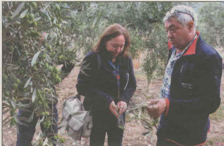
Una tècnica de l'IRTA recollint olives d'una varietat local

Arran de la primera prospecció es va crear una plantació experimental amb les varietats identificades a Salàs de Tremp (Pallars