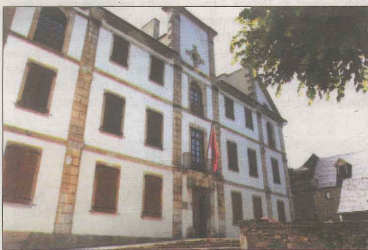
Està construïda amb elements del neoclàssic francès

El cultiu de l'olivera al Pallars Jussà té una llarga tradició, i s'hi conreen extensament varietats autòctones i al·lòctones. Compta amb 733 hectàrees de conreu d'olivera i 652 tones d'oliva, segons les darreres dades oficials (2018). Es tracta d'un sector relativament petit on la majoria de productors són pagesos amb elaboració artesanal i venda directa i l'activitat no és la principal. Un estudi sobre el sector de l'oli al Pallars Jussà elaborat per l'IRTA el 2016 va detectar com a punt fort el creixent interès per les noves plantacions i l'estudi de les varietats.