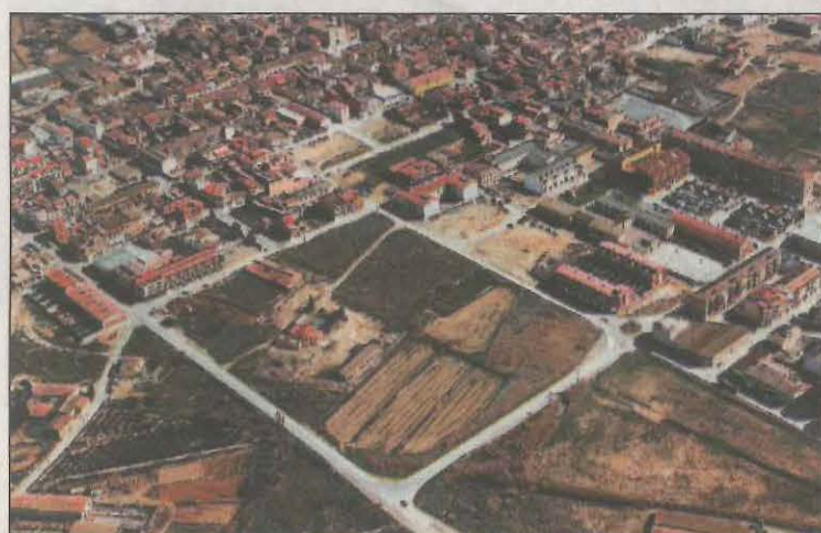
L'àrea prevista per fer el nou barri sostenible

Tècnics de l'ajuntament i col·laboradors han començat a treballar en la creació d'un barri d'aquestes característiques, que sigui respectuós amb el medi ambient i la natura, impulsant els valors de l'ecologia i la utilització de les energies verdes. Un barri capaç de fer compatible una bona qualitat de vida urbana, disminuint el consum de recursos i la producció de residus, mitjançant la participació dels seus propis ciutadans. Aquest espai està situat entre el carrer Binèfar, l'avinguda de Sucs, i el carrer Ventafarines, una nova zona, molt propera al futur gran parc de na-