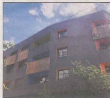
Imatge de l'edifici on s'han detectat ocupacions

El grup municipal de Compromís X La Seu, a l'oposició, va denunciar ahir que en els darrers dies s'han detectat quatre ocupacions en un edifici d'habitatges situat al carrer Sant Joan Baptista de la Salle, al centre de la capital alturgellenca. En aquest sentit, van assegurar que "aquest fet està generant por i un gran neguit", tant als veïns com als comerços de l'entorn. Des de la formació temen que hi hagi un "efecte crida"