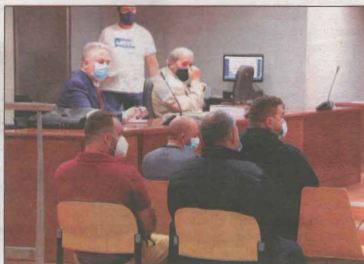
Els quatre acusats, a l'Audiència Provincial de Lleida

Els Bombers van rescatar ahir un home que s'havia llançat al canal de Juneda, prop de l'antiga central elèctrica, perquè el seu gos havia caigut i el volia salvar. Va succeir a les 21.00 hores, va estar agafat en una corda en el primer salt i els efectius el van treure sa i estalvi. A més, l'animal va ser rescatat en perfectes condicions.