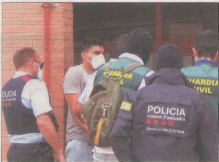
Moment de l'últim registre efectuat a Balaguer

la investigació continua oberta i pot comportar conseqüències penals així com mesures recuperadores respecte al dany causat. El Duc és el rapinyaire més gran d'Europa i actualment es troba protegit per diferents normatives. A més, la seva alimentació principal consisteix en petits rosegadors i conills, sent d'aquesta manera un clar aliat dels pagesos de la zona que pateixen danys d'aquestes espècies.