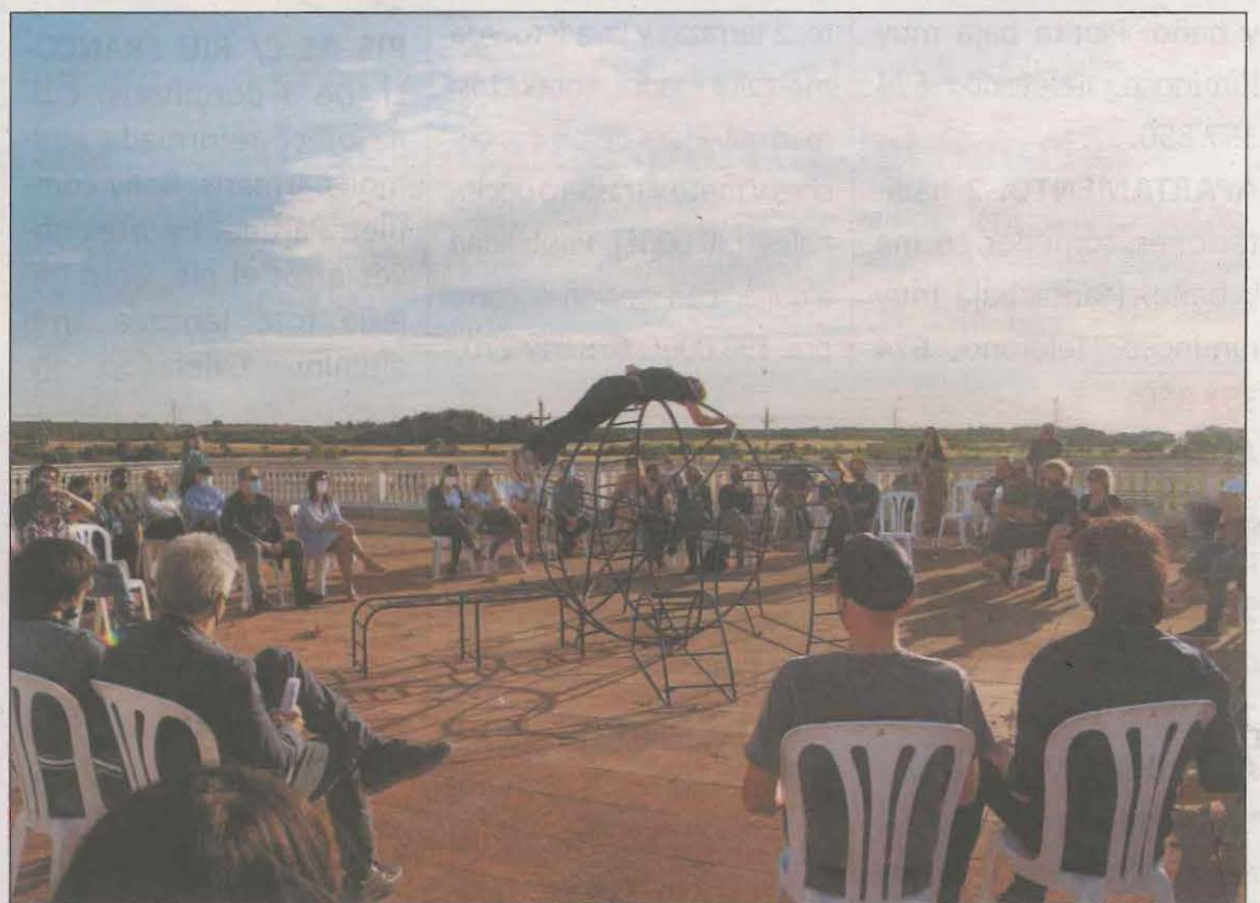
El certamen ha reunit sis artistes en una mateixa exposició, a banda d'altres disciplines

L'Embarrat segueix en la seva línia de mediació que "busca aproximar la creació contemporània al públic". L'alta participació avala l'èxit d'aquesta voluntat, amb un aforament pràcticament complet a totes les activitats. Les visites lliures a l'exposició han estat altament concorregudes i les visites guiades han despertat un interès creixent respecte a les anteriors edicions.