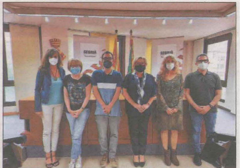
S'han presentat 36 relats curts diferents

Totes dues obres s'han endut com a premi una dotació econòmica, que en el cas de la guanyadora ha estat de 650 euros, mentre que l'accèsit li ha correspost un guardó de 250 euros.