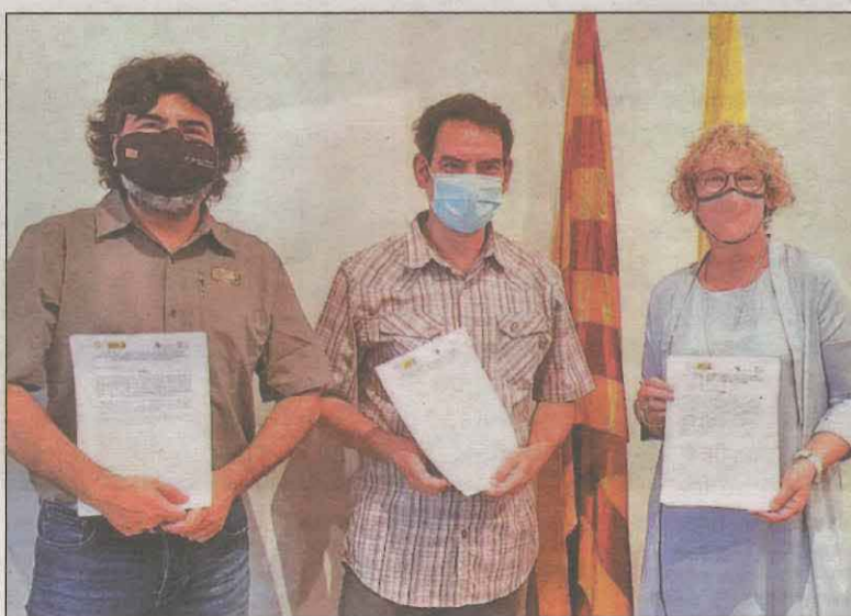
Moment de la signatura del conveni de col·laboració

en la conservació, protecció i foment del coneixement del patrimoni subterrani, que encara roman força desconegut. Per aquest motiu i reforçant el treball en xarxa en què es basen els Geoparc mundials de la UNESCO, es pretén cooperar per millorar la gestió del territori i treballar directament en aquest patrimoni subterrani en termes de conservació.