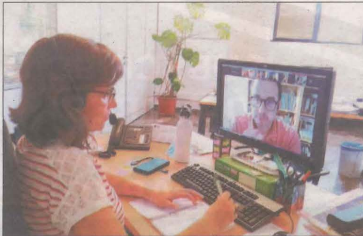
Són cinc sessions que es fan telemàticament

Entre els participants hi ha guies de natura, guies culturals, empreses d'activitats turístiques, agències de viatge, allotjaments i també personal d'equipaments culturals i d'informació turística. Va ser el propi sector qui va ajudar a definir els continguts de la formació a través d'un qüestionari previ. Les cinc sessions ajudaran a dissenyar missatges