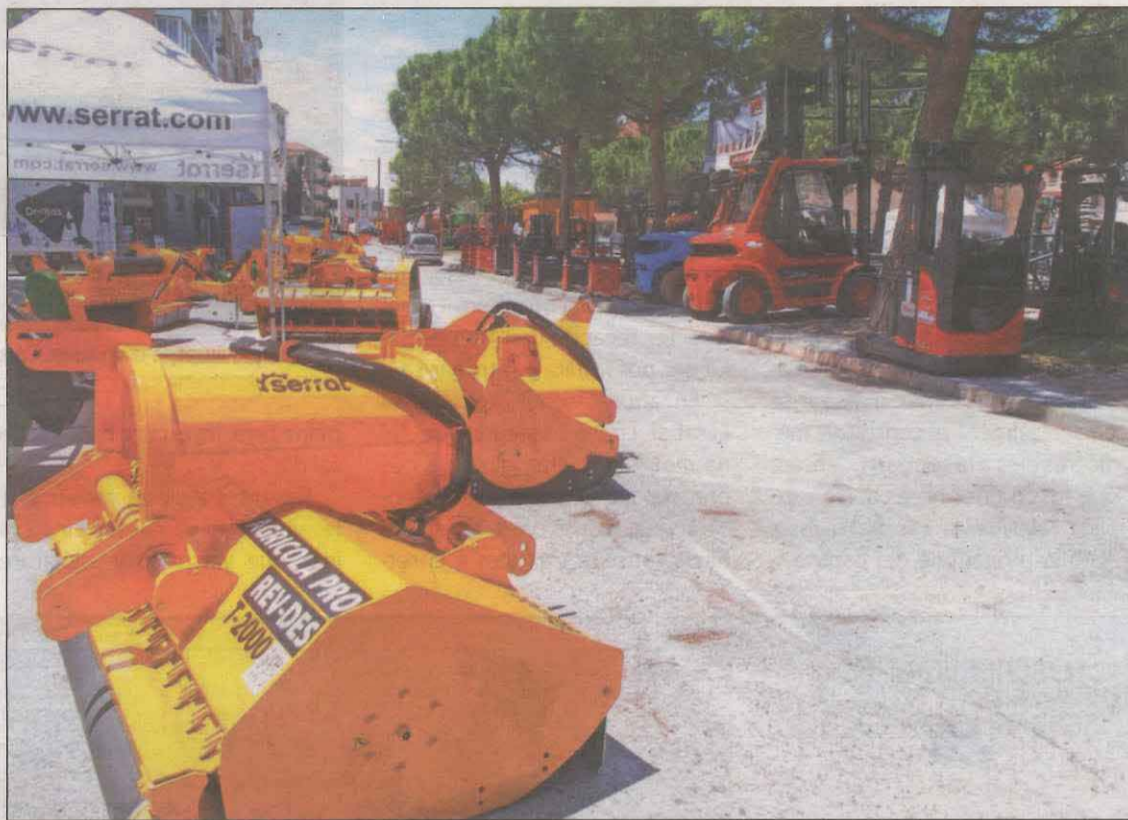
Imatge del muntatge del certamen que s'estava fent ahir al matí

Avui tindrà lloc també la Inauguració Oficial de la 148 Fira de Sant Josep i del 40è Saló de l'Automòbil, acte que presidirà el conseller d'Empresa i Treball, Roger Torrent. El programa inclou l'arribada, a les 11.00 hores, i par-