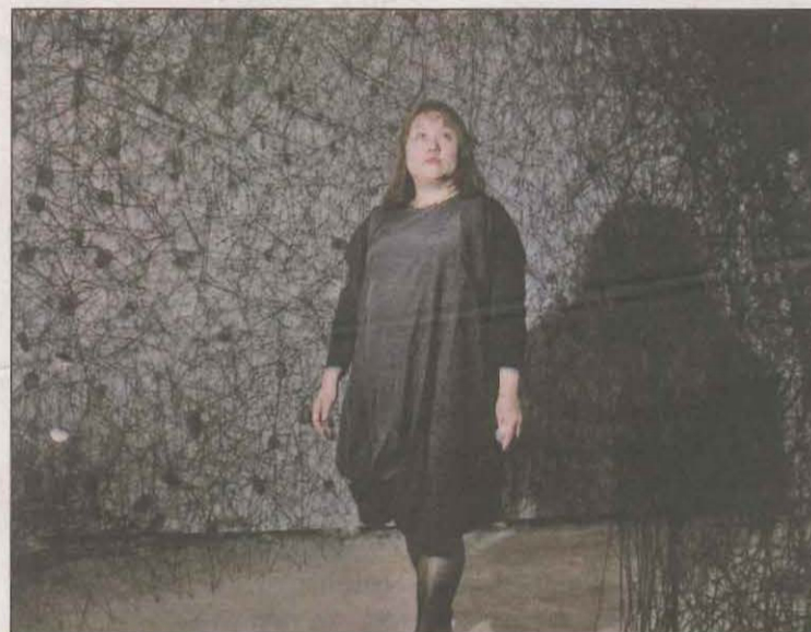
La instal·lació es troba a l'edifici de minerologia de Sorigué

El projecte PLANTA de la Fundació Sorigué ha presentat aquest dijous la primera instal·lació permanent a l'estat espanyol de la prestigiosa artista Chiharu Shiota. Es tracta de l'obra 'In the beginning was...' que ha estat creada específicament per a PLANTA i s'inspira en el so de les pedres caient a les muntanyes de grava. Per això, l'artista ha utilitzat per primera vegada la pedra com a element fonamental de la seva obra. Shiota ha explicat que per ella la pedra és "l'origen de tot" i que entén que els cordills que les uneixen en aquesta obra són les "connexions" que hi poden haver entre uns i altres. PLANTA té previst tornar a obrir al públic l'exposició d'obres a partir del pròxim 12 de juny.