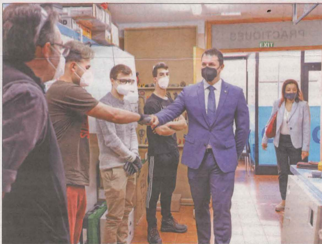
Moment de la visita del ministre de Presidència, Economia i Empresa d'Andorra als estudiants

El ministre de Presidència, Economia i Empresa d'Andorra, Jordi Gallardo, va visitar ahir el curs d'ajudant d'electricista que s'organitza des del Servei d'Ocupació i en el qual participen una quinzena de persones. Es tracta d'una formació gratuïta adreçada a persones inscrites a aquest servei i que té la voluntat de formar-los i reorientar-los cap al sector de l'electricitat. Donat que el sector elèctric està actualment en recerca de treballadors, la formació va orientada a aquells que no tenen experiència prèvia en aquesta feina però que volen dedicar-s'hi.