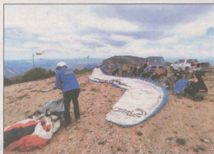
Els van explicar les claus del vol en parapent

com la festa del foc i la música de les terres de Ponent. L'any passat la Paeria i les entitats van decidir suspendre-la a causa de la pandèmia, tot i que també es va posar sobre la taula el format que s'impulsarà aquest any, amb espectacles en un únic espai.