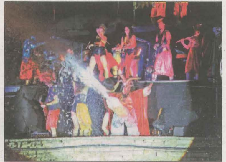
Els espectacles es representaran en un únic lloc

La proposta que s'ha decidit preveu activitats festives, espectacles i concerts, el divendres 27, dissabte 28 i diumenge 29 d'agost, a la plaça de Cal Racó, amb aforament limitat i reserva prèvia. La programació ha estat consensuada amb les entitats i es