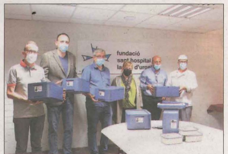
Serviran per dur menjar a la gent gran

núvols ha dut a terme una explicació, que va servir perquè els assistents coneguessin el vol en parapent i les claus per practicar aquest esport d'aventura.