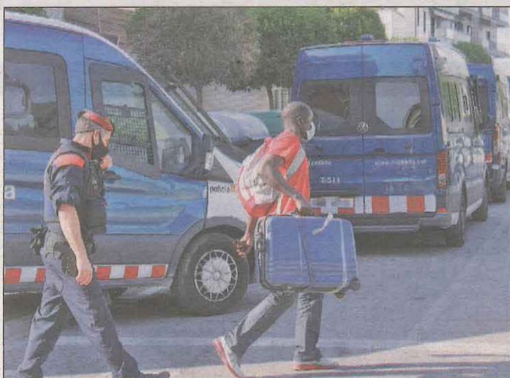
Un agente junto a uno de los desalojados

Los Mossos d'Esquadra desalojaron ayer tres de los pisos okupas del barrio de la Bordeta. En total, cuatro adultos y un menor fueron expulsados de las casas sin causar ningún incidente. La PAH no se personó en el momento del desalojo que se ejecutó por orden judicial. LOCAL | PÁG.13