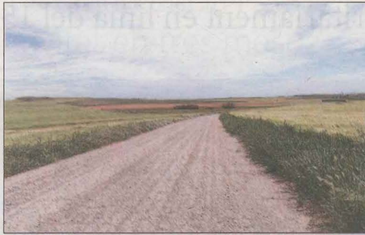
Imatge d'un dels camins que s'ha millorat

El Departament d'Acció Climàtica, Alimentació i Agenda Rural ha acabat recentment les obres derivades de la concentració parcel·lària del regadiu de l'Alguerri-Balaguer, a Balaguer. Els treballs van començar l'any 2011 i, per motius pressupostaris, s'han anat executant en diferents fases tenint en compte les prioritats manifestades pel territori així com el desenvolupament de les obres en part de la zona concentrada. La concentració parcel·lària suma 2.300 hectàrees, corresponents a 273 propietaris. La darrera fase de les obres, que va començar el març del 2020, ha estat executada per Romero Polo, SAU, i ha suposat una inversió de gairebé 1,8 milions d'euros.