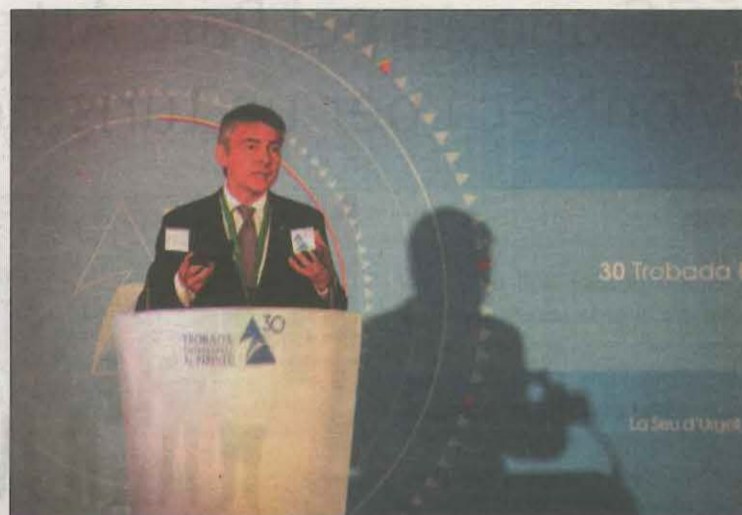
Imatge d'arxiu del president de la Trobada Empresarial