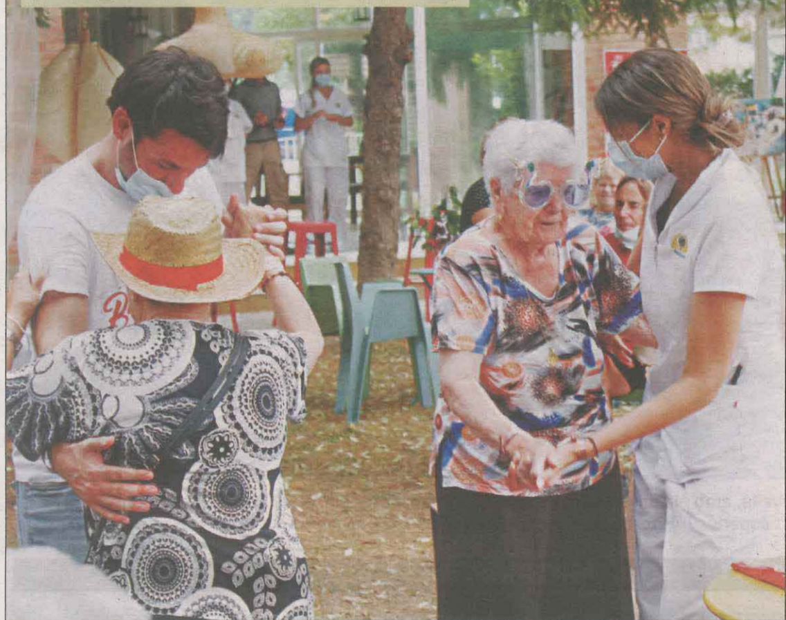
Una marca de vermut pone música al Centre Geriàtric Lleida