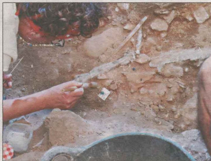
Los restos afloran en el yacimiento de la Cova Gran