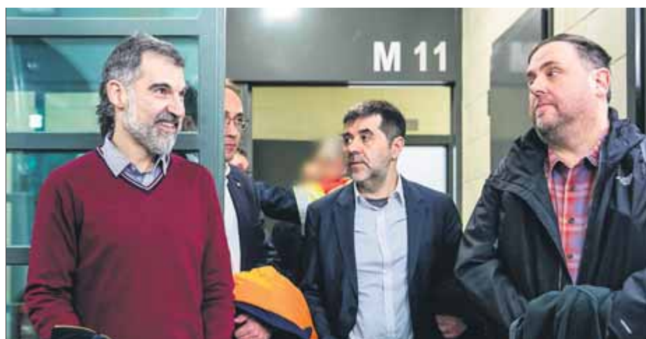
Cuixart, Rull, Sánchez i Junqueras, al penal de Lledoners, el febrer del 2019

Els magistrats converteixen el seu escrit en un acurat manual del dret de manifestació, segons la jurisprudència del TEDH, que avala protestes contra l’administració sempre que no hi hagi violència greu. En el cas dels Jordis, exposen que cal tenir en compte que són líders so-