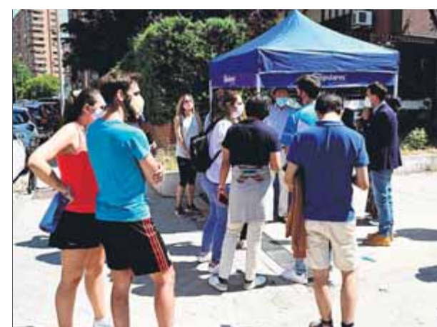
Madrilenyos fent cua per firmar contra els indults als presos en la taula del PP al districte de Chamartín

la llei catalana de protecció del litoral. L’executiu d’ERC i Junts defensa els articles que atorguen als municipis competències per organitzar activitats esportives o culturals a les platges, una potestat que l’Estat es vol reservar en nom del seu exclusiu domini públic marítim i terrestre. ■