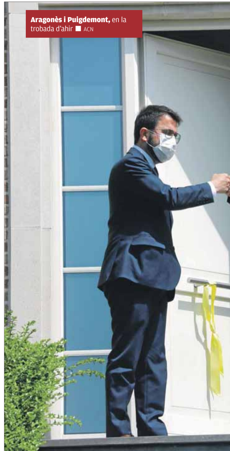
Aragonès i Puigdemont, en la trobada d'ahir

De cara a enfortir una línia política coordinada en tots els fronts, Puigdemont ha citat a Waterloo demà els set consellers del seu partit que formen part del govern de Pere Aragonès. Es trobarà, doncs, amb el vicepresident, Jordi Puigneró, i els consellers amb la intenció de coordinar polítiques, proposar estratègies a seguir i marcar quines qüestions haurien de ser prioritàries en els diferents àmbits que gestiona JxCat dins del Consell Executiu. ■