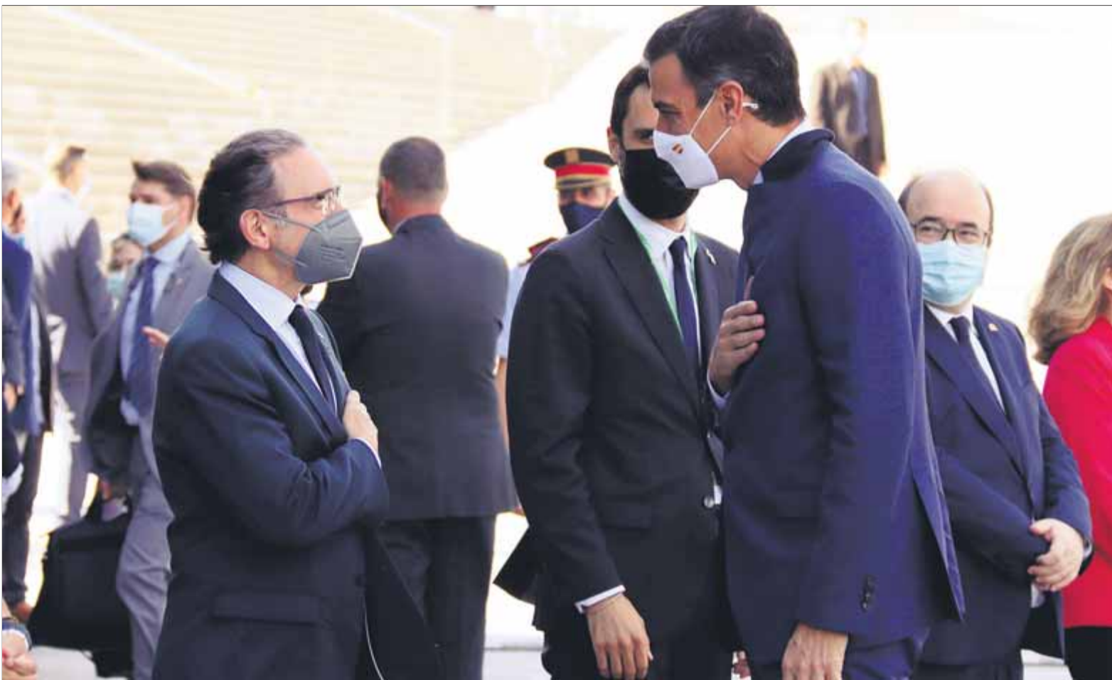
Salutació del president Pedro Sánchez i el conseller d'Economia, Jaume Giró, a l'arribada al Cercle d'Economia