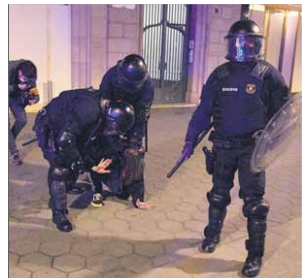
Actuació dels Mossos durant una mobilització, al febrer, a Barcelona, per la llibertat del raper Pablo Hasél

■ Entren a registre una resolució per crear-la, tal com ja s'havia aprovat ■ Segurament vagi a l'últim ple del juliol