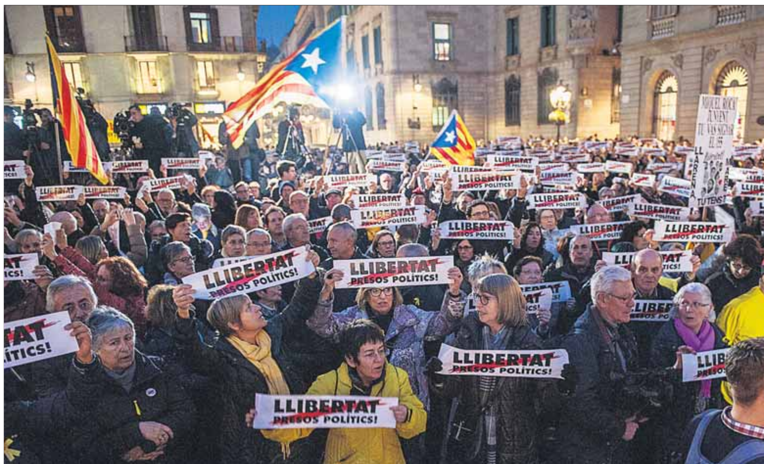
Una concentració per reclamar l'alliberament dels presos polítics, celebrada a la plaça Sant Jaume de Barcelona