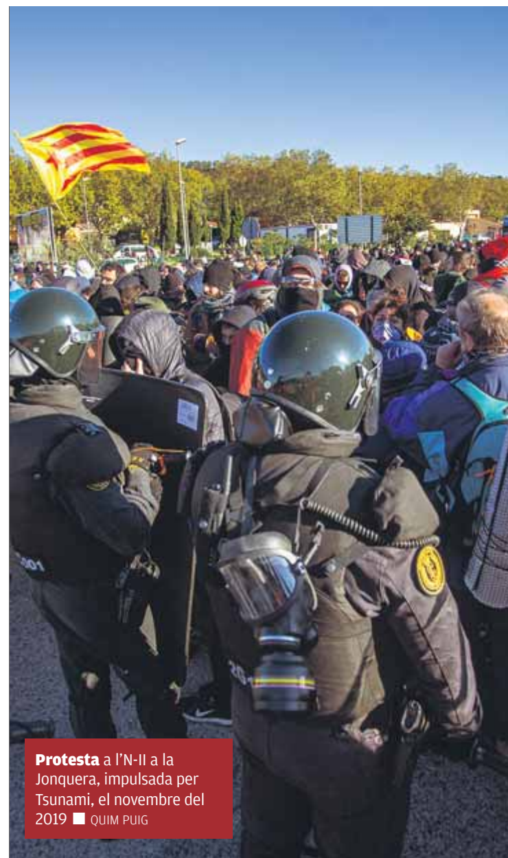
Protesta a l'N-II a la Jonquera, impulsada per Tsunami, el novembre del 2019

■ Precisament, el cap de l'oficina de l'expresident Puigdemont, l'historiador Josep Lluís Alay, té diverses investigacions penals