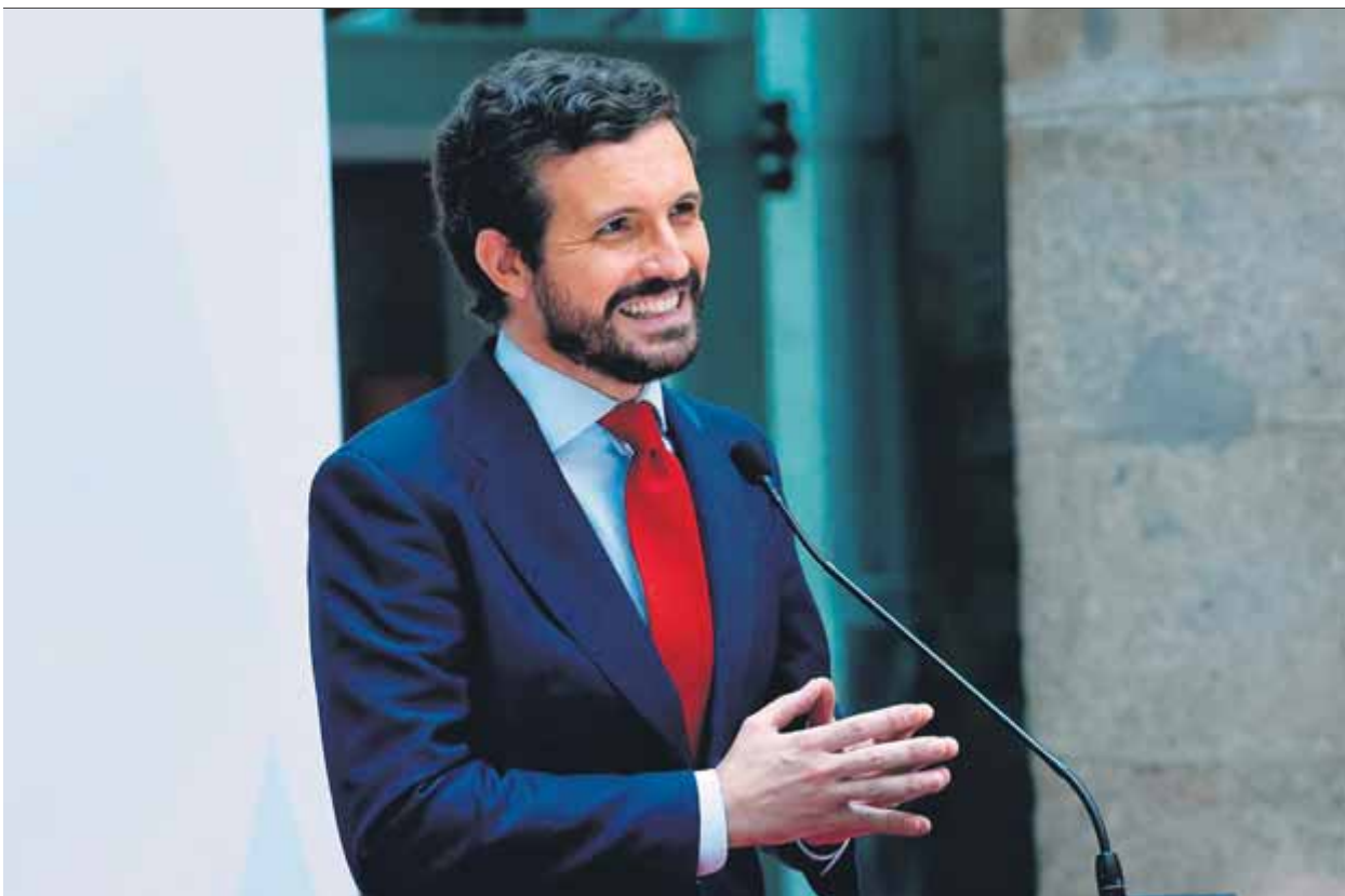
El líder del Partido Popular fa uns dies en un acte a Madrid