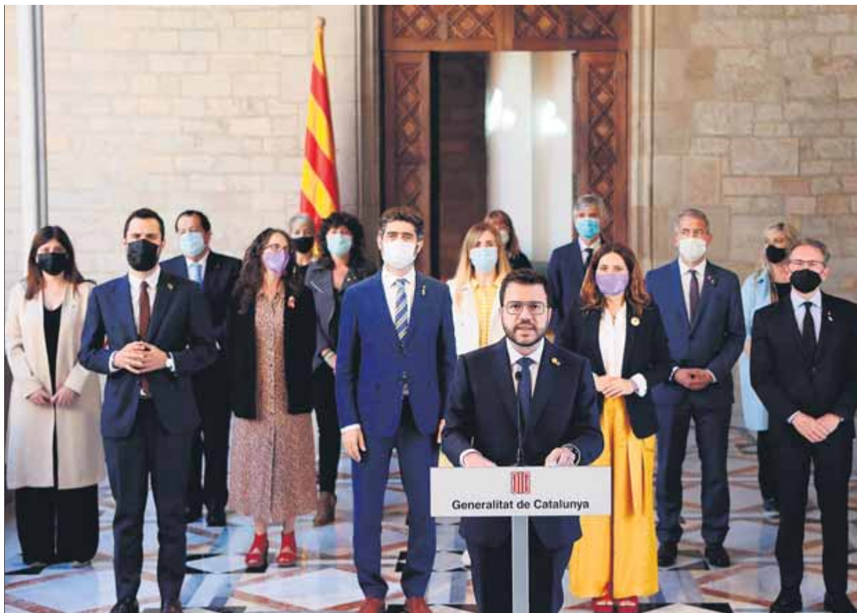
El govern va comparèixer ahir en ple per pronunciar-se sobre els indults i el demolidor informe del Consell d'Europa

Per Aragonès, els indults decretats ahir són "un reconeixement que les condemnes van ser injustes", per la qual cosa els