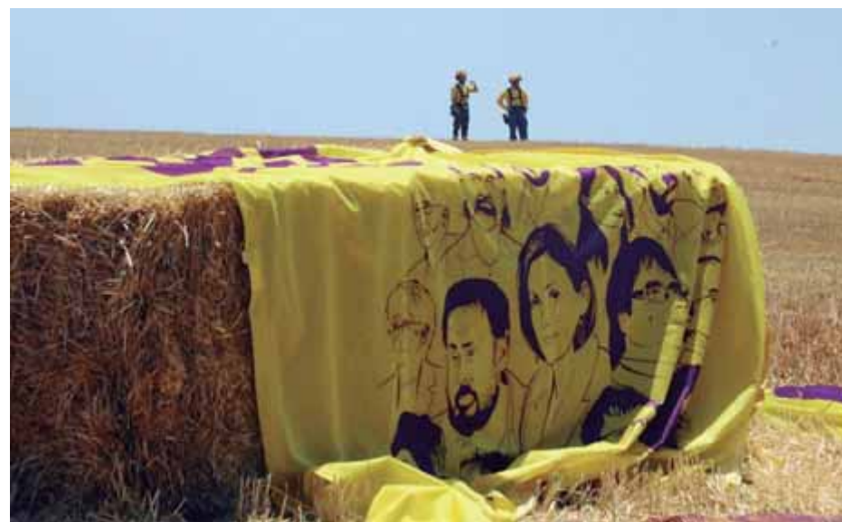
L'esplanada de Lledoners, que veurà avui sortir els presos homes ■

■ El Suprem no els demora per no exposar-se a la retenció il·legal ■ Aragonès els esperarà a la porta de Lledoners