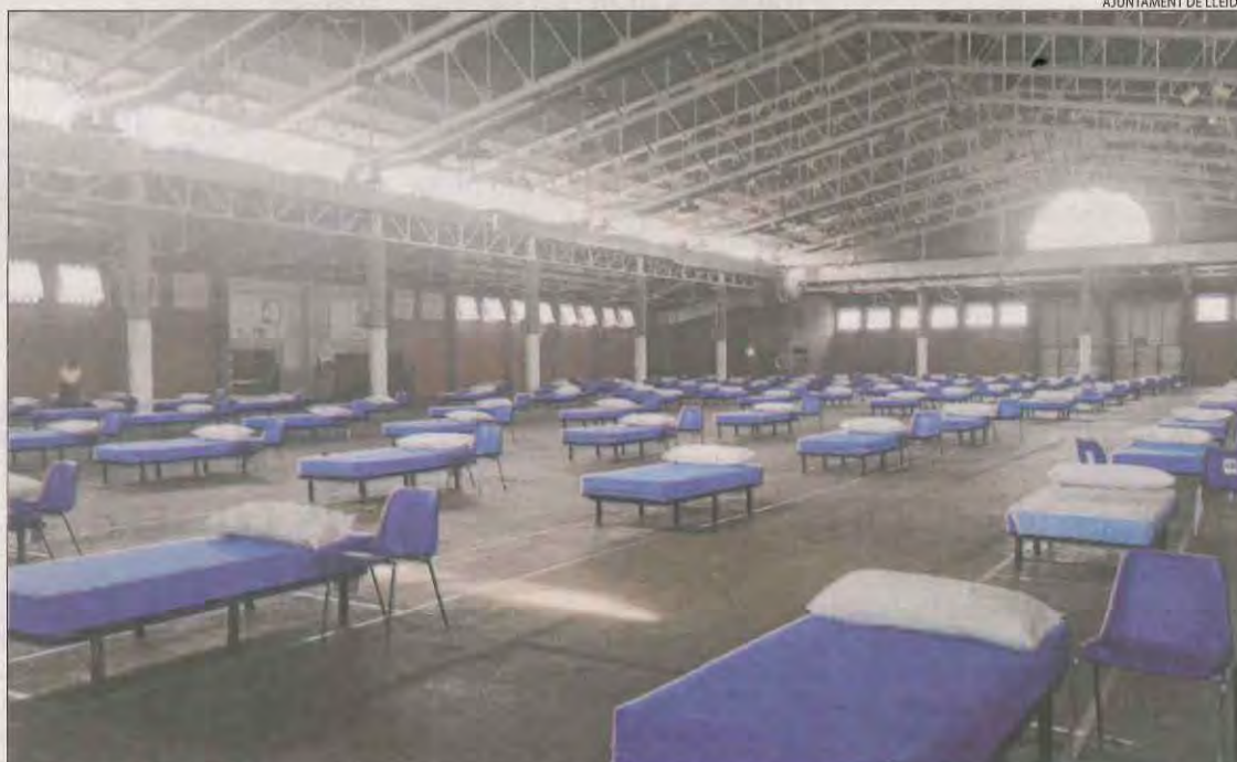
El pavelló 3 de la Fira, ahir al matí amb els 122 llits ja instal·lats.

El consistori ja va adaptar l'estiu passat com a allotjament un pavelló de la Fira, amb