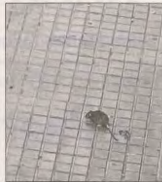
Una rata a Bisbe Ruano.