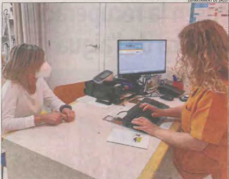
Una infermera prescriu una recepta a Oliana.

LLEIDA | El personal d'infermeria de Lleida ja ha prescrit més de quatre-centes receptes. Des del mes de gener passat, una trentena de professionals de les comarques del pla han emès 445 prescripcions, segons s'extreu de les dades del departament de Salut, que va anunciar que també pot fer-ho ja part d'aquest personal a la regió sanitària del Pirineu. Fins al mes de maig, infermeres i infermers han emès receptes en centres de comarques com el Segrià i la Noguera. Salut va puntualitzar que hi pot haver altres professionals acreditats que encara no hagin fet cap prescripció. Pel que fa al Pirineu, s'han incorporat a aques-