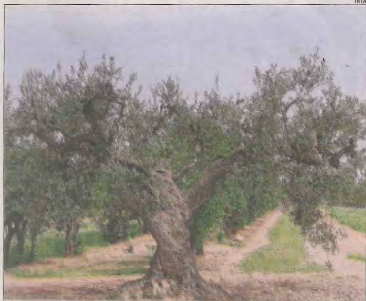
L'IRTA gestiona el reservori de material genètic d'oliveres.

MADRID | L'estalvi que les llars espanyoles tenen al banc en forma de dipòsits va créixer una mica més d'un 6 per cent a l'abril en comparació interanual i va batre un nou rècord històric, a l'assolir els 925.600 milions d'euros. L'esmentat període va estar marcat per les successives onades de la pandèmia, en especial per la frenada econòmica ocasionada pel confinament, que va durar fins al juny i podria haver animat les famílies a optar per la prudència per afrontar el futur.