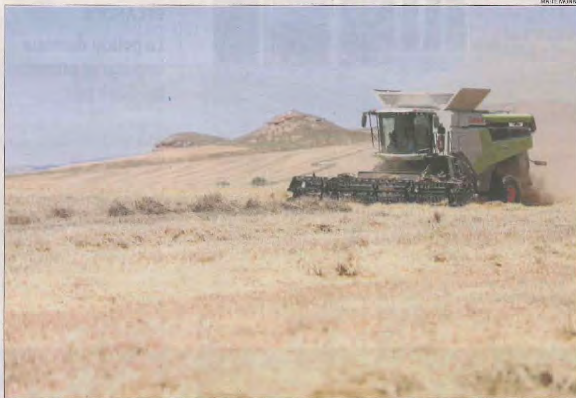
Una recol·lectora treballant a ple rendiment dissabte.

Unió de Pagesos considera que la "falta d'aigua més regular" durant la campanya dels cereals d'hivern explica la reducció de collita. També atribueix les baixes expectatives a la presència creixent de fauna