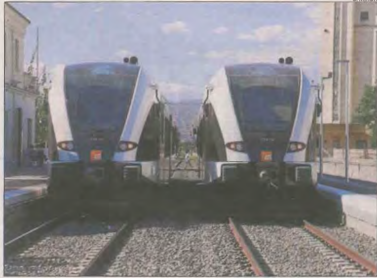
Els dos combois que operen actualment en la línia de la Pobla.

Quan FGC va rellevar Renfe com a operadora a la línia de la Pobla, fa gairebé cinc anys, va estrenar dos trens fabricats a Suïssa. Des d'aleshores, revisions, operacions de manteniment i avaries han obligat a suspendre trajectes, especialment entre Balaguer i la Pobla, i a transportar els passatgers en autocars.