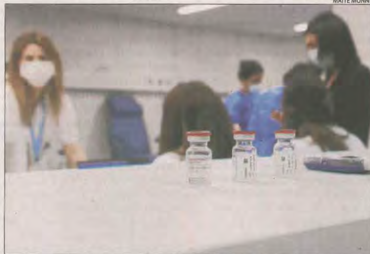
Vials de Moderna que s'administren a l'Arnau de Vilanova.

Les regions sanitàries de Lleida i de l'Alt Pirineu i Aran han rebut aquesta setmana una xifra rècord de vacunes contra la Covid, amb 31.900, gràcies a la gran remesa de Pfizer. Així, d'aquesta farmacèutica hi ha