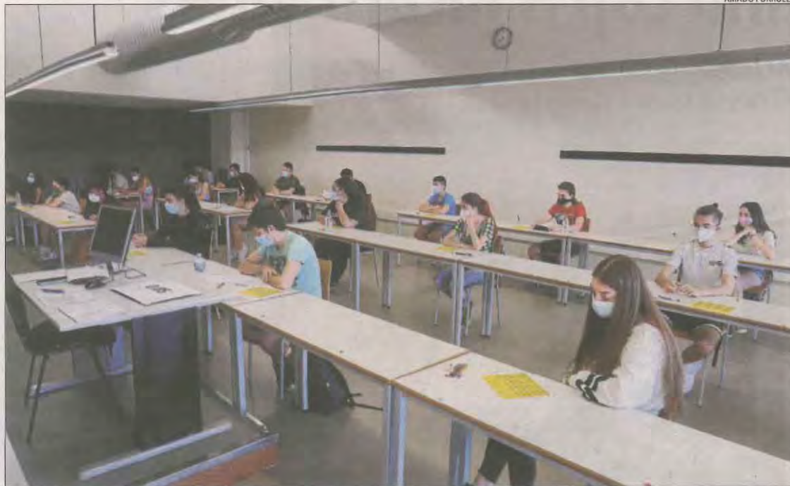
Alumnes a la selectivitat de l'any passat.

En l'edició anterior, la selectivitat es va celebrar quan el Segrià i sis poblacions més del Baix Segre estaven confinades a causa de l'elevat nombre de contagis de Covid-19, per la