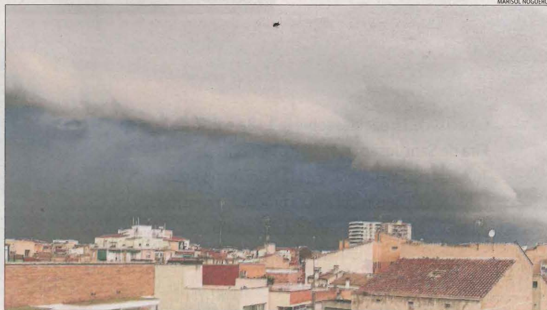
Els núvols que ahir a la tarda presagiaven l'arribada de la tempesta a Lleida.

dellas. L'incident es va produir al voltant de dos quarts de cinc de la tarda i fins al lloc es van traslladar diverses patrulles de la Guàrdia Urbana que van acordonar la zona. També hi va haver serveis per branques caigudes a la plaça de l'Exèrcit i el