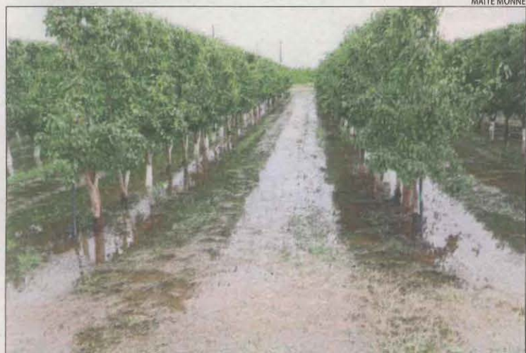
Una finca agrícola de Lleida negada ahir per l'aigua.