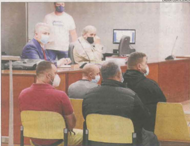
Els acusats durant la vista de conformitat celebrada ahir.

Els fets es remunten a fa 13 anys, el 2008, quan van ser detingudes cinc persones acusades de clonar targetes i fer compres amb en establiments de Fraga, Mollerussa, Tàrraga, Cervera, Tremp , Lleida i les Borges Blanques. En el seu escrit d'acusació, la Fiscalia va assenyalar que els investigats van fer compres o ho van intentar en més d'una vintena de joieries, botigues d'electrodomèstics i tecnologia, entre altres comerços, el valor de les quals ascendeix a uns 45.000 euros, encara que només van poder fer compres per valor de 15.000 euros. En el judici d'ahir van ser condemnats quatre dels cinc detinguts, atès que un d'ells es troba en