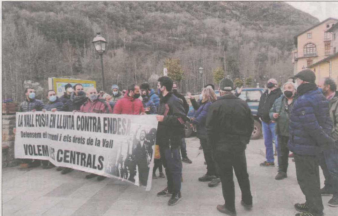
Protesta el març passat a la Vall Fosca contra els talls de llum i l'acord amb Endesa.

Tant ell com la resta en aquesta situació van rebutjar l'acord al qual l'ajuntament de la Torre de Capdella i la companyia elèctrica van arribar al març per pagar de forma fraccionada les factures que l'empresa reclama als veïns i el consistori des del 2015. La corporació municipal es va avenir a firmar aquest acord en un moment en què la companyia havia iniciat talls de