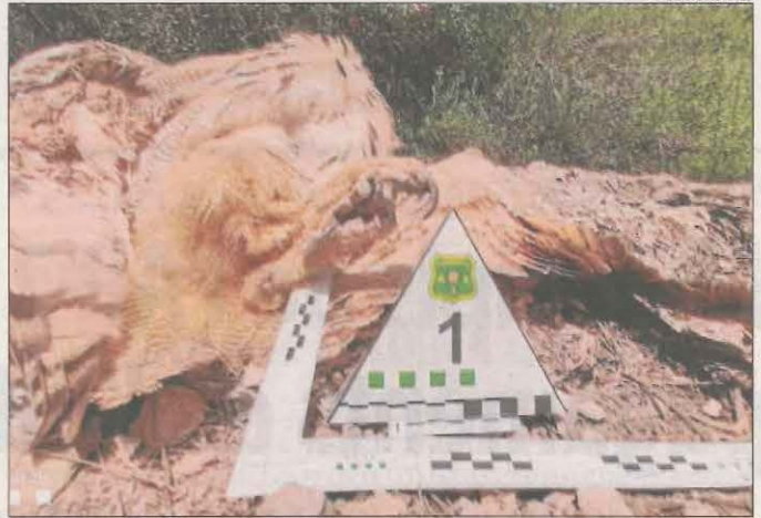
Imatge de l'exemplar de mussol reial abatut a Verdú.