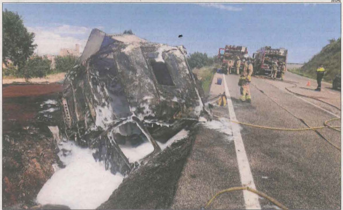
El camió calcinat després de bolcar al quilòmetre 62 de la carretera C-14 al terme de Ciutadilla.

EFFECTES DE LA PANDÈMIA El final de les restriccions de mobilitat ha augmentat el nombre d'accidents a les carreteres