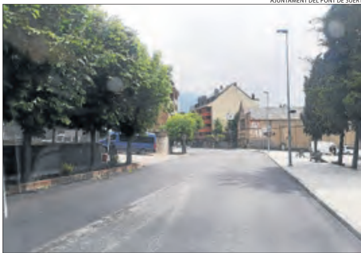
Un dels trams de la travessia de l'N-230 al Pont de Suert.