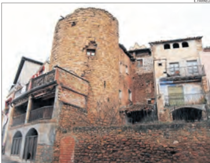
Un dels habitatges del centre de Talarn.

Per al primer edil, aquesta línia d'ajuts permet a les famílies "arreglar" les cases i possibiliten frenar la despoblació dels pobles petits. L'import màxim per beneficiari per a la rehabilitació de façanes arriba als 1.500 euros, i als 3.000 en el cas de les teulades. El consell d'alcaldes del Pallars Jussà va aprovar l'any 2020 una moció per demanar ajuts a la Generalitat i fer una diagnosi de l'estat actual dels pobles, com