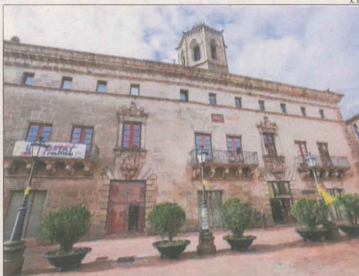
La façana de la Paeria de Cervera.

Aquesta nova aliança configura un govern tripartit amb les tres formacions independentistes al consistori. A l'oposició queden els dos regidors del PSC, que van formar part del govern de la Paeria amb