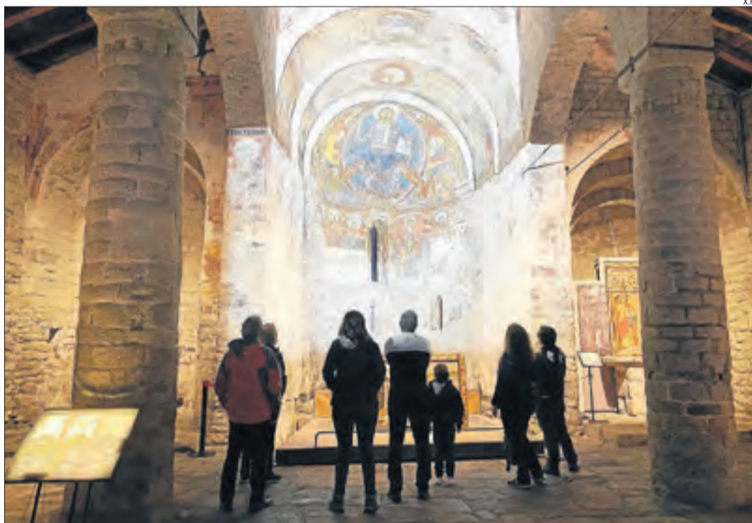
Turistes divendres a l'església de Sant Climent de Taüll, un dels principals atractius de Lleida.

El Pirineu va rebre el juliol i l'agost de l'any passat 220.167 turistes, un 9,5 per cent més que el 2019. Tanmateix, en el conjunt de la demarcació els visitants van caure un 21% en el mateix període, una cosa que es va deure principalment al confinament que es va imposar al Segrià durant el mes de juliol a causa d'un rebrot del coronavirus.