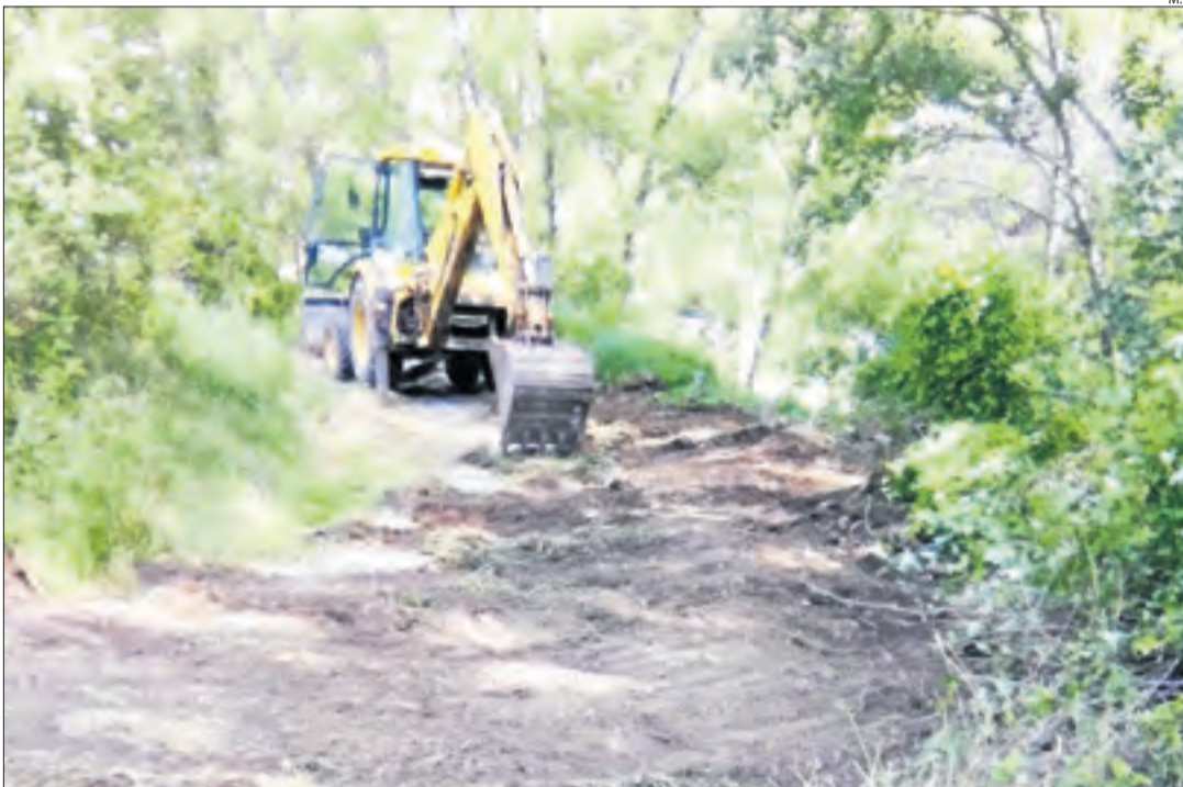
Les obres per fer transitable el camí que baixa a la zona de desembarcament de la Pobla de Segur.