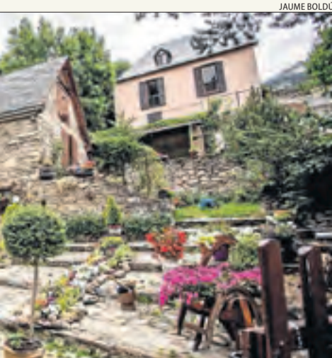
Bagergue, un dels pobles més bonics d'Espanya.

Així mateix, Lleida compta des de l'abril del 2018 amb un reconeixement geològic de primer ordre. Es tracta del Geoparc Orígens, que engloba dinou municipis del Jussà, Sobirà, Noguera i Alt Urgell i sumen uns 2.000 quilòmetres quadrats de superfície.