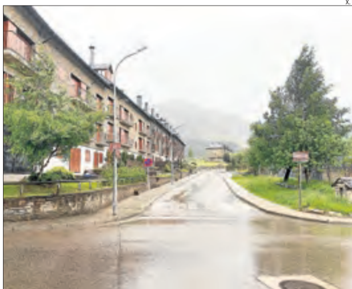
Les pastures són a prop de la urbanització del Pla de l'Ermita.

L'acord entre els administradors concursals i Actius de Muntanya, empresa en mans de FGC que explota Boí Taüll, va resoldre una disputa sobre telecadires, canons de neu i altres instal·lacions de Boí Taüll que anaven a subhastar-se set anys després que la Generali-