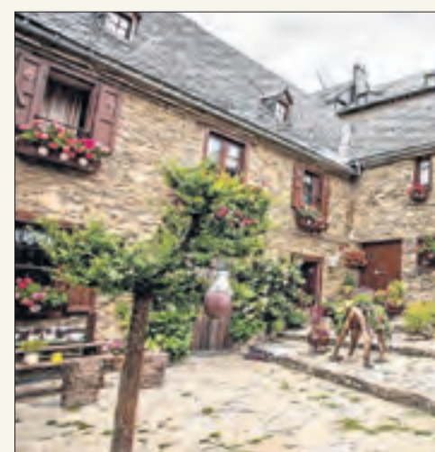
Imatge de Bagargue, un dels pobles més bonics de la demarcació.

■ El congost de Mont-rebei està tancat als excursionistes des del mes de novembre passat arran de l'últim desprendiment registrat i està pendent de les obres que s'han de portar a terme per poder reobrir el pas als visitants. No obstant, el congost es pot recórrer navegant, encara que quan comencin els treballs s'hi prohibirà el pas d'embarcacions els dies feiners. Per això, el congost afronta el seu estiu més incert.