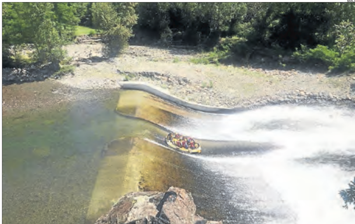
Barques de ràfting solcant ahir les aigües del riu Noguera Pallaresa.

en el medi natural. En aquest últim cas, 205 empreses ofereixen aquest any activitats d'aventura, la gran majoria de les quals al Pirineu. Aquestes ofereixen des de baixades de ràfting per la Noguera Pallaresa, un dels millors rius d'Europa per a la pràctica d'aquest esport, fins a parapent i ala delta. Aquest any, el sector dels esports d'aventura espera superar els 550.000 serveis contractats (vegeu SEGRE de dijous).