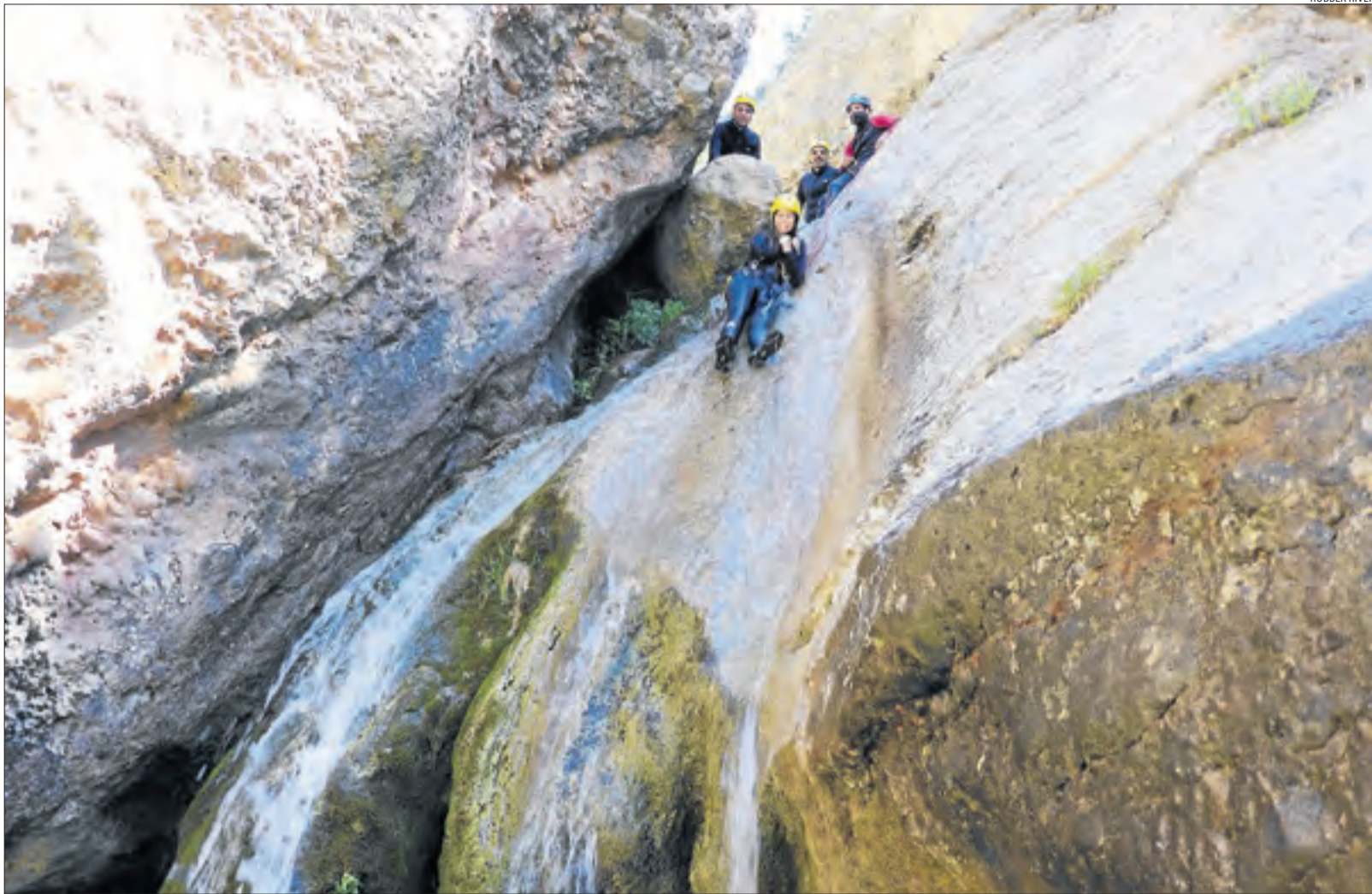
Imatge d'una activitat de barranquisme al Pallars Sobirà.