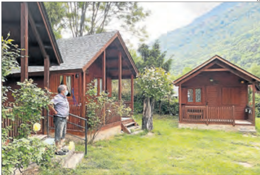
Els bungalows del càmping Espalías de Bossòst, que té un bon volum de reserves a l'agost.