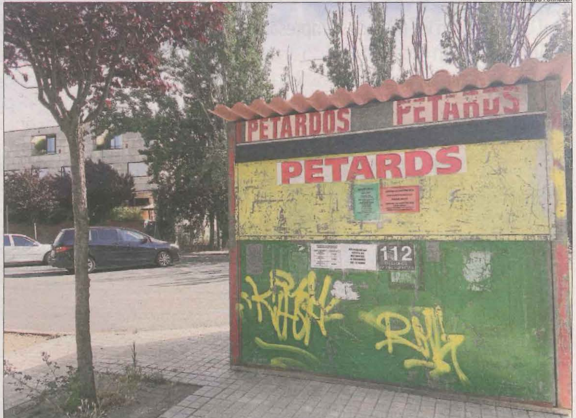
Una de les tretze casetes temporals de petards que ja estan instal·lades a Lleida ciutat.

A més de mantenir la distància de seguretat, utilitzar mascareta i gel hidroalcohòlic, l'ajuntament va fer una crida perquè els veïns no compartixin aliments ni coberts durant el sopar.