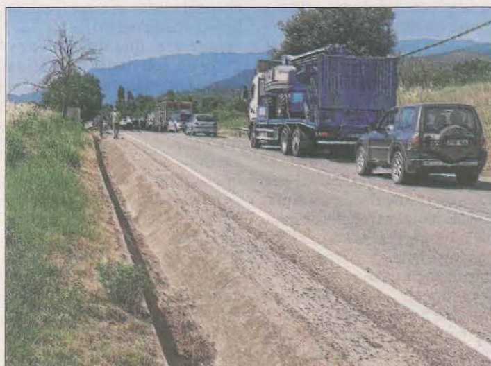
L'accident, al fons, va obligar a tallar la carretera dos hores.