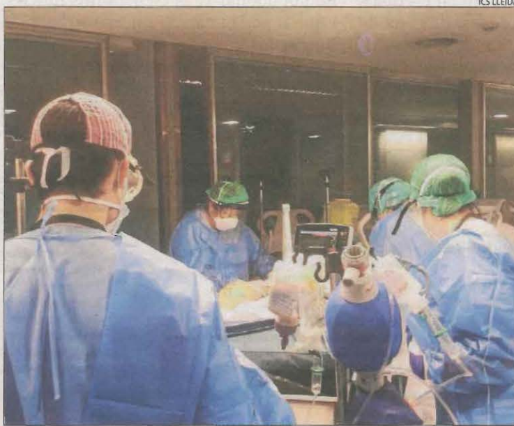
Imatge d'arxiu de l'UCI de l'Arnau amb malalts de Covid.

D'altra banda, la Federació d'Hostaleria de Lleida va afirmar que després d'un any i quatre mesos de pandèmia, una quarta part dels negocis -bars, restaurants i hotels petits- han tancat o han hagut de canviar de titular per les pèrdues.