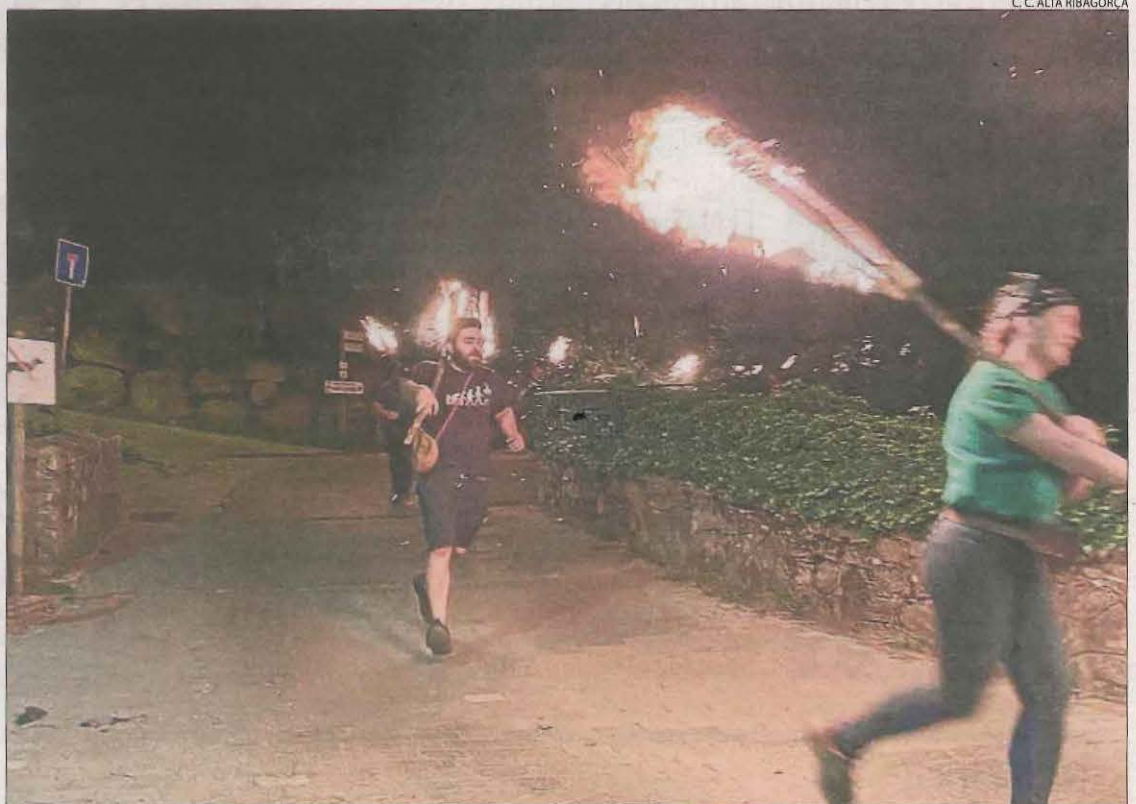
Els veïns de Durro van descendir la muntanya des de Sant Quirc després d'encendre el faro.