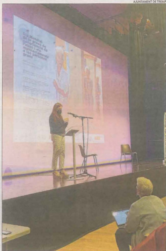
AJUNTAMENT DE TREMP