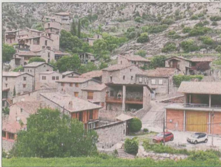
Vista del poble de Cabó, a l'Alt Urgell.

Cabó no és aliè al turisme. De fet, té una casa de turisme rural amb capacitat per a trenta persones. És al nucli antic de Cabó i, segons Marquès, n'hi ha prou per si sola per generar problemes d'aparcament, en especial