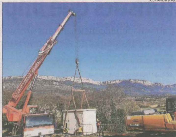
Imatge d'arxiu de la reforma d'una línia elèctrica a Àger.

Aquest col·lectiu de veïns assegura que el canvi de comptadors és obligatori per llei i havien d'estar canviats des del 2018, per poder estimar els consums reals i fixar el preu del consum horari. El canvi a comptadors intel·ligents permet discriminar el consum per hores en lloc d'acceptar un preu fix diari. Aquesta és l'única opció per als que no més disposen de comptadors antics, que no poden estimar el consum en temps real. Per la seua part, des de la companyia distribuïdora, Eléctrica del Montsec, van assegurar que s'estan canviant molts compta-