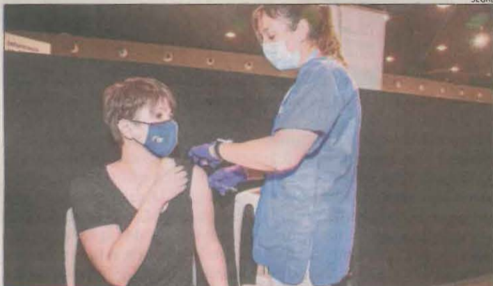
Avanç en la vacunació. El 21% de lleidatans de 40 a 44 anys ja té una dosi, mentre que és el 51% entre els de 45 a 49 anys.