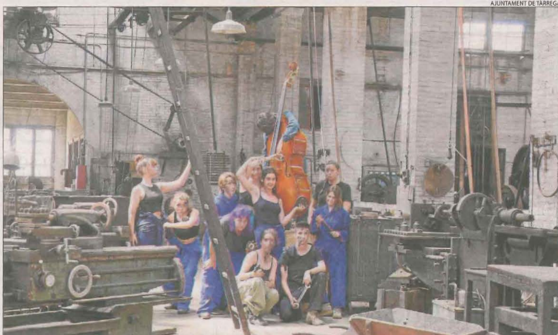
AJUNTAMENT DE TÀRREGA

Alumnes de 1r del cicle formatiu de grau superior de Projectes d'Edificació de l'INS Torre Vicens han estat premiats a la I olimpíada Enginyeria en l'edificació construïnt amb enginy i participaran en la final estatal.