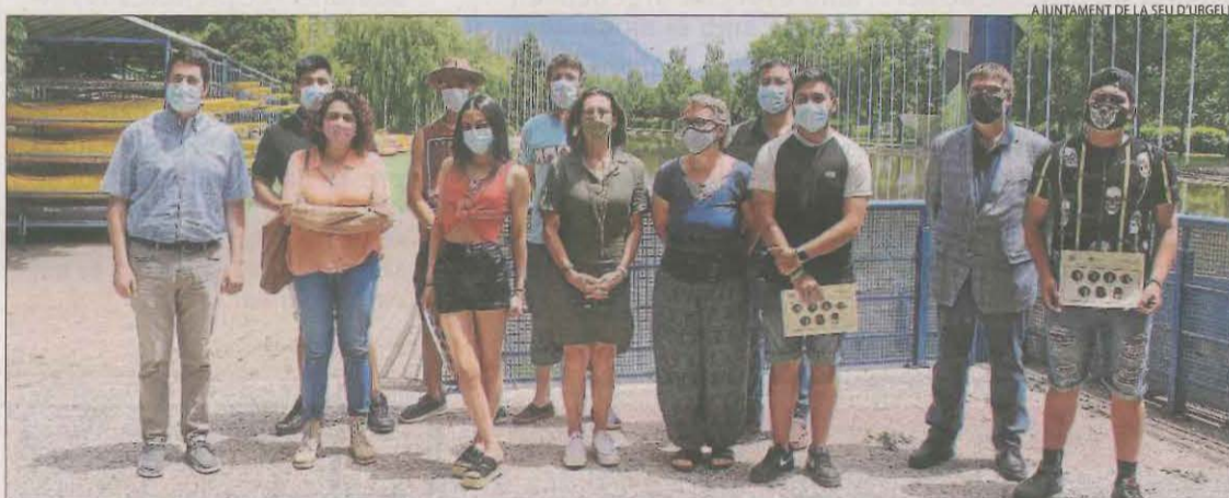
AJUNTAMENT DE LA SEU D'URGELL

performàtic". La proposta, titulada Projecte Matriu: absència i presència de la dona a la Fàbrica Trepat , es repetirà demà en diverses funcions.