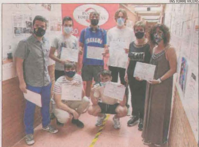
INS TORRE VICENS

L'Espai Cultural La Lira de Tremp va acollir dimarts una jornada contra el maltractament a la gent gran amb la presentació de la campanya Tracta'm bé , impulsada pel consistori i el consell comarcal del Pallars Jussà.