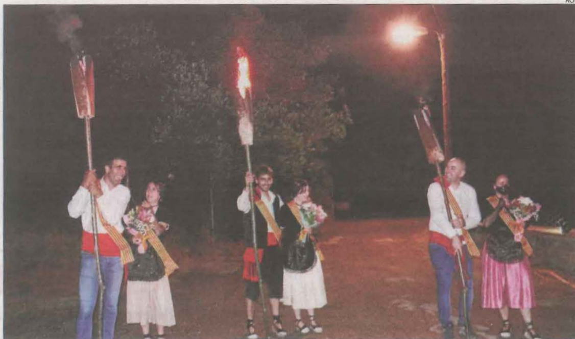
Els tres fallaires de la Pobla que van fer la baixada des de Santa Magdalena.

Després de la recepció per part de les autoritats locals, la caravana de vehicles i ciclistes la traslladarà a la Seu Vella on, amb motiu del desè aniversari del Consorci del Turó, es durà a terme un acte oficial que inclourà la lectura del manifest. En aquesta ocasió, excursionistes del territori baixaran la Flama des de Puigcerdà o el Coll d'Ares, depenent del context sanitari, per la C-13. Ciclistes d'entitats esportives d'Alguai-