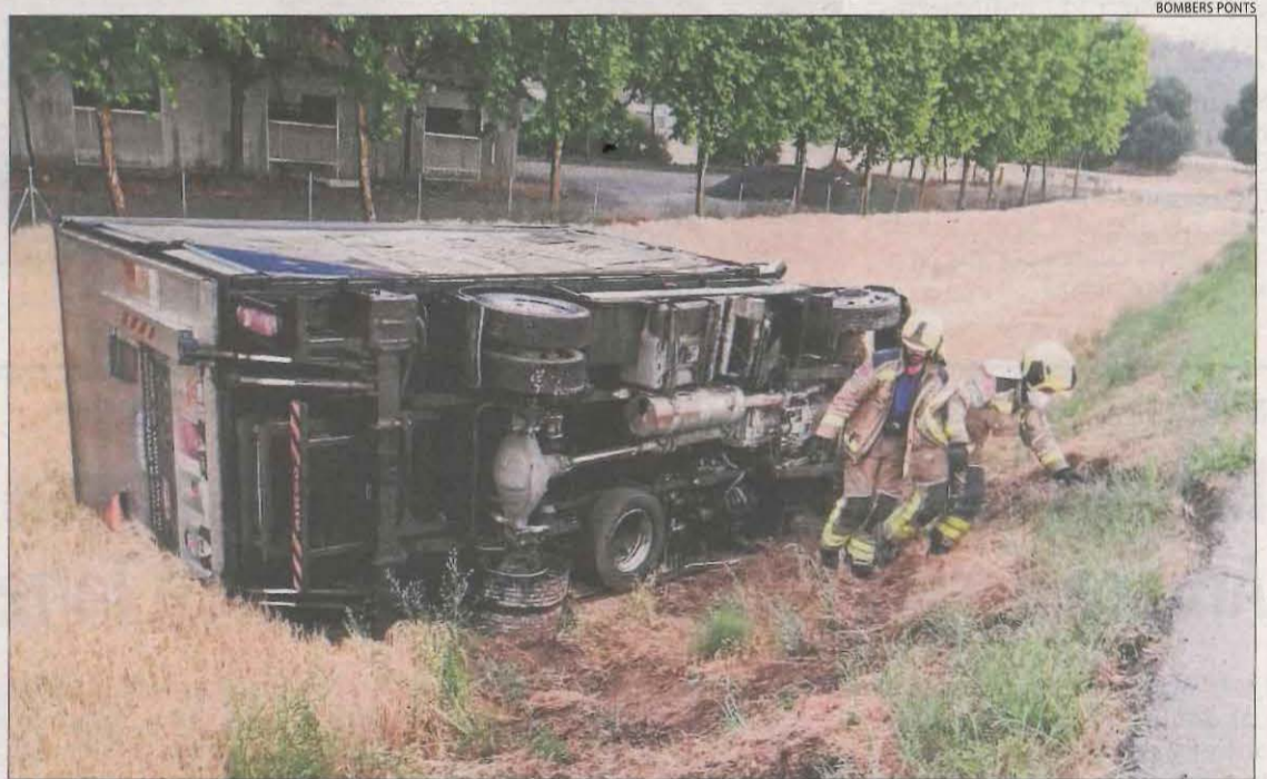
Imatge del camió bolcat ahir a la carretera L-313 a Oliola.

Un camió va bolcar ahir a la carretera L-313 a Oliola i el camioner va resultar contusionat