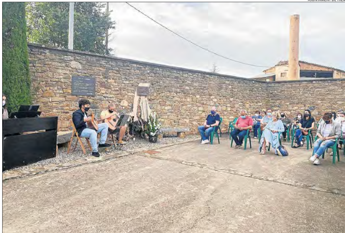
Un moment de l'acte d'homenatge que Tremp va retre ahir a les víctimes de la pandèmia.

La capital del Pallars Jussà ha estat un dels municipis catalans més castigats pel coronavirus i fins al 18 de maig es van comptabilitzar seixanta