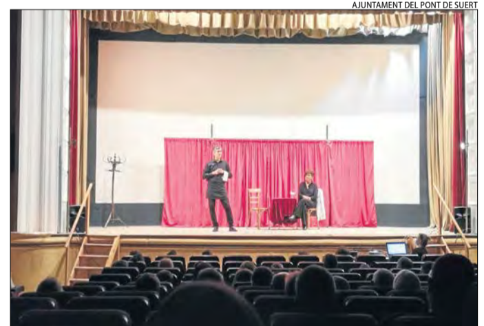
L'obra de teatre que la companyia El Hilo va oferir al Pont.