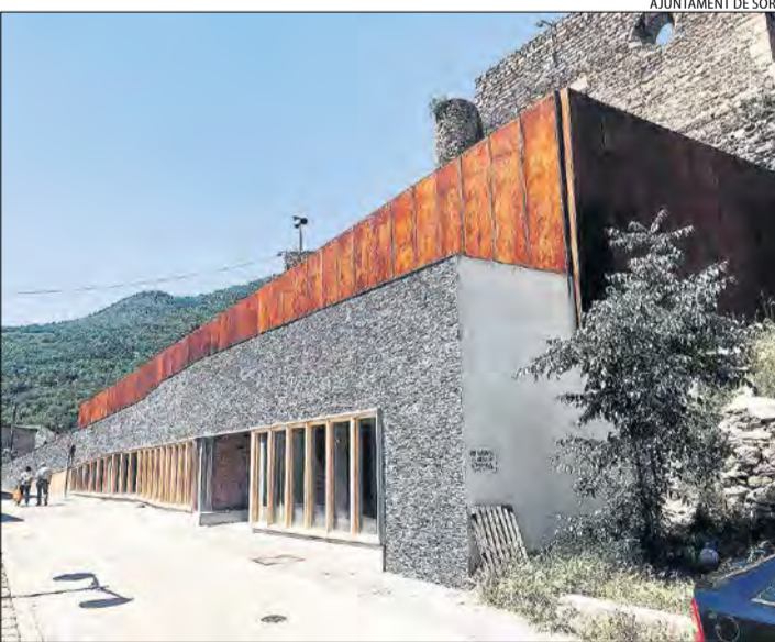
Imatge de l'edifici que acollirà la biblioteca de Sort.

Val a recordar que la primera fase, que va permetre sanejar l'estructura i tancar l'edifici situat sota el Castell de Sort, també es va portar a terme amb un conveni entre el Govern i l'ajuntament. En paral·lel a l'execució de les obres es prepararà l'adquisició del mobiliari, per ara sense dota-