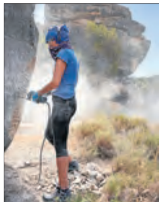
Festival Maldant la Pedra.

In the beggining was... La primera exposició permanent a Europa de l'artista japonesa Chiaru Shiota. Permanent.