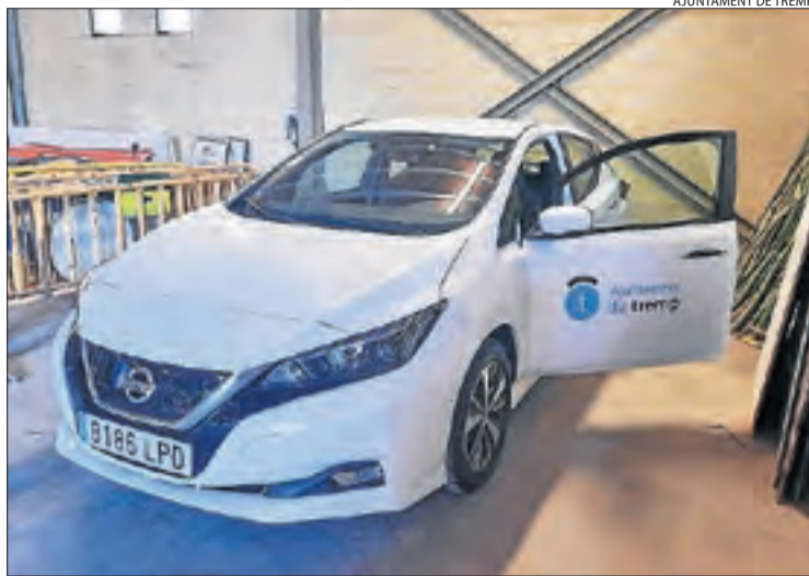
El vehicle elèctric que ha comprat l'ajuntament de Tremp.

El vehicle, un model Nissan Leaf, s'ha adquirit per mitjà de l'Associació Catalana de Municipis (ACM) i ha comportat una