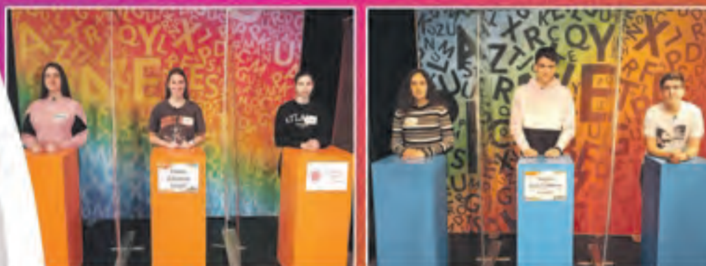
Institut d'Almenar B

divendres 15.30 h Red. dissabte 21.00 h diumenge 10.30 h