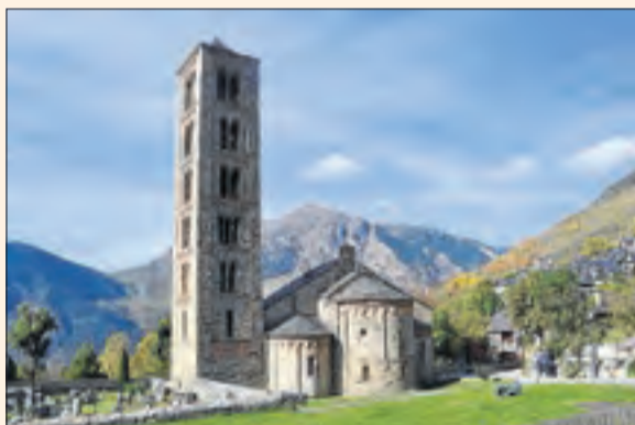
L'església de Sant Climent de Taüll.

Des d'avui i fins diumenge el Centre del Romànic de la Vall de Boí proposa un cicle d'itineraris guiats pels pobles de la Vall de Boí, per descobrir les seues esglésies romàniques i l'entorn excepcional. Avui visiten Taüll i Barruera al matí i Erill la Vall i Durro a la tarda. És gratuïta per a menors de 10 anys, i per als adults costa 3 euros cada itinerari. No inclou l'entrada al temple. És necessària la reserva prèvia i les places són limitades.