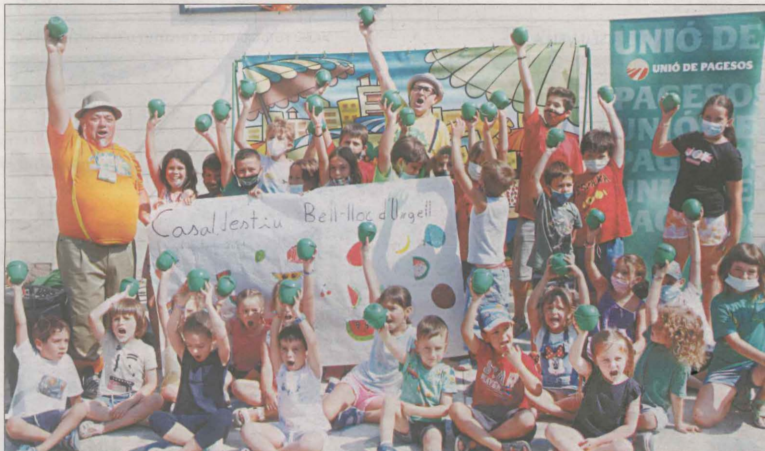
Unos 400 niños y niñas de las comarcas de Lleida se beneficiarán de la iniciativa

El sindicato Unió de Pagesos advirtió ayer del cese de las exportaciones de carne de porcino a China, que era hasta ahora el cliente principal de los ganaderos leridanos. Aseguró también que con la nueva legislación perderán competitividad. COMARQUES | PÁG. 19