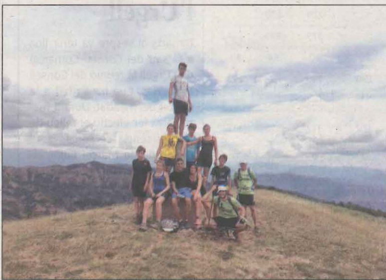
El grup de joves ha passat el cap de setmana a Tremp

les comarques del Pla d'Urgell, Noguera, Pallars Jussà i l'Alta Ribagorça. Aquesta ruta, d'uns 142 quilòmetres passa per 5 comarques i 23 municipis, entre ells el municipi de Tremp. Concretament, Vilamitjana i Espluga Serra, els quals han acollit aquesta setmana el camp de treball. Ahir els joves participants van seguir el camí en direcció Perves.