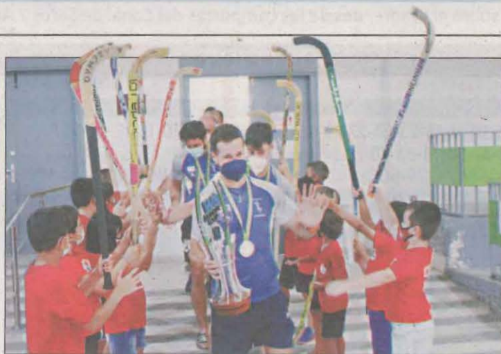
Los pequeños recibieron a los campeones

Los jugadores y jugadoras de la base del equipo de la localidad disfrutaron de los campeones, que quisieron agradecer que la población ha acogido sus partidos esta temporada. | PÁG. 25