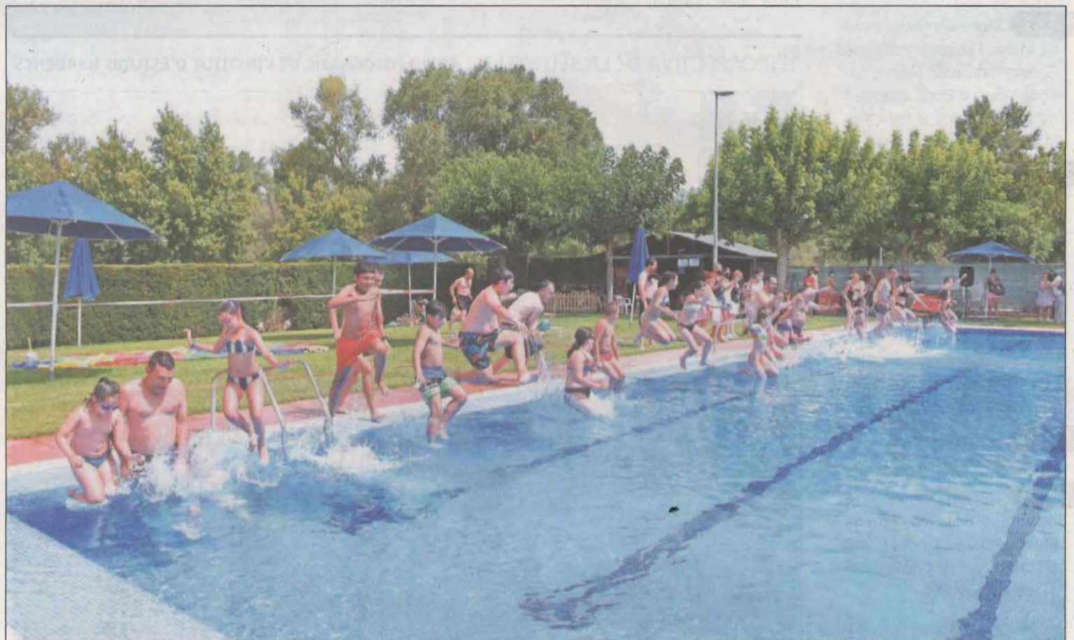
El acto central del 'Mulla't' en Lleida se celebró ayer a las 12.00 horas en las piscinas de Torres de Segre con una gran participación de vecinos del municipio

El Mulla't per l'esclerosi múltiple llegó ayer a su 28a edición con el acto central en Lleida en las piscinas de Torres de Segre. Más de 500 instalaciones de toda Catalunya participaron ayer en esta cita solidaria y refrescante que pretende visibilizar esta enfermedad y recaudar fondos para luchar contra ella. LLEIDA | PÁG.10