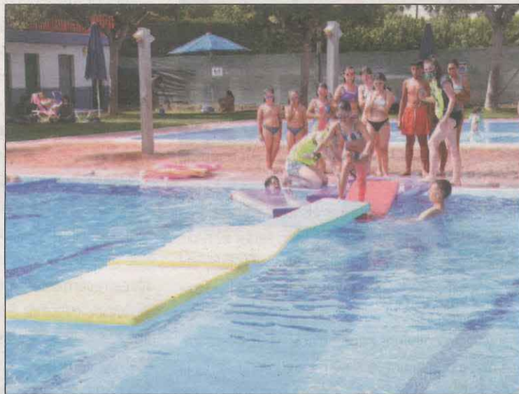
Els nens van gaudir de les activitats organitzades

Torres de Segre va acollir l'acte central i unes cent piscines lleidatanes van participar en la 28a edició