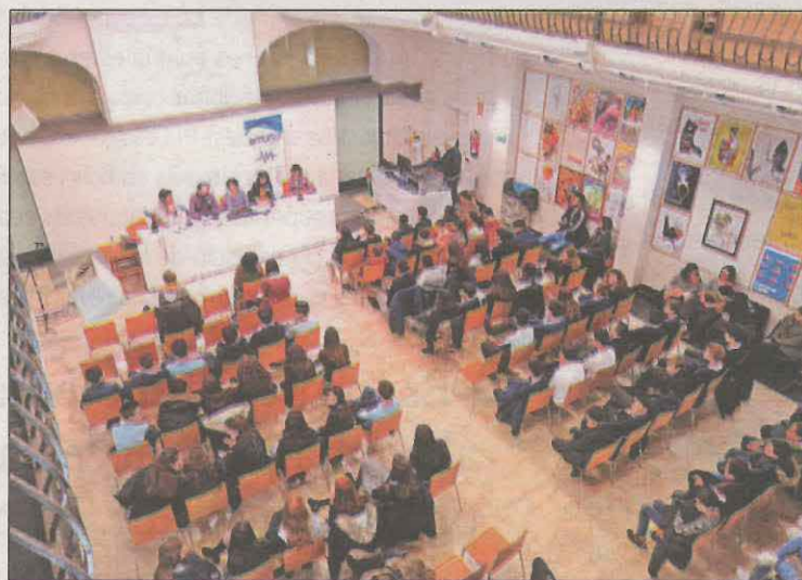
La sala Alfred Perenya acollirà dimecres el plenari