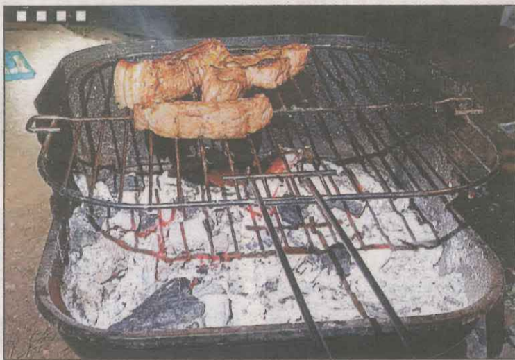
Es va enxampar gent fent barbacoes al bosc

El Grup Especial de Verins i Antifurtivisme dels Agents Rurals ha realitzat 7 denúncies per incomplir la normativa de pesca i també ha fet 8 sancions per encendre foc en terreny forestal, durant les inspeccions realitzades a les zones properes al riu Segre. Des del cos van recordar que està totalment prohibit fer foc.