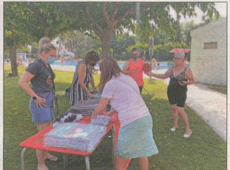
Les piscines de les Borges també van acollir el Mulla't