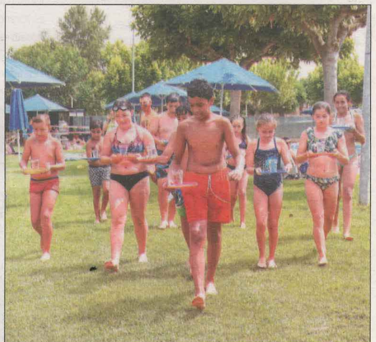
Moment d'un dels jocs que es va dur a terme