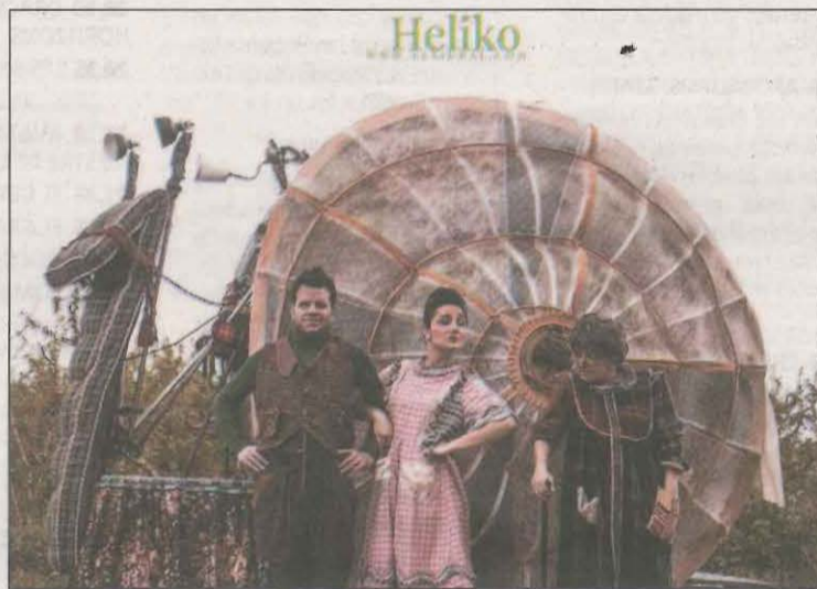
El Sidral és una de les companyies participants