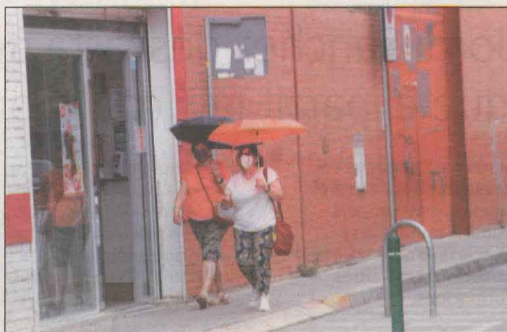
Els paraigües servien ahir per protegir-se del sol

A més, es va recomanar a la població i en especial a la més vulnerable a aquest risc com són les persones majors de 75 anys, malalts crònics, persones discapacitades físiques/psíquiques, indigents, així com persones que queden desemparades i exposades directament als efectes de la calor que seguissin les recomana-