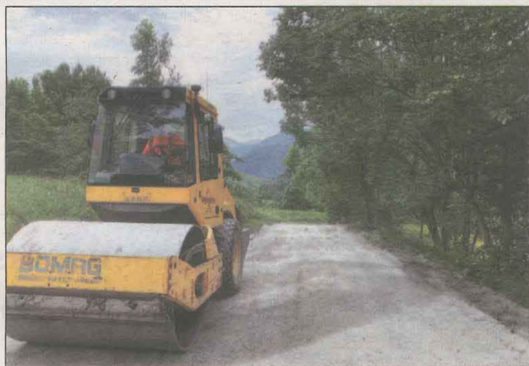
Les tasques de millora ja han finalitzat

L'EMD de Bagergue ha acabat els treballs de manteniment i reparació de la pista forestal que va de Bagergue a la Ribera de la Llana. En concret, s'ha reparat la pista forestal que va des de Bagergue fins al barranc de Moredo, col·locant guals per a l'evacuació de l'aigua i poder controlar la velocitat dels vehicles.