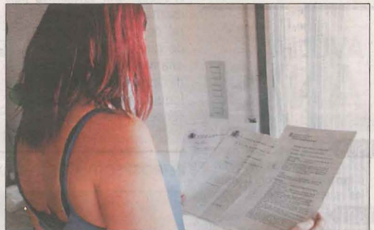
La mujer está viviendo un auténtico calvario

La vida de A. B. dio un giro inesperado en enero cuando la Policía Nacional de Asturias la llamó al centro educativo donde trabaja preguntándole si había perdido su DNI.