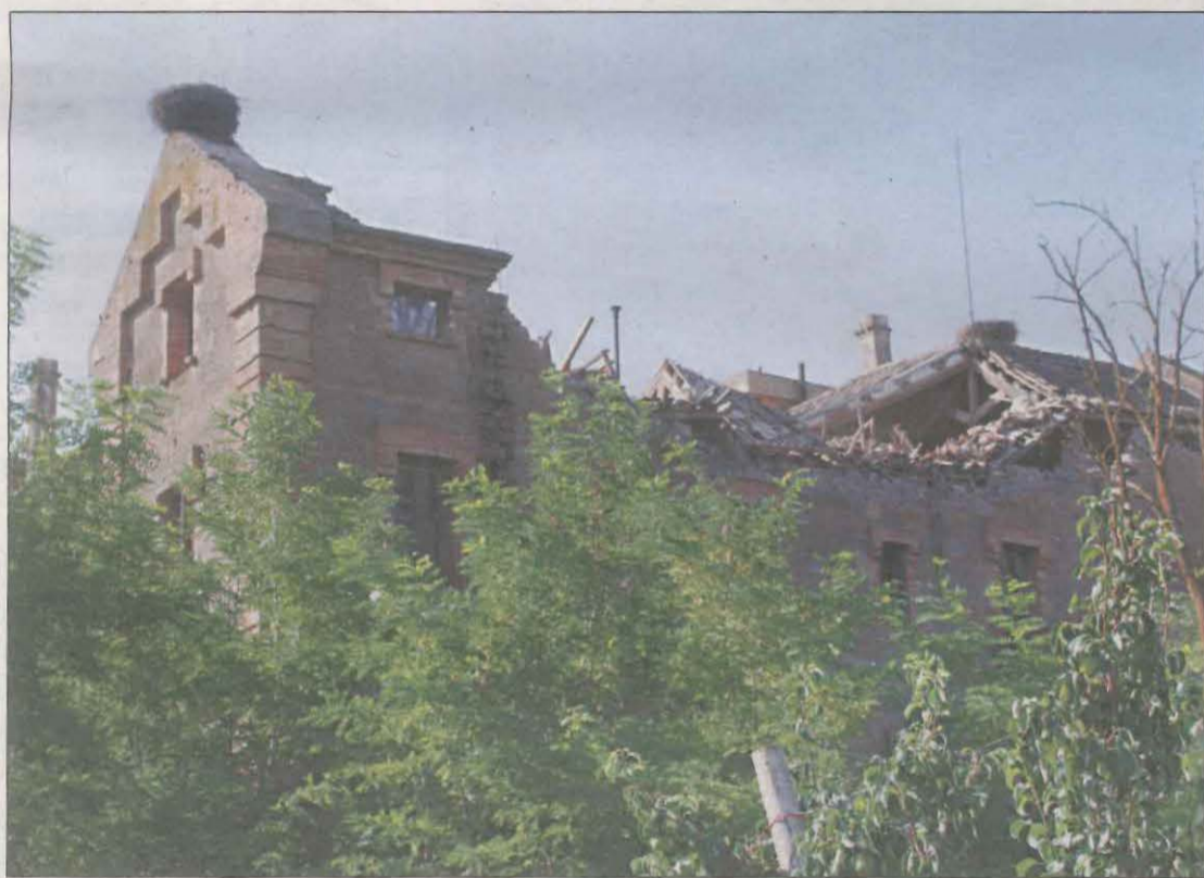
Estado en el que quedó la Casa Gran de la Sucrera, construida en 1900