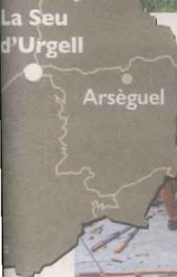
La imatge gran correspon al Parc Natural de l'Alt Pirineu (@PNAlt Pirineu), la imatge vertical del Parc del Segre (LM), la imatge petita de dalt és el Mirador del Cretaci (@Aralleida), la petita de baix del Museu de la Moto (LM) i la petita del costat del mapa, raiers de Coll de Nargó preparant un rai (Albert Lijarcio ACN)