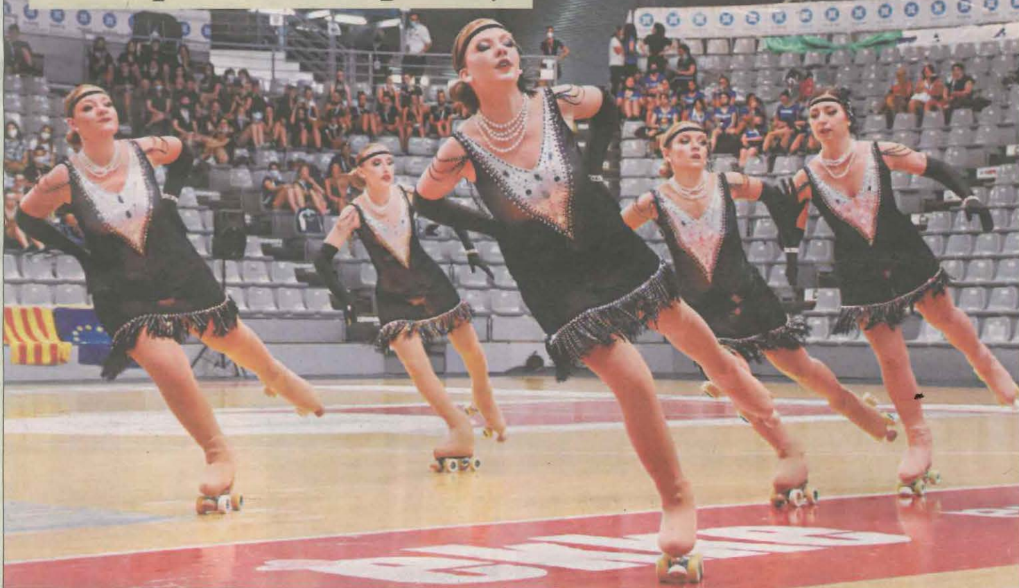
La competición internacional reúne en el pabellón Barris Nord a 63 equipos de seis países