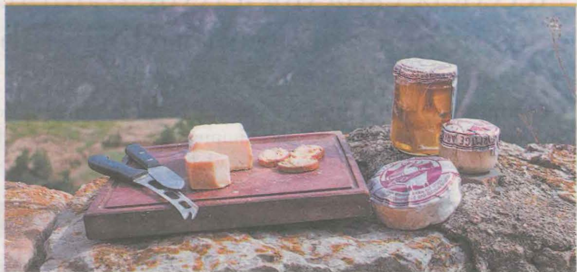
En la imatge una mostra dels productes de proximitat que podem trobar a la comarca