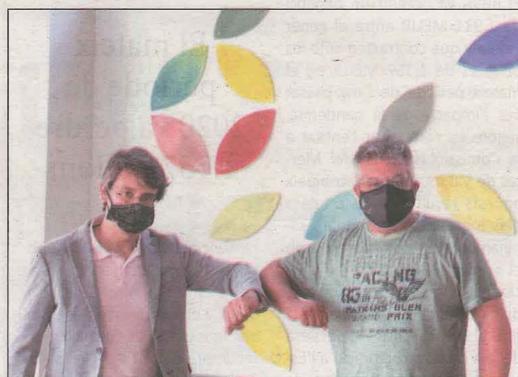
El nou conveni de la fruita es va signar ahir

D'altra banda, les parts que van signar el conveni també es van comprometre a traslladar aquest acord assolit ahir a tot l'àmbit català en futures negociacions, perquè les empreses del sector referents catalanes són sòcies d'Afrucat.