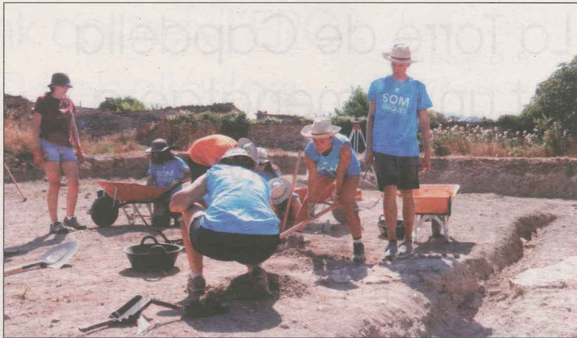
Imatges dels joves del Camp de Treball Internacional d'arqueologia treballant al jaciment

El sorteig del vol, que gestionarà l'escola de vol La Serra de Mollerussa, es realitzarà a través de les xarxes socials d'Alemany. El vol, que es durà a terme a un 300 metres d'altitud, s'iniciarà i finalitzarà a la capital del Pla d'Urgell i mentre es planeja per la serra del Montsec, es podrà contemplar tota la zona.