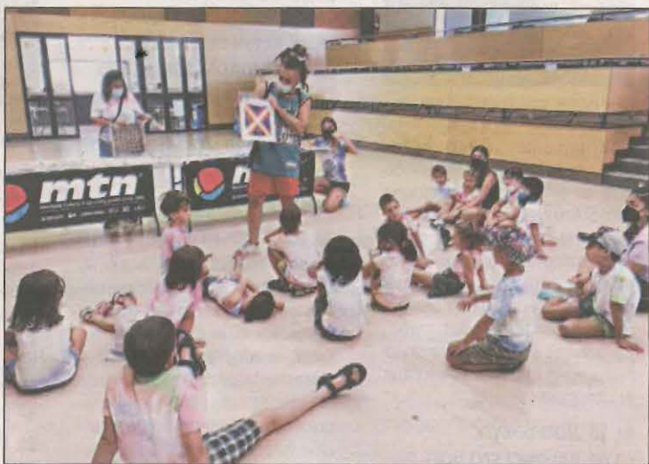
Cada infant farà una peça per a un mosaic