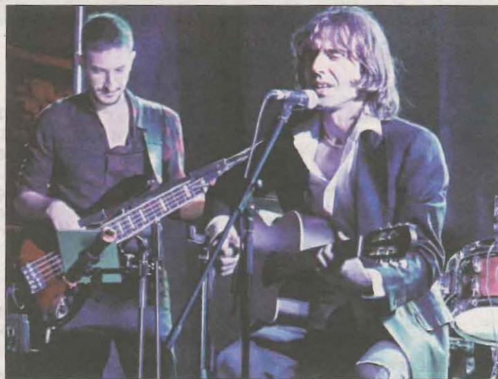
El cantautor i activista lleidatà durant una actuació