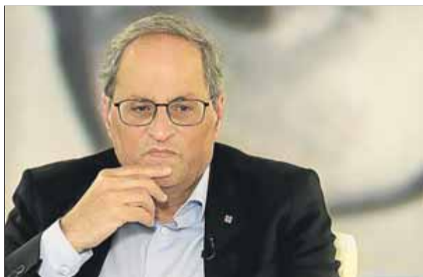
Quim Torra, el 131è president de la Generalitat

La JEC va sancionar Torra amb 2.500 euros per l'enviament de correus electrònics als funcionaris de la Generalitat utilitzant "imatges o expressions identificables" amb el missatge electoral