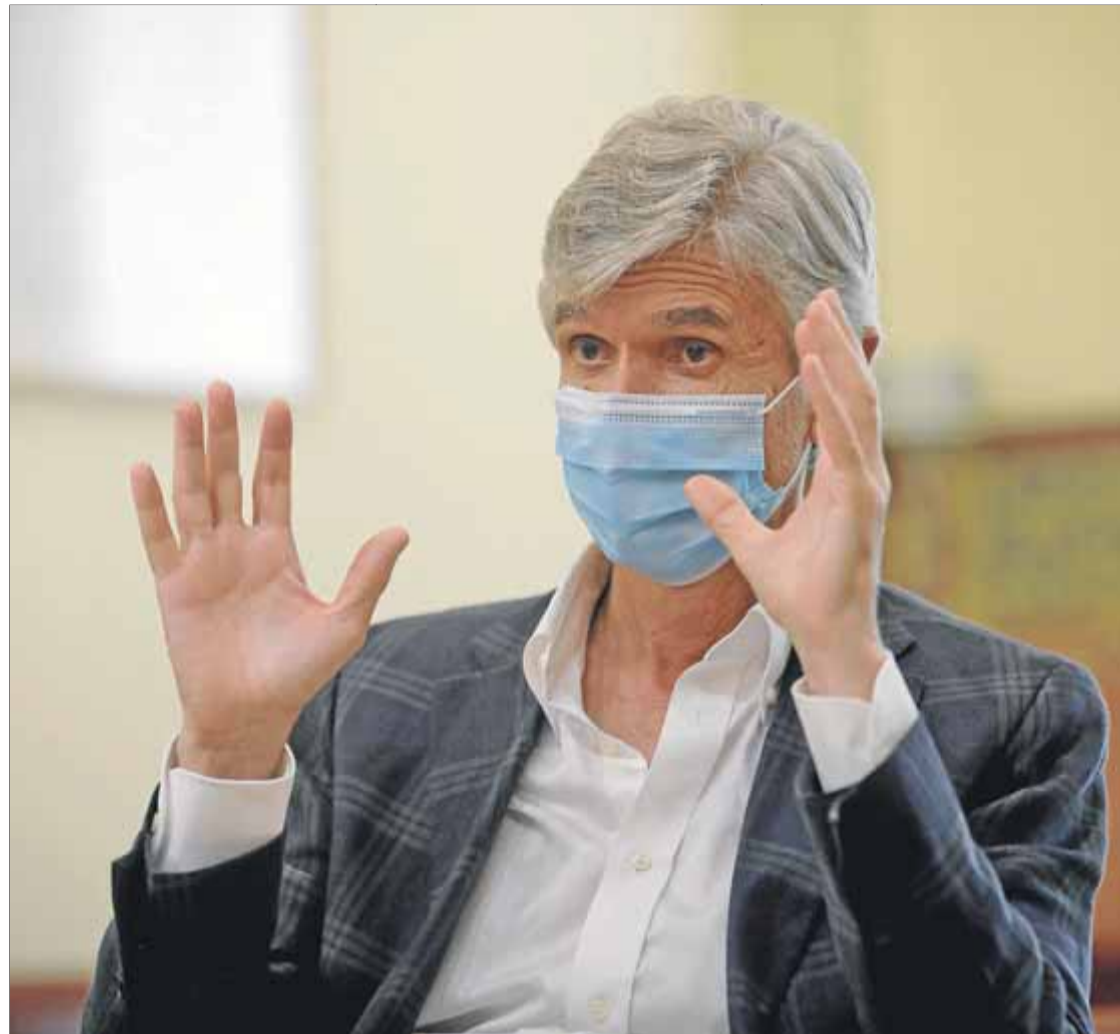
El conseller de Salut, al seu despatx divendres passat, durant el transcurs de l'entrevista

El com el tenim clar. El quan haurà de ser quan la pandèmia estigui controlada; per tant, hem de sortir d'aquesta onada