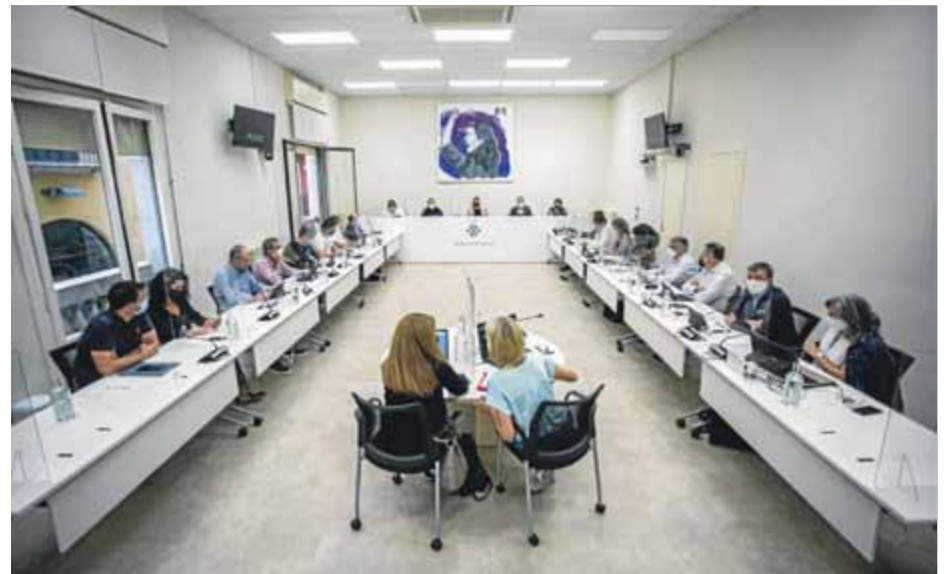
El ple ordinari de l'Ajuntament de Figueres del mes passat ■ QUIM PUIG

És en aquest context que no podem acceptar que l'Estat pretengui liquidar el resultat del model de finançament del 2020 com si es tractés d'un context de normalitat, menys encara quan ni tan sols ha complert amb la promesa feta fa gairebé un any de transferir un fons Covid de 3.000 milions d'euros en favor dels ajuntaments. És a dir, no només no va articular aquest fons, sinó que ara precisament reclamarà 3.000 milions als ajuntaments. I en el millor dels casos ens proposarà un pagament a terminis. No ho podem acceptar; seria una hipoteca massa gran que limitaria el marge de resposta dels ajuntaments davant una emergència social que presenta múltiples derivades. I seria repetir les errades de l'anterior crisi, en la qual, després d'un primer intent de polítiques expansives, l'Estat va imposar de cop un escenari d'austeritat extrema que va comportar la major etapa de retallades. Si bé alguns s'hi van posar massa bé, la realitat és que en gran part va ser un escenari imposat per l'Estat, i no podem permetre que torni a passar el mateix. Se suposa que hem d'esperar quelcom diferent d'un govern format per dos partits que diuen tenir sensibilitat municipalista. De moment, no l'estem veient.