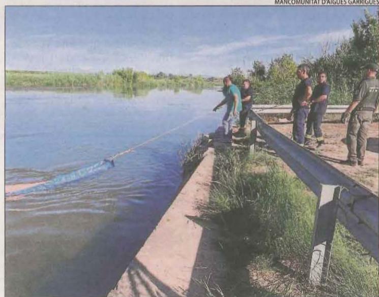
Un cordó de contenció instal·lat per la mancomunitat.