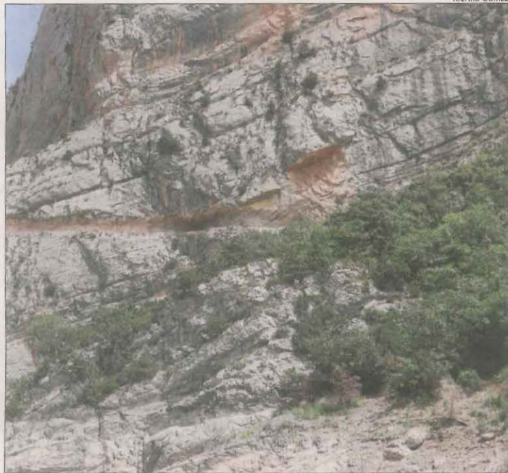
El pendent afectat pel desprendiment que talla el camí.

El tancament d'accessos al congost cancel·la un 15% de les pernoctacions en allotjaments rurals i càmings de la zona al juliol || Faran compatibles els treballs amb activitats a la Noguera Ribagorçana