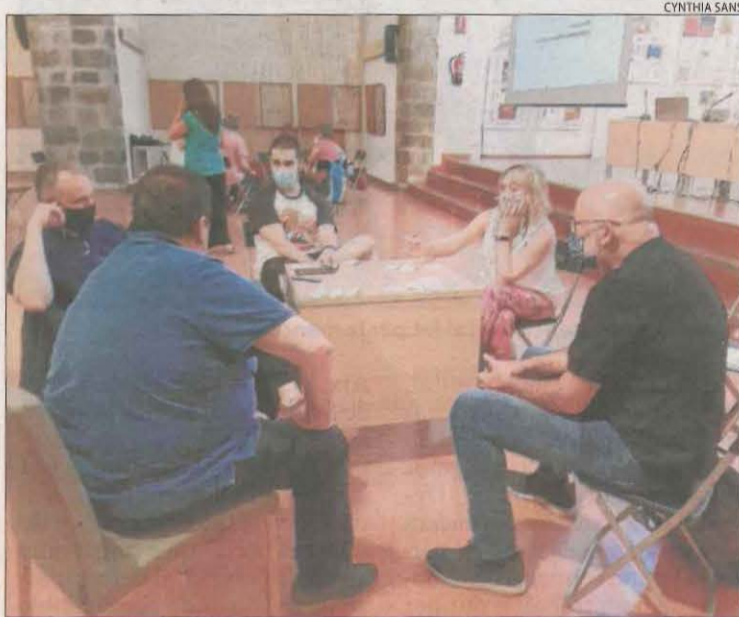
Un dels tallers celebrats ahir a la Seu d'Urgell.