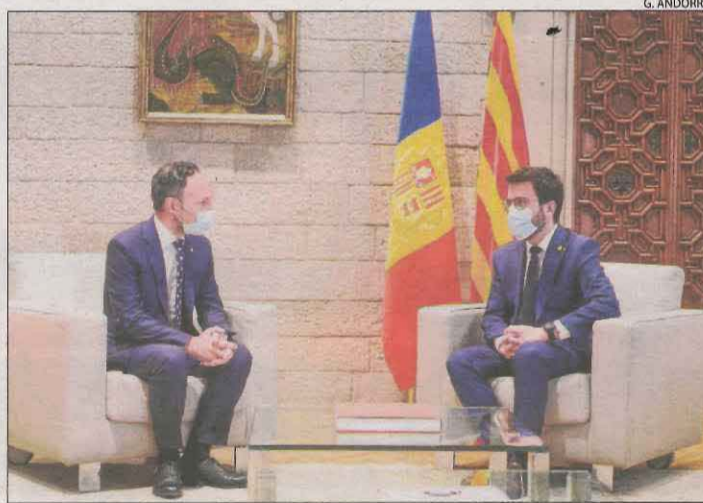
La reunió dels dos presidents al Palau de la Generalitat.