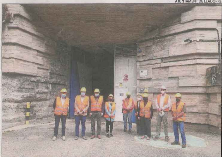
Es reprendran les visites a la central parades per la Covid.