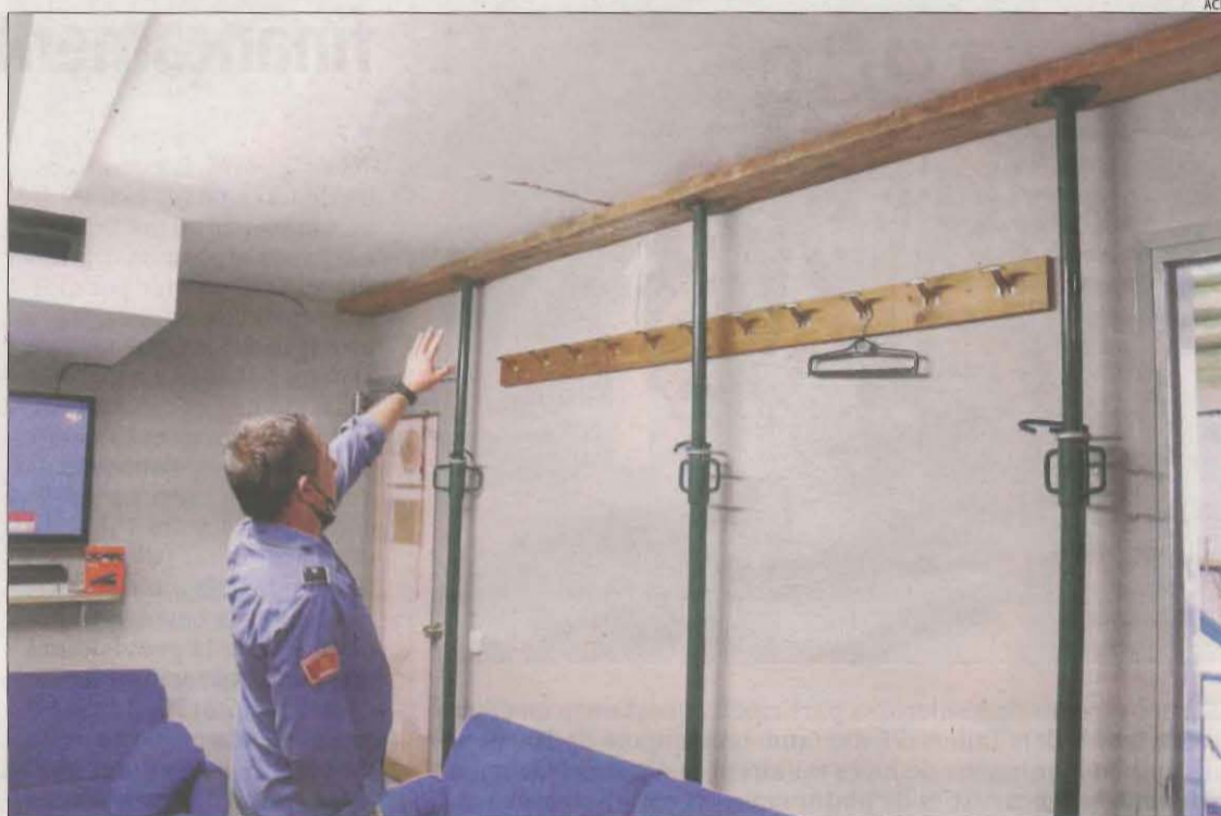
El parc de Seròs ja fa més de cinc anys que està apuntalat.