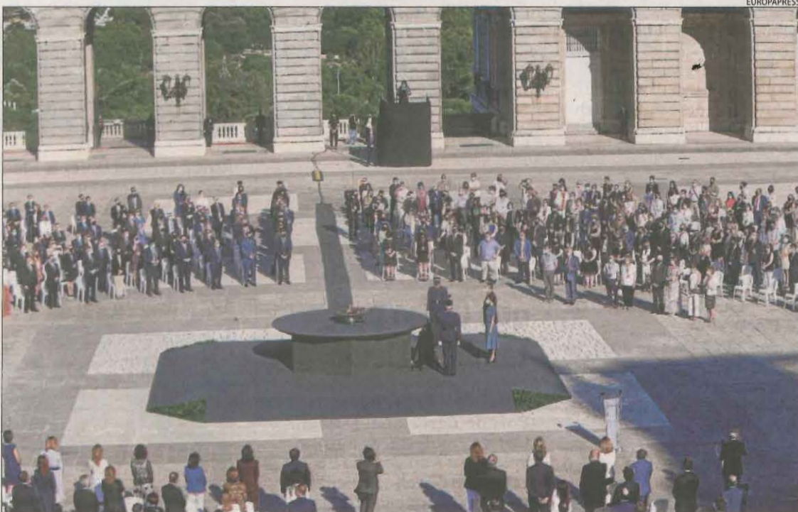
Vista general de l'homenatge d'Estat a totes les víctimes de la Covid.

La cerimònia civil, organitzada per La Moncloa amb un format molt similar al primer homenatge que va celebrar al mateix lloc l'any passat, va combinar el record i el dol per totes les persones que han perdut la