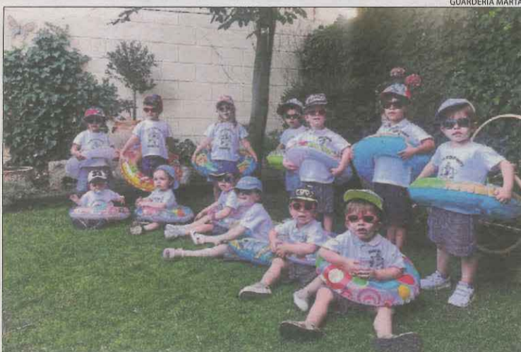
Els petits que van participar ahir en el festival.