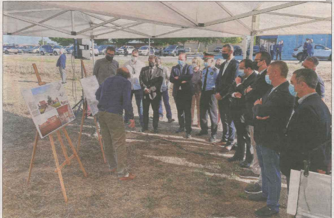
El conseller Elena i altres autoritats escoltant ahir les explicacions sobre la futura comissaria.

a peu de la carretera de Linyola (LP-3322), al costat del parc de Bombers de Mollerussa. A més a més, per a la seua construcció s'utilitzaran materials de baix impacte ambiental, l'edifici disposarà de plaques solars i també serà autosuficient a nivell energètic.