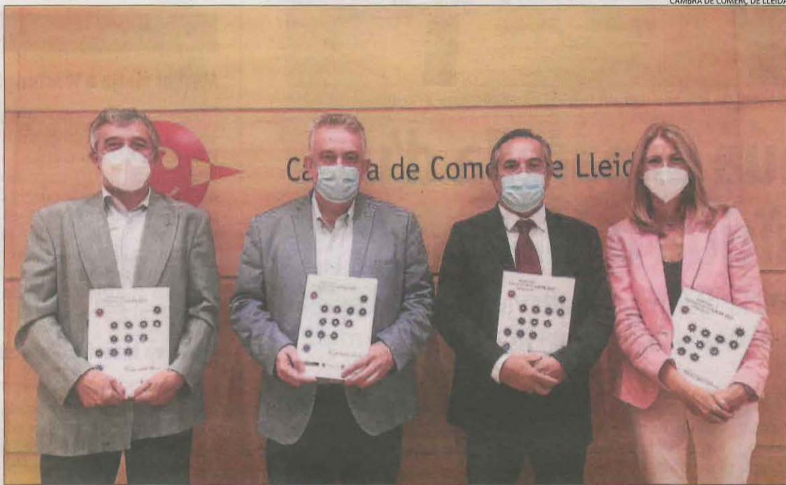
La Cambra de Comerç de Lleida va presentar ahir la memòria de l'entitat de l'exercici passat.

Malgrat tot, hi ha activitats dels serveis com les activitats professionals, administratives, immobiliàries en alguns territoris o artístiques que mantenen