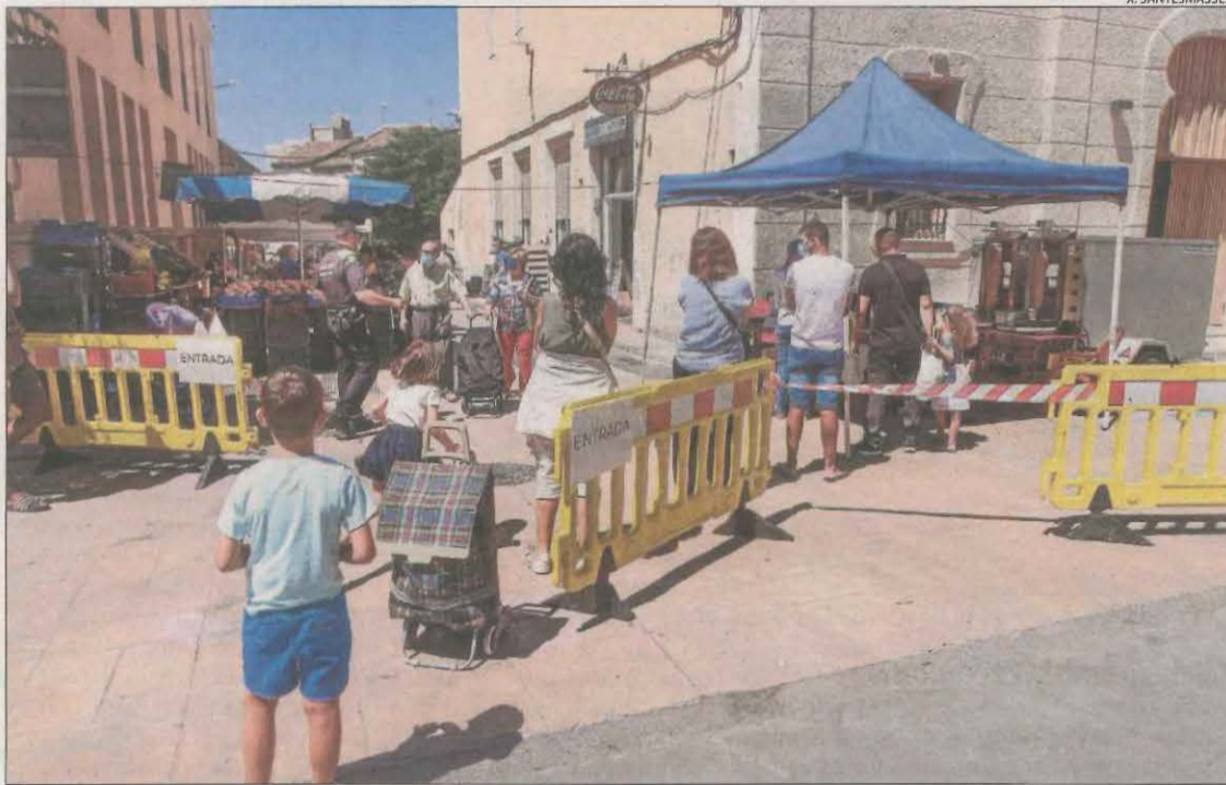
Imatge de les cues que es van formar ahir al mercat setmanal de Guissona.