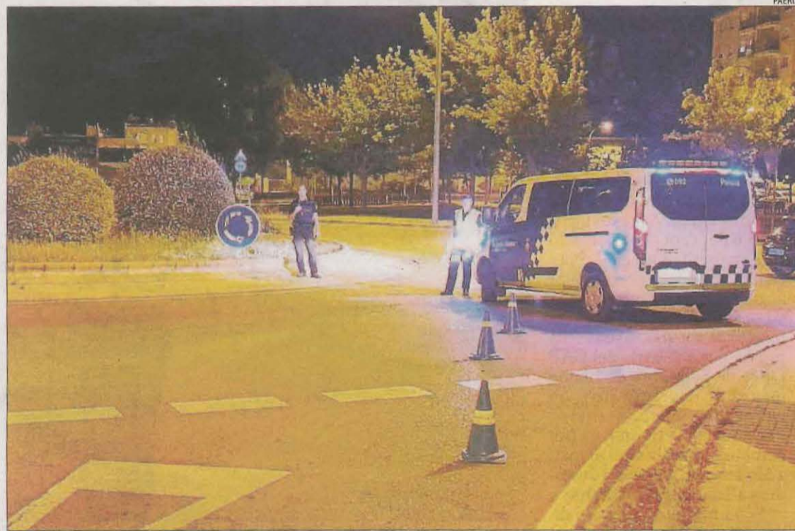
Imatge d'un control de la Guàrdia Urbana a Lleida ciutat durant el toc de queda.

A la resta de punts, les persones desallotjades, sancionades o advertides tenien un perfil més autòcton i eren de les mateixes poblacions.