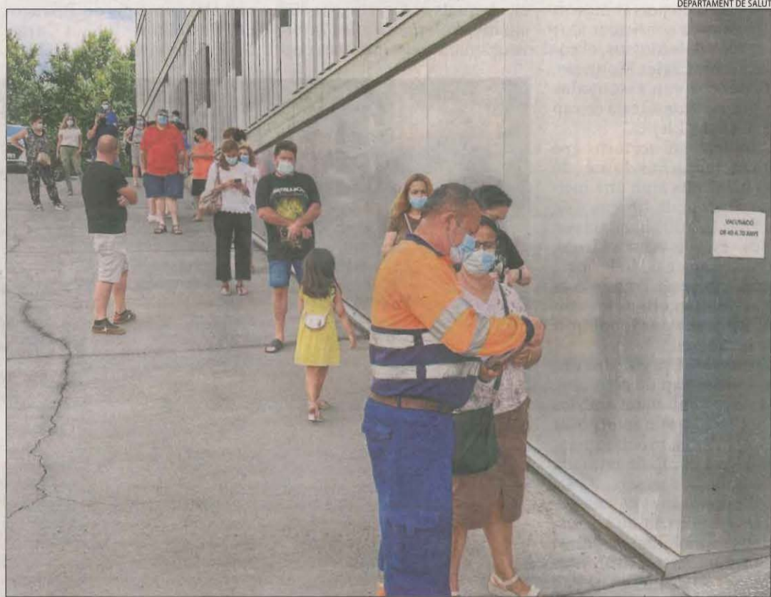
Usuaris majors de 40 anys del CAP Onze de Setembre es van vacunar ahir sense cita prèvia.

Les regions sanitàries de Lleida i del Pirineu han rebut aquesta setmana 24.104 dosis de vacunes contra la Covid, de les quals 18.444 són de Pfizer; 4.699, de Moderna i 961, d'AstraZeneca. A la província, el 55,6 per cent de la població està immunitzada i el 61,5 per cent té una dosi. Per continuar augmentant la cobertura, Salut va organitzar ahir una nova marató de vacunació sense cita prèvia per a usuaris del CAP Onze de Setembre de Lleida majors de quaranta anys, on van acudir vuitanta persones. Per aquesta setmana, es pot demanar cita per avui al matí a Mollerussa, per avui i divendres a Tremp ; per divendres a la Seu i per avui, dijous i divendres a Vielha.