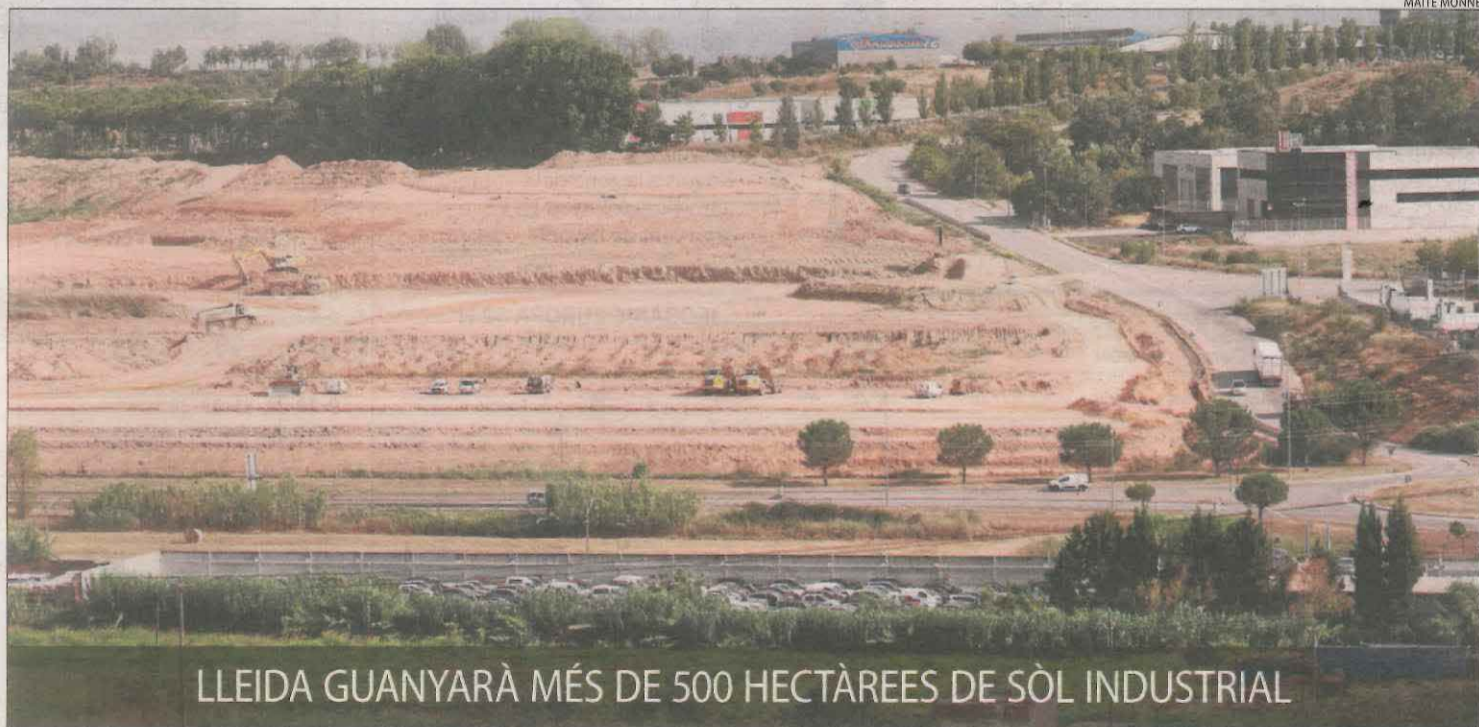
LLEIDA GUANYARÀ MÉS DE 500 HECTÀREES DE SÒL INDUSTRIAL