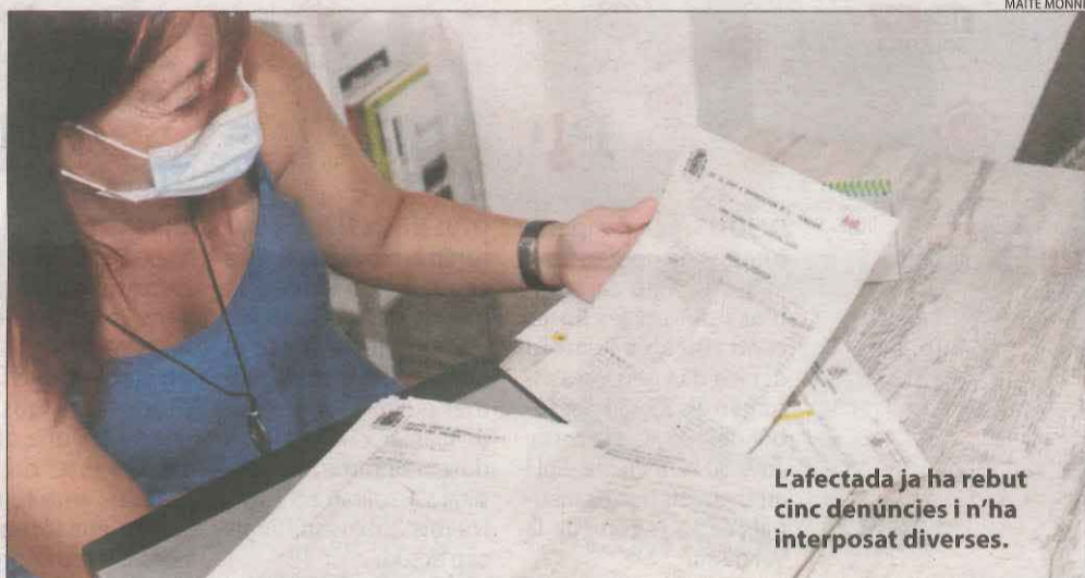
L'afectada ja ha rebut cinc denúncies i n'ha interposat diverses.

Conseqüències || El banc li dona 60 dies per retirar els diners i no li deixa ingressar la nòmina ni fer gestions