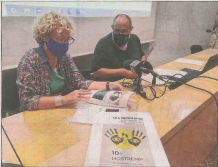
L'alcaldeessa de Tremp va presentar el festival amb el director.