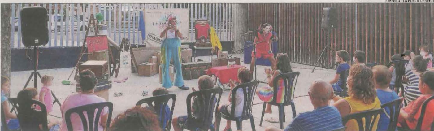
JOVENTUT LA POBLA DE SEGUR

Com cada any, l'Associació de Comerciants de Democràcia i Remolins ha tornat a decorar aquests dos carrers de Lleida amb fanalets de Sant Jaume, amb l'objectiu de dinamitzar i embellir aquesta part del centre de la ciutat.