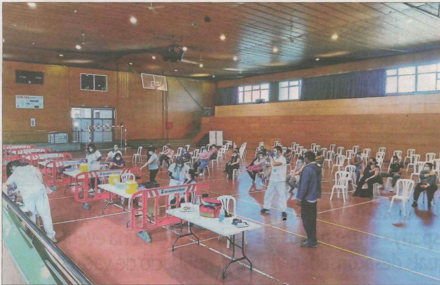
Imatge d'arxiu d'una vacunació massiva contra la Covid al pavelló d'Aitona.