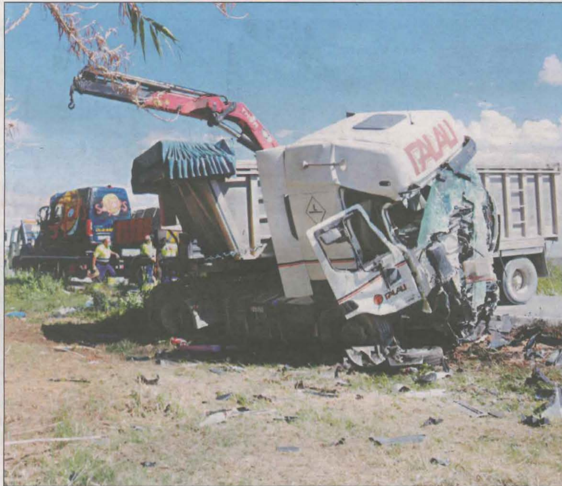
Imatge d'arxiu d'un dels darrers accidents mortals a les carreteres de Lleida

En paral·lel, Trànsit ressalta que aquest mes de juliol s'ha frenat l'accidentalitat mortal de les motocicletes, amb un únic motorista mort a les carreteres ca-