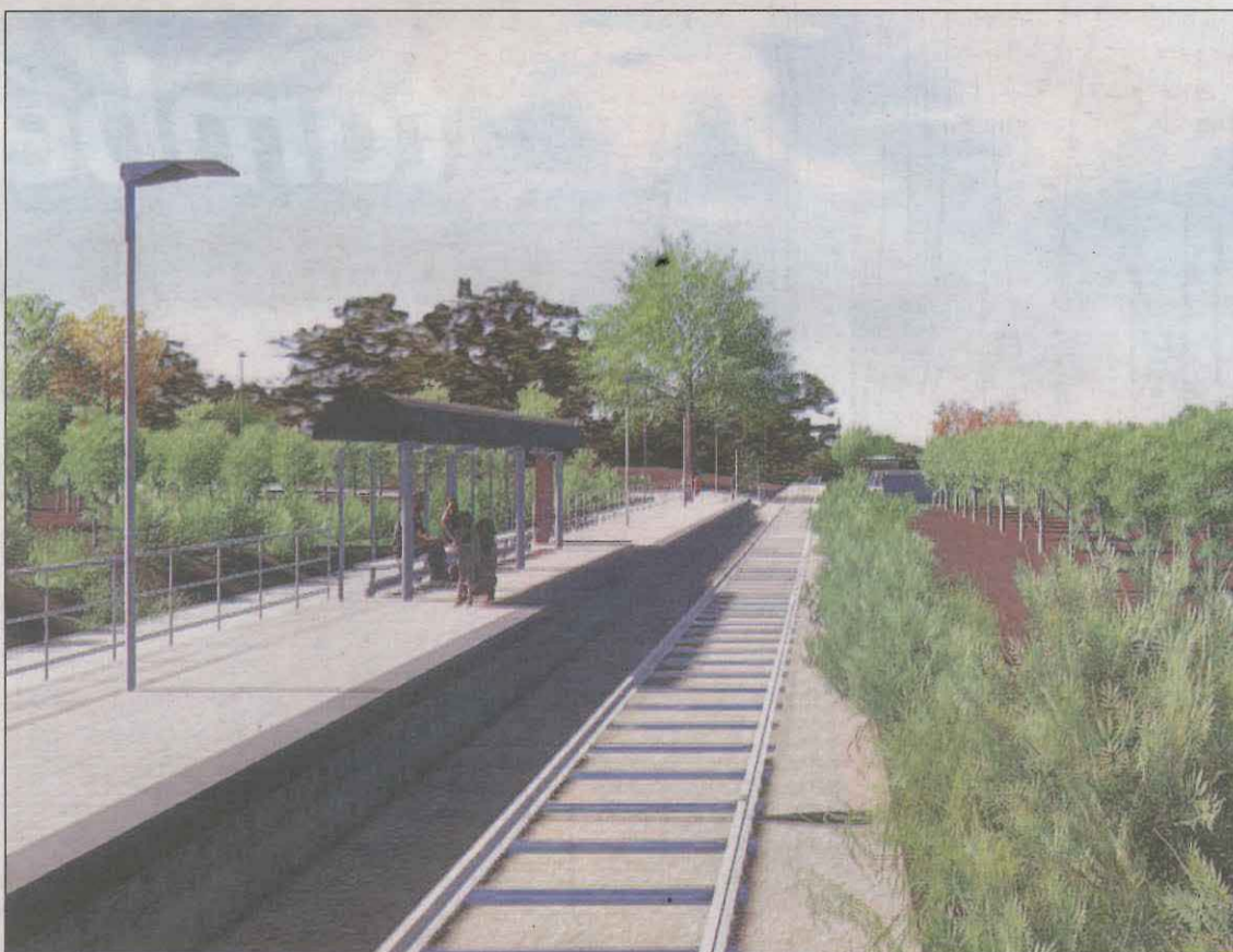
Simulació de com serà el nou baixador, que estarà aprop del Molí de Grenyana

El secretari d'Infraestructures i Mobilitat ens avança que han sol·licitat a l'Ajuntament de Llei-