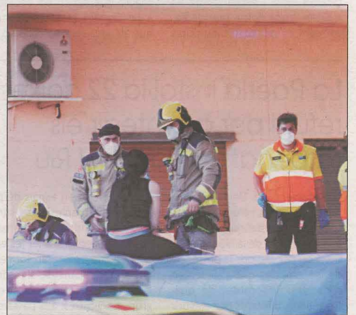
Els Bombers van enviar fins a 6 dotacions

Dues persones van resultar ahir afectades pel fum d'un incendi a la cuina d'un habitatge als Blocs Catalunya, a Pardinyes, segons van informar els Bombers. L'alerta es va donar a les 18.11 hores per un incendi d'habitatge al número 44 del carrer Comtes d'Urgell de Lleida. Van anar fins a 6 dotacions dels Bombers i van costatar que era un foc de cuina, sobre el qual van intervenir. El Sistema d'Emergències Mèdiques de la Generalitat (SEM) també va actuar i va atendre dues persones afectades pel fum, a les quals se'ls va donar d'alta al mateix lloc, sense haver de ser traslladades. La Guàrdia Urbana també va intervenir. Dissabte va haver un altre foc a la cuina d'un habitatge al Carrer Major de Lleida, sense cap afectació personal.