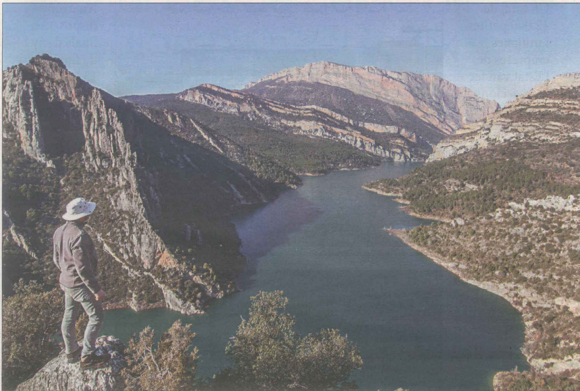
Vista panoràmica de Mont-rebei, que permet gaudir d'activitats de senderisme, barranquisme o rutes en caiac, entre altres