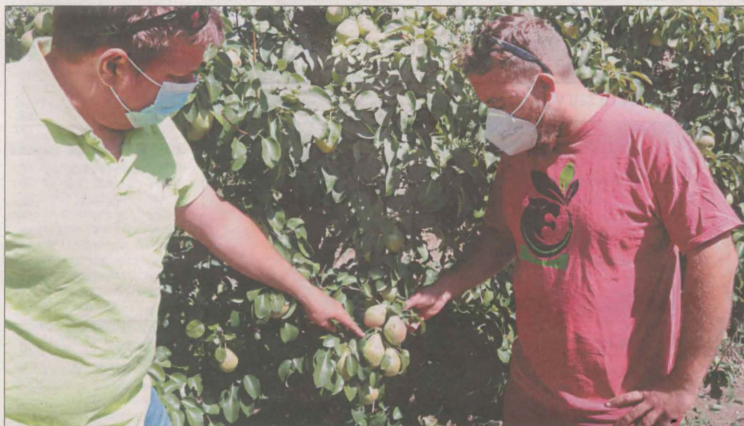
Los agricultores afectados por la granizada del sábado en campos de les Garrigues, l'Urgell y el Segrià piden un peritaje rápido

LAS VÍCTIMAS MORTALES DE LOS PRIMEROS SIETE MESES DE ESTE 2021. El total de personas que han perdido la vida en las carreteras catalanas es de 75, una cifra que supone un 25% menos que en el mismo periodo del 2019 | P.13