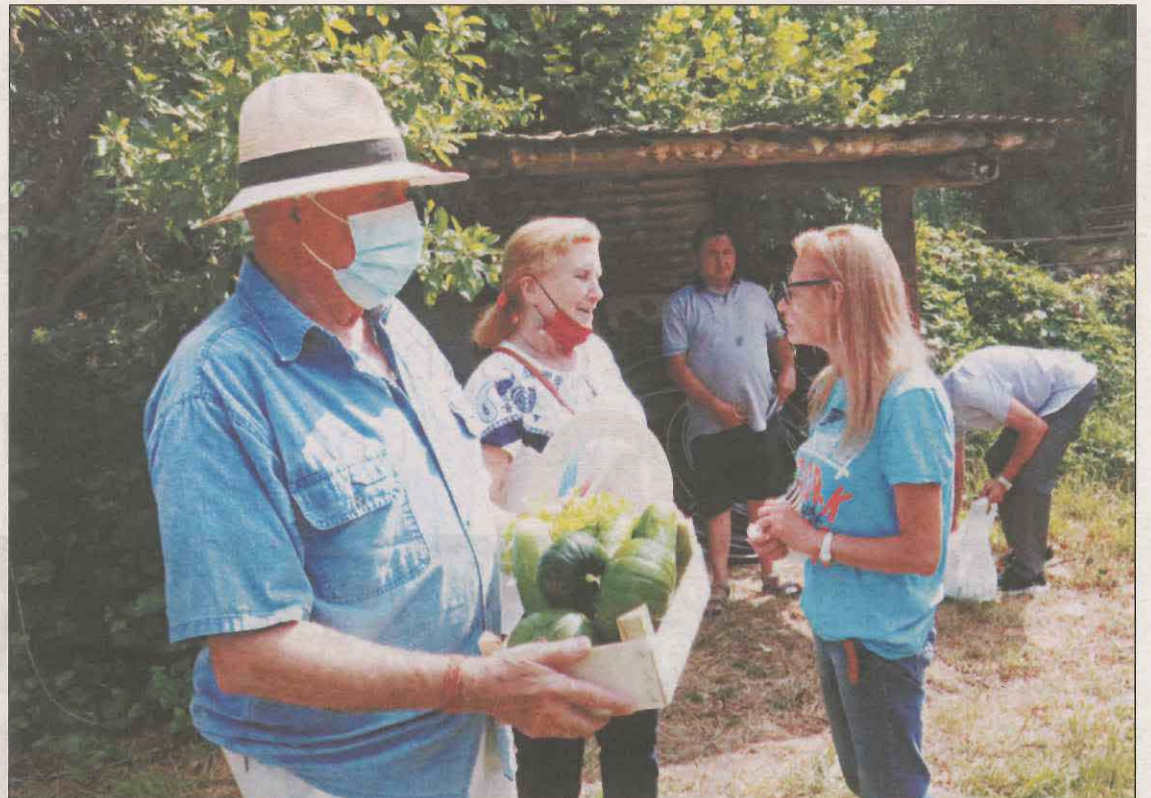
Veïns de Senterada en un dels horts col·lectius recuperats