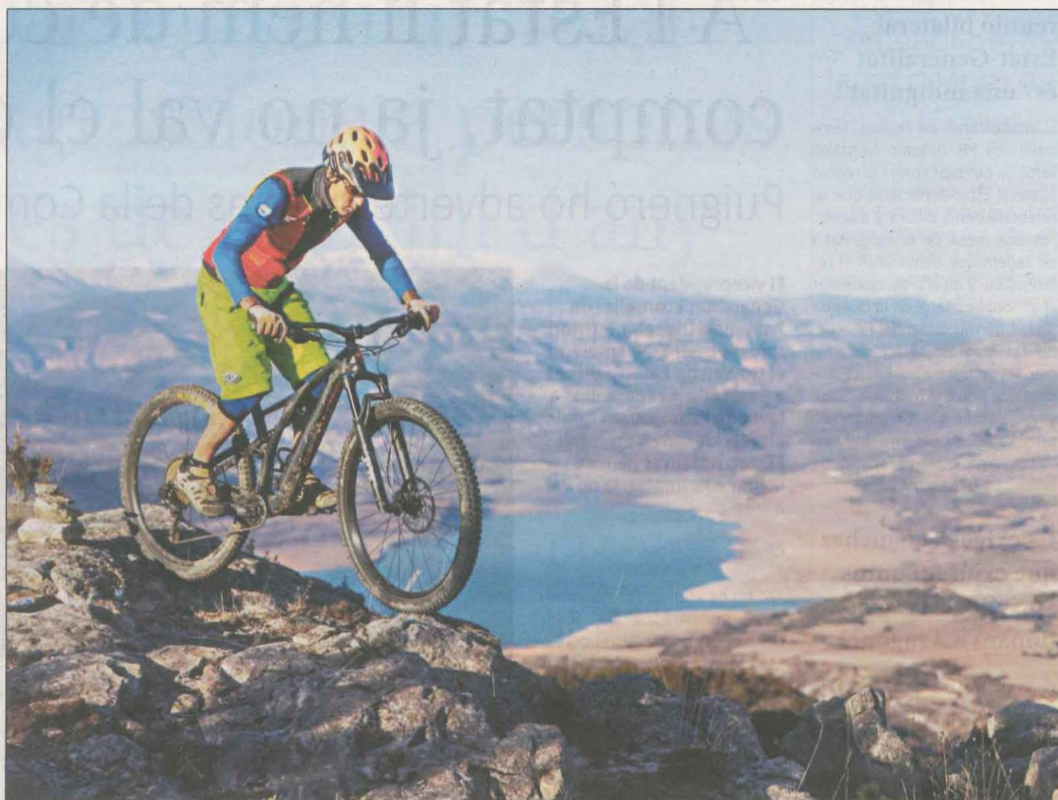
Espectaculars vistes del pantà de Sant Antoni, situat al riu Noguera Pallaresa, al municipi de Talarn

A més de centrar-se en aspectes geològics, el geoparc ofereix al visitant un ventall de propostes de temàtiques diferents gràcies a la vintena de centres interpretatius i museus dels quals disposen en la seva oferta. Verdeny menciona, entre altres, el Museu de la Conca Dellà o el Museu Hidroelèctric de Capdella. "També oferim opcions com rutes i diferents empreses organitzen guiats especialitzats, com per exemple vols amb