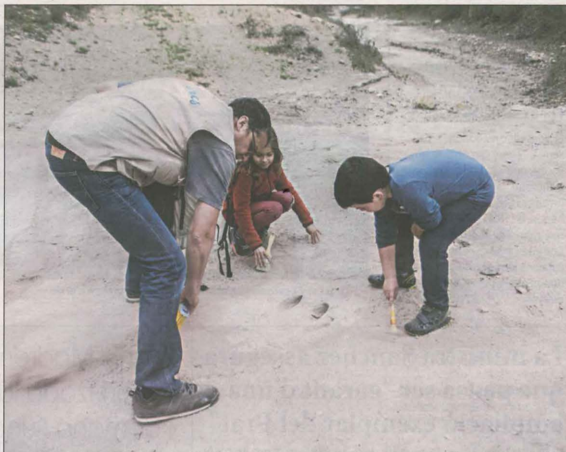
Uns nens davant una petjada de dinosaure visible des del Museu de la Conca Dellà

El Geoparc Orígens no és una excepció i ofereix activitats educatives per escoles i instituts, alhora que col·labora amb diferents universitats. Verdeny explica que per als més petits "hem organitzat un escape room, mentre que amb els alumnes de secundària hem fet una prova pilot que ha consistit en uns intercanvis virtuals