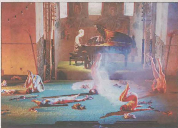
Uno de los espectáculos ofrecidos en esta edición

Los organizadores de la 30a edición del Dansàneu. Festival de Cultures del Pirineu valoran muy positivamente el éxito de este fin de semana. Aseguran que se debe a la diversidad y aumento de público así como a la complicidad de los artistas que han participado. | P.29