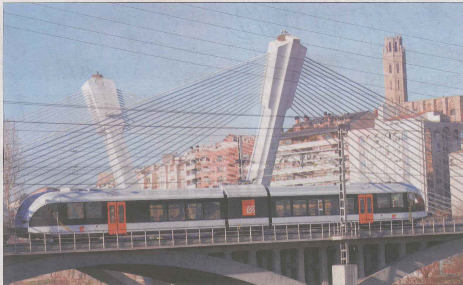
Foto d'arxiu del tren de la Pobla sortint de l'estació de Renfe de Lleida en direcció al Pallars

Aquest baixador vol introduir a Lleida la nova cultura de la bici i el patinet en detriment del cotxe privat. "Al costat del nou baixador farem un pàrquing de bicis, volem fomentar l'ús de les bicis i el patinet, que la gent quan baixi es desplaça a les seves respectives empreses amb aquest sistema de transport que poden dur amb ells al tren", ens diu Gavín. El nou baixador estarà a tocar del Parc de la Mitjana, per tant,