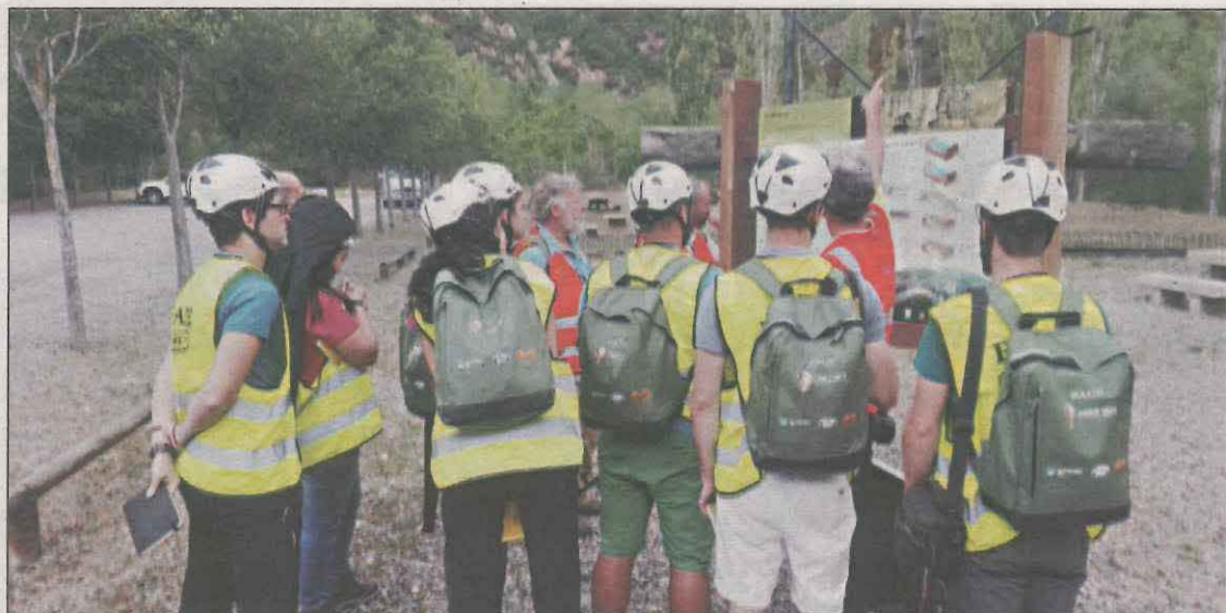
Un grup de visitants en una de les rutes guiades que ofereix el parc

Abans de la designació oficial i d'entrar a la Xarxa Mundial de Geoparcs de la UNESCO, van haver de realitzar un estudi comparatiu amb el Geoparc Sobrarbe-Pirineus, ja que “es volien assegurar que explicàvem històries diferents”, relata Nú-