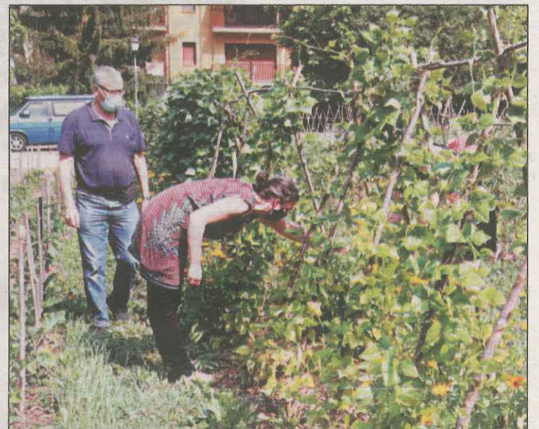
Els socis de l'entitat fan de pagesos