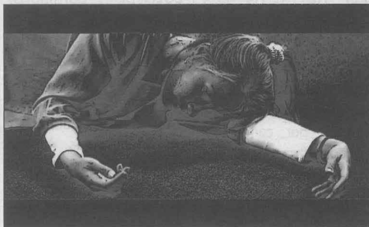
Fotograma de 'Pandèmia', realitzada aquest 2021