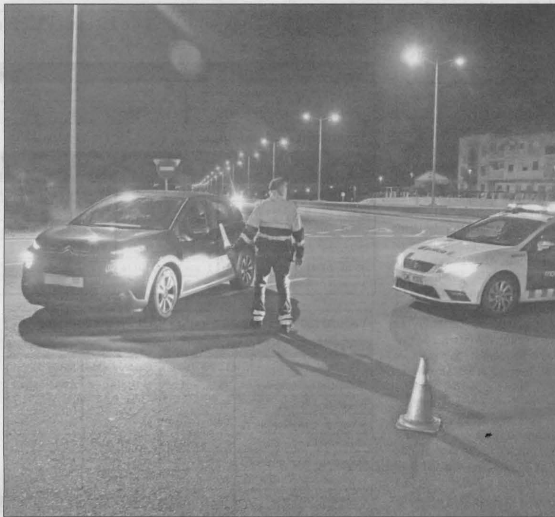
Els controls nocturns s'ampliaran de 163 municipis a 176 si ho aprova el TSJC

En el cas de la demarcació de Lleida, en aquest nou llistat els municipis afectats seran Almacelles (amb una incidència de 316 casos per cada 100.000 habitants), Alpicat (361), Balaguer (379), Bellpuig (283), la Seu d'Urgell (462), les Borges Blanques (319), Lleida (345), Mollerus-