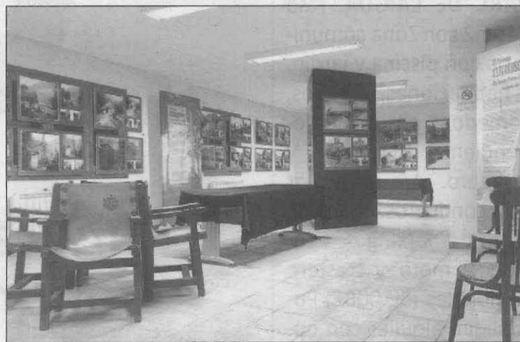
El programa preveu més de 50 activitats al Sobirà