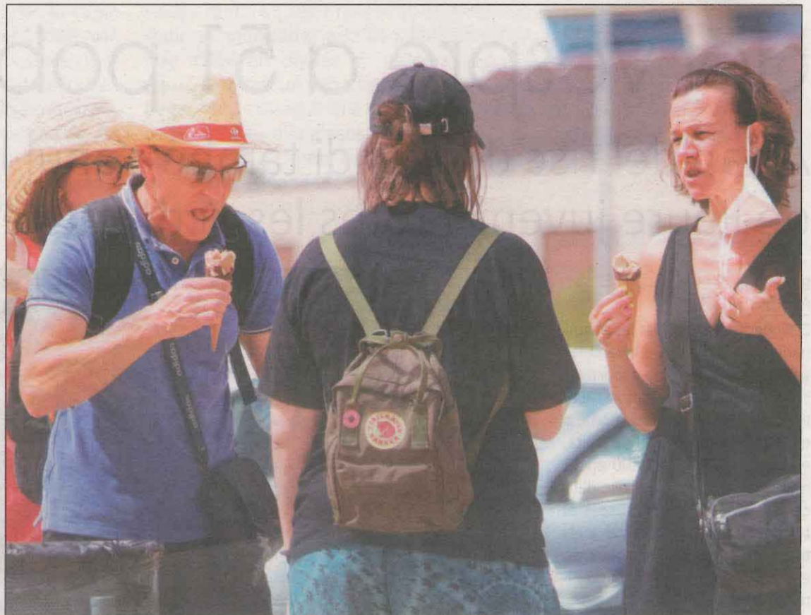
Els veïns de Ponent es van refugiar de la calor durant les hores centrals del dia

Per fer front a les altres temperatures, alguns ajuntaments han preparat refugis climàtics. És el cas de les Borges Blanques, on s'ha habilitat la sala Maria Lois i a l'Ajuntament es reparteix aigua fresca. La Paeria de Balaguer també va recordar als seus veïns que poden disposar dels refugis climàtics com el Jardí del Sant Crist o el Claustre de Sant Domènec. Des de l'Ajuntament de Tàrraga també van remarcar que les piscines municipals estan obertes i van demanar no banyar-se en llocs no permesos com els canals.