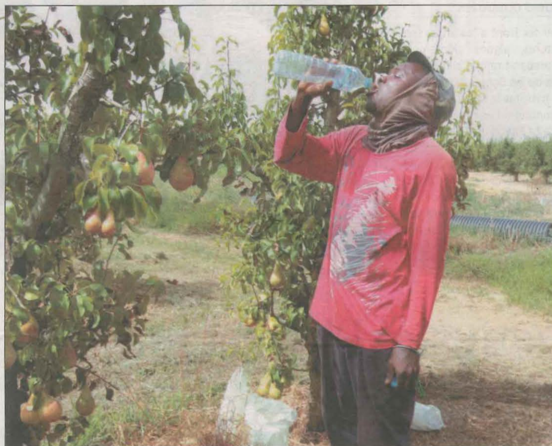
Hidratar-se sovint i portar gorra és essencial per combatre la calor mentre es cull

A causa de l'onada de calor també es prohibeixen les acampades i rutes i activitats esportives al medi natural. Amb tot, això no afecta les acampades reglades dins dels càmpings perquè