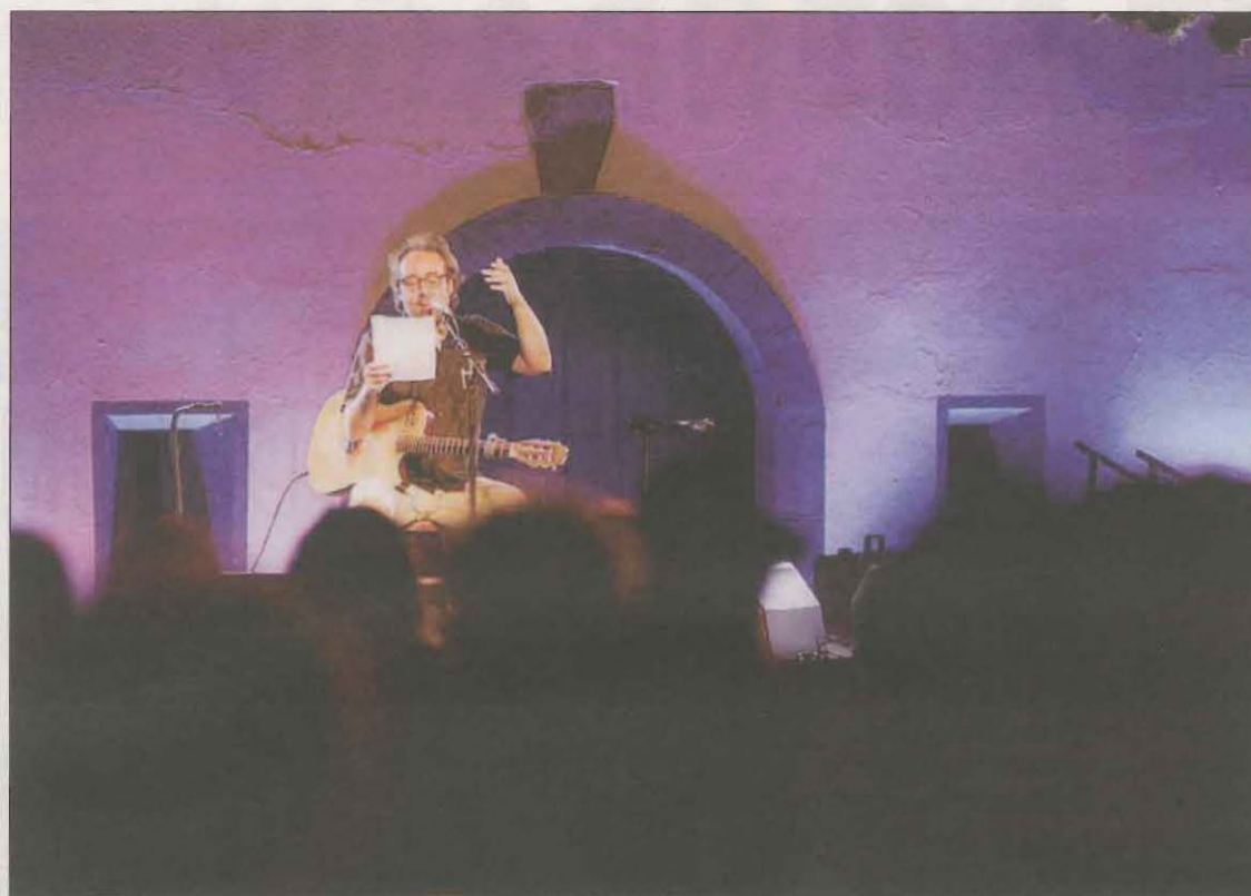
Roger Mas ha sido uno de los artistas que ha actuado en ese pintoresco escenario

El público al que van dirigidas las propuestas abarcan todas las edades y están pensadas para las comarcas vecinas "con sensibilidad musical y ganas de pasar un buen rato a la fresca" en un espacio identificativo del municipio como es la Ermita de Sant Miquel del Pui, "el origen de nuestro pueblo". El precio de las entradas oscila entre los 16 y 18 euros, con acceso gratis para los menores de cinco años. "El perfil del público que buscamos es de entre 30 y 60