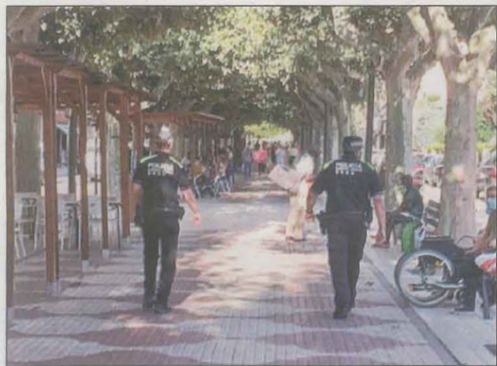
Imatge de dos agents de la Policia Local

Els Bombers van realitzar ahir un sanejament de façana en un edifici situat al carrer Domènec Cardenal de Mollerussa. Van ser informats a les 10.45 hores que l'arrebossat estava en mal estat i perillava amb caure. Així, fins al lloc es va desplaçar una dotació per tal de treure'l. A Seròs, a les 20.59, hores van caure unes teules d'un edifici del carrer de la Fira.