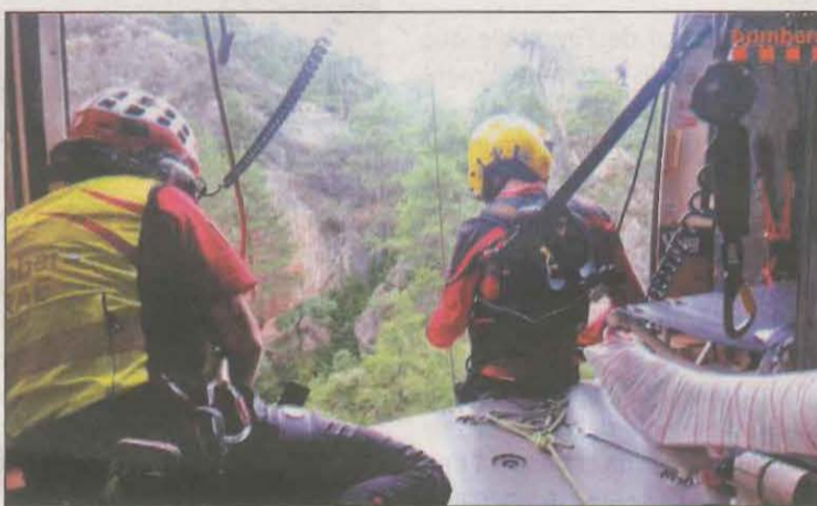
Moment d'un rescat que es va fer recentment

tinuar. A les 12.30 hores van anar a la presa de Cavallers per un home que s'havia marejat i va caure rodant fins a l'aigua, patint un esquinç a l'omòplat. A l'Alt Àneu van fer un total de dos rescats, el primer a les 14.46 hores quan una persona es va torçar el turmell i el segon a les 15.34 hores per una persona que es trobava indisposada. Finalment, a Castell de Mur, concretament a l'embassament de Cellers, van rescatar dues persones a les quals se'ls hi havia bolcat un caiac i una d'elles tenia principi d'hipotèrmia.